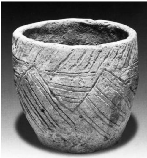
图3 塔城卫校遗址出土的陶器

塔城卫校遗址(图3、4)位于塔城市西北角、乌拉斯台河东西两岸的台地上。墓葬区位于河东岸,墓室由卵石或石板构建而成,多为土葬,少见火葬。随葬品以陶器为主,均为火候不高的夹砂灰陶,以各种无耳直口、斜腹或折肩的平底罐为主,有少量的圜底小钵。器表纹饰较丰富,有三角划纹、篦纹、指甲纹等。遗址位于河西岸,与墓葬所出器物基本一致,应属同一时期遗存。墓葬出土陶器质地、形制、纹饰等特征都与安德罗诺沃文化联合体中的费德罗诺沃类型和七河类型的墓葬一致。