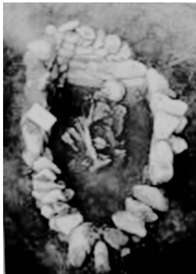
图4 塔城卫校遗址出土的串珠