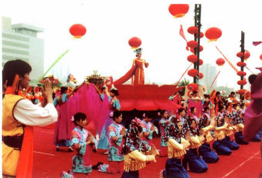
第二届中国·天津妈祖文化旅游节开幕式上的演出