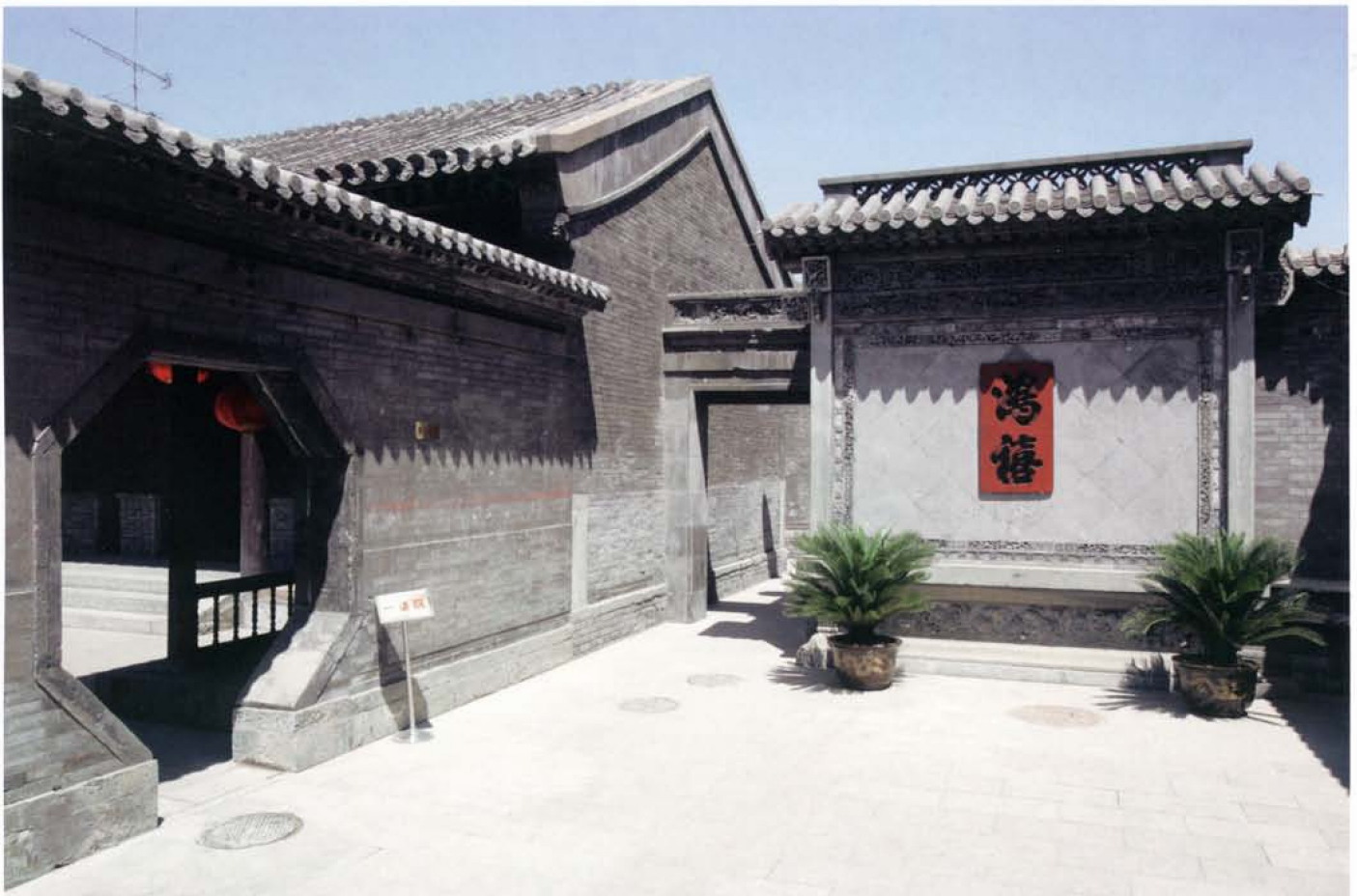
传统民居中的影壁