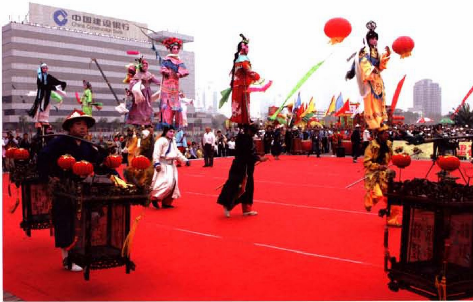
茶炊子及节节高表演