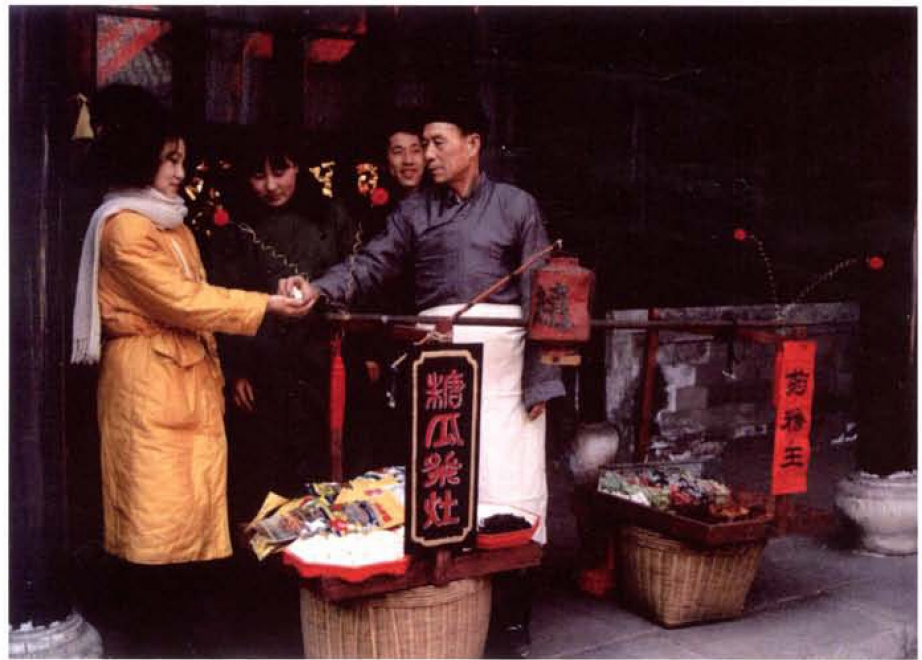
新时代女孩子亦可以享用糖瓜