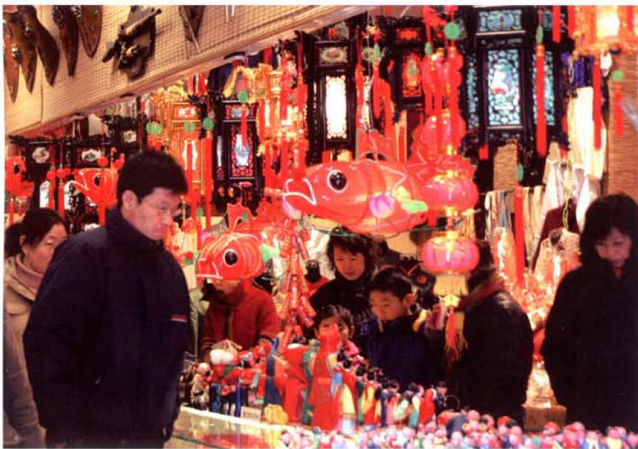
灯节,买个灯笼祈福求吉