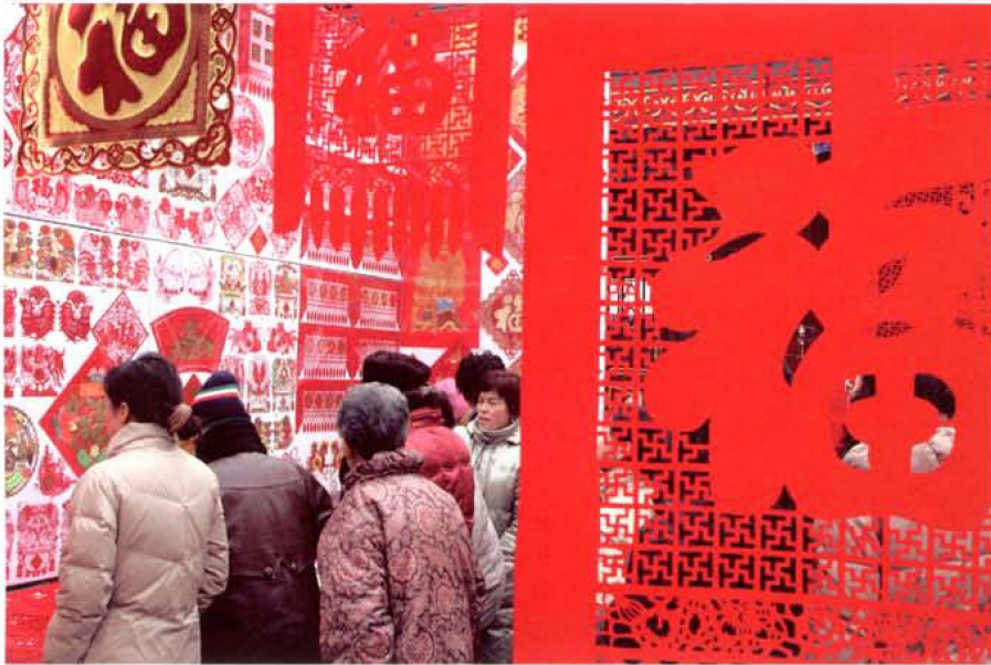
腊月为“帖倒暑”准备的各类剪纸贴饰布满街市