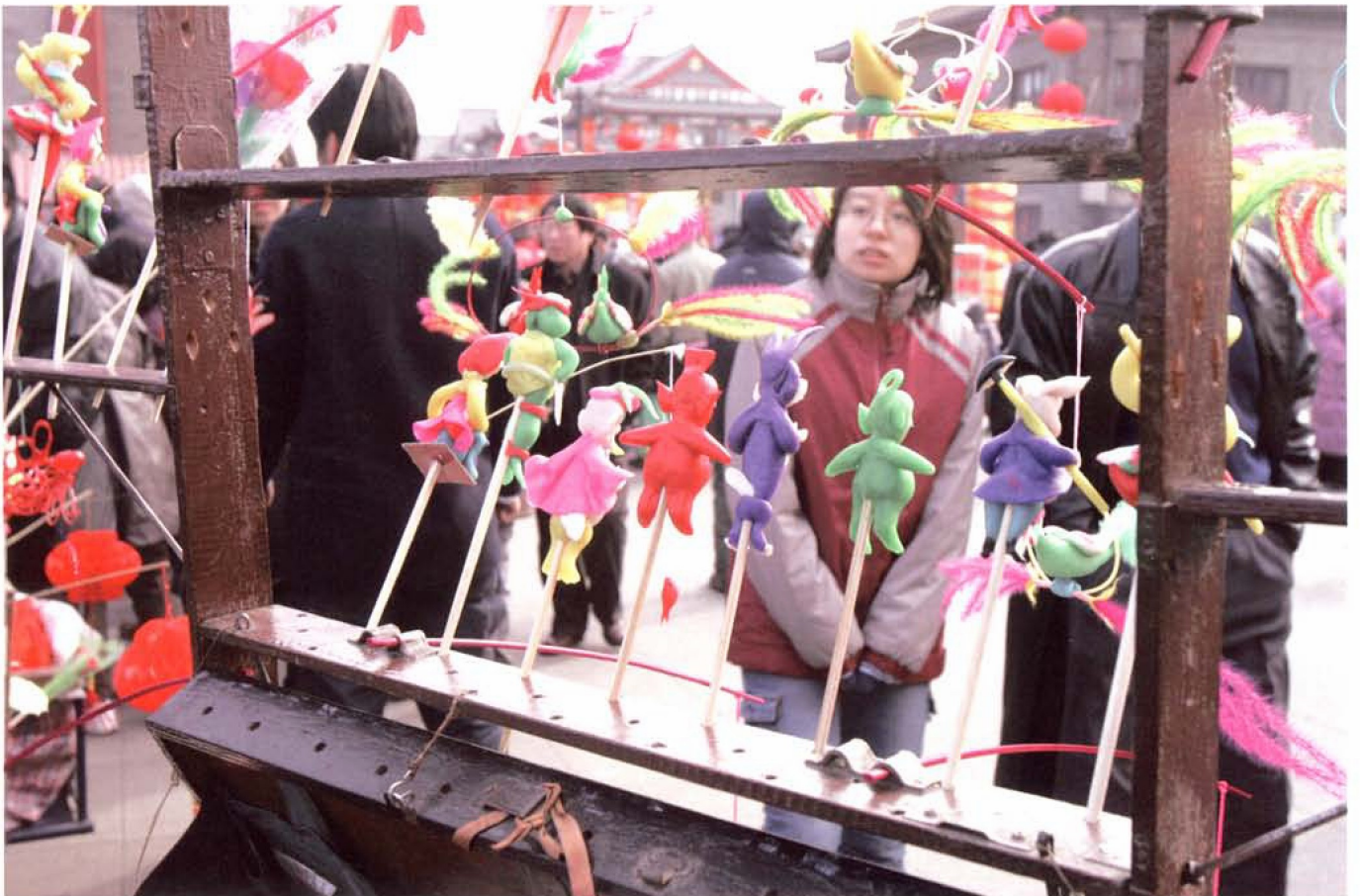
年货市场上的捏面人儿摊