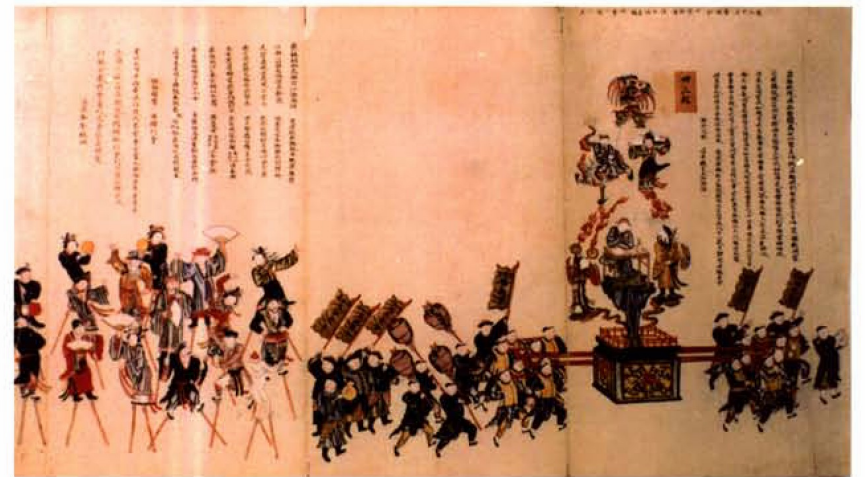
天津天后宫皇会行会图之抬阁表演