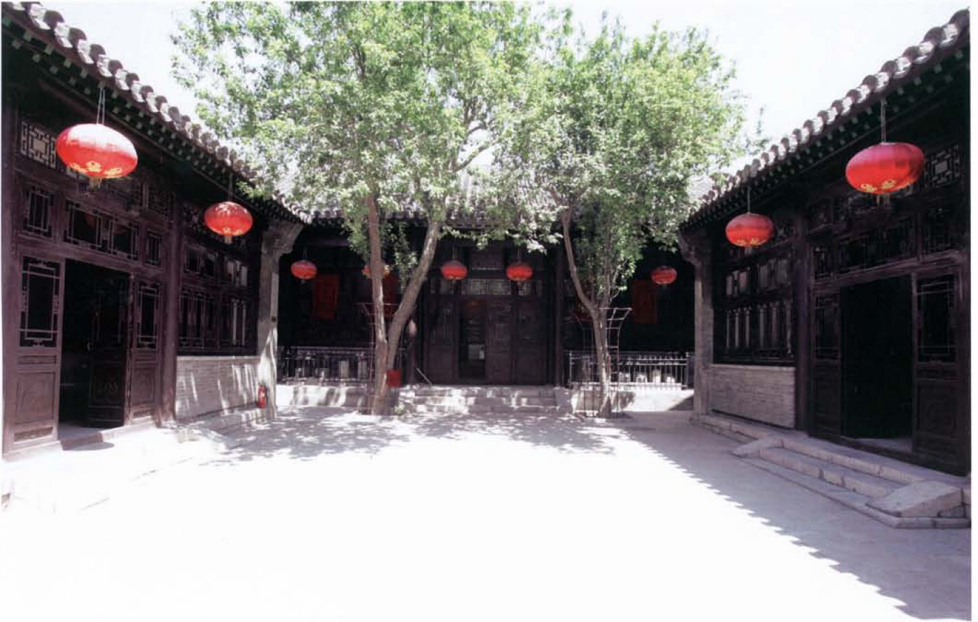
传统民居四合院(现老城博物馆所在地)