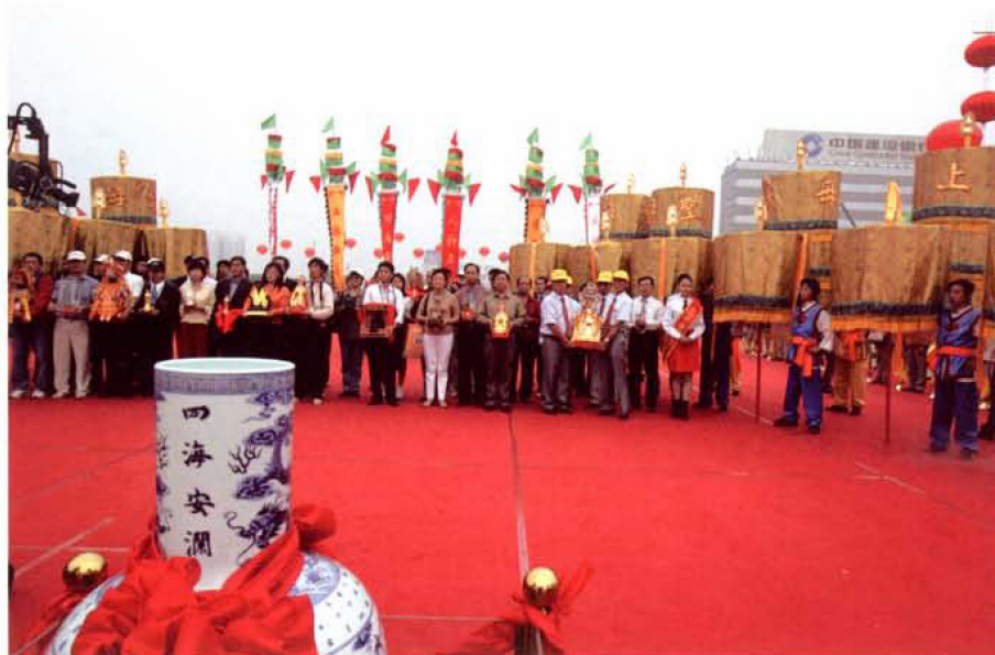
第二届中国·天津妈祖文化旅游节开幕式上举行“水土合一”及“安座大典”仪式