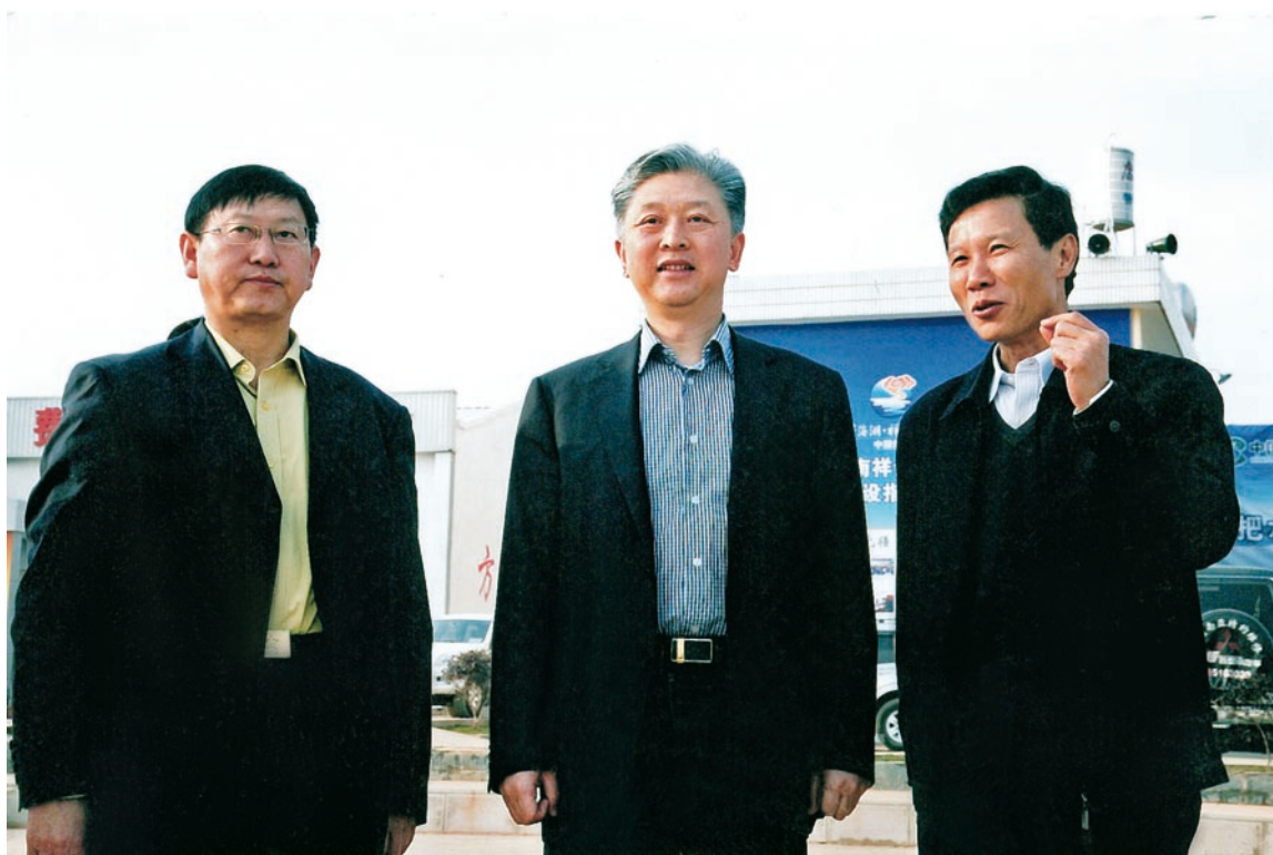
2011年3月25日，政协云南省委员会副主席顾伯平在祥云调研