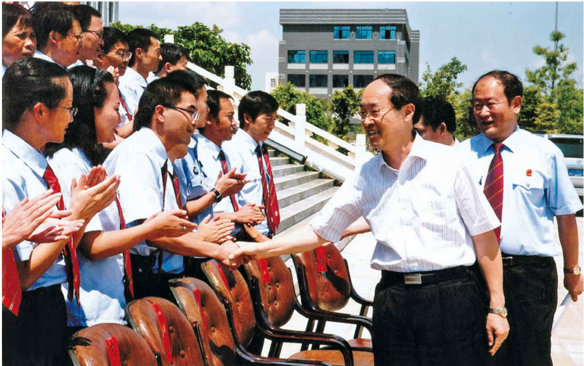
2011年7月19日，最高人民法院副院长万鄂湘在祥云调研