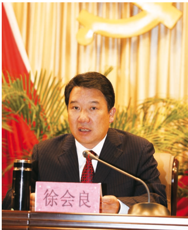
徐会良作常委会工作报告