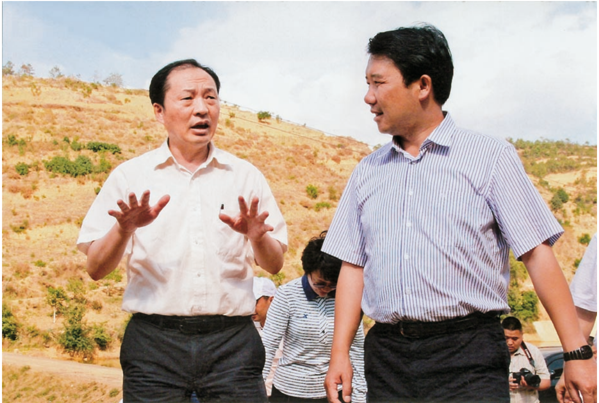
2011年5月15日，中共大理州委书记刘明在米甸调研