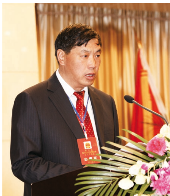
祥云县人民政府县长王正林在会议上