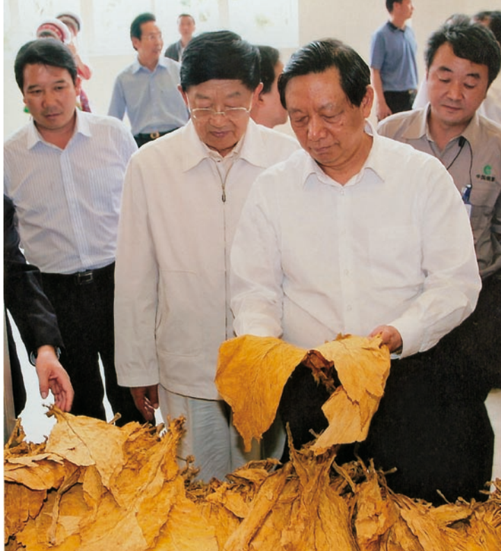
2011年5月17日，国家烟草专卖局局长姜成康、中共云南省委书记白恩培在烟叶复烤厂调研