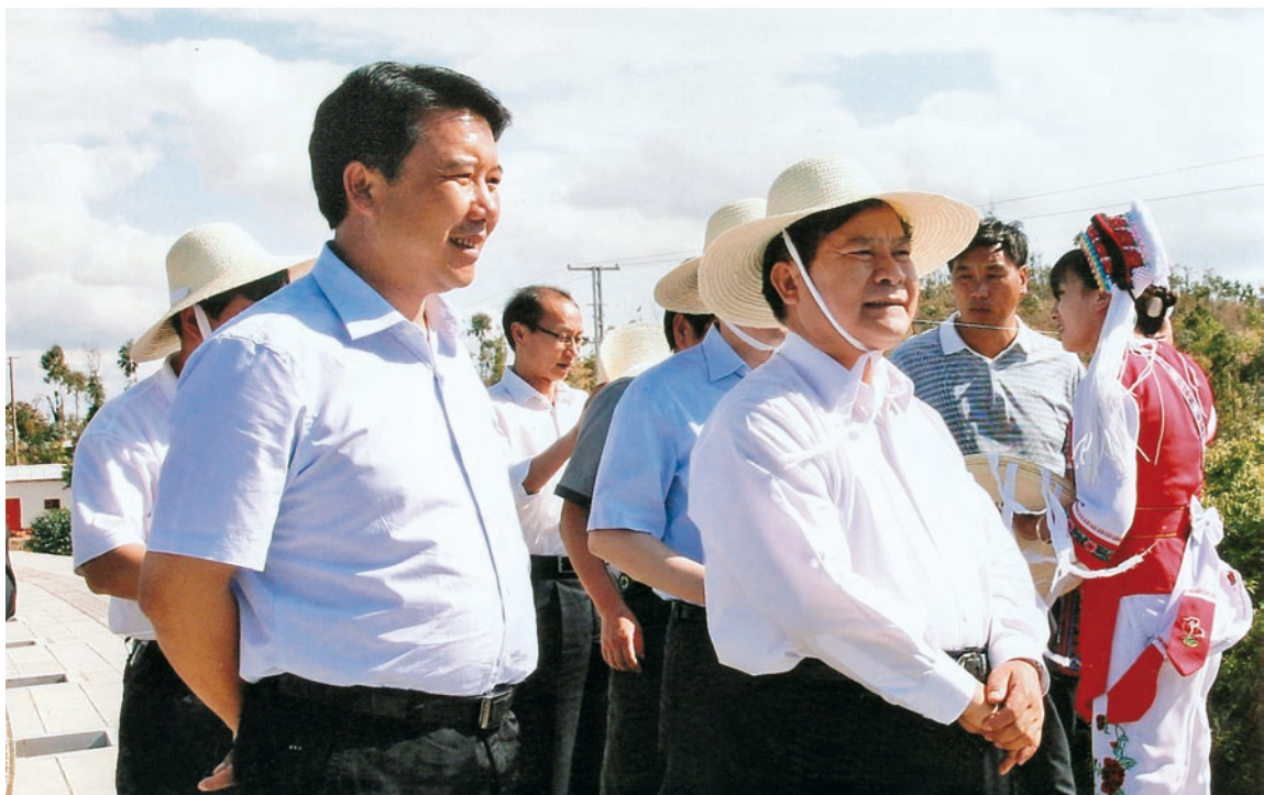
2011年6月17日，中共云南省委副书记李纪恒在祥云调研