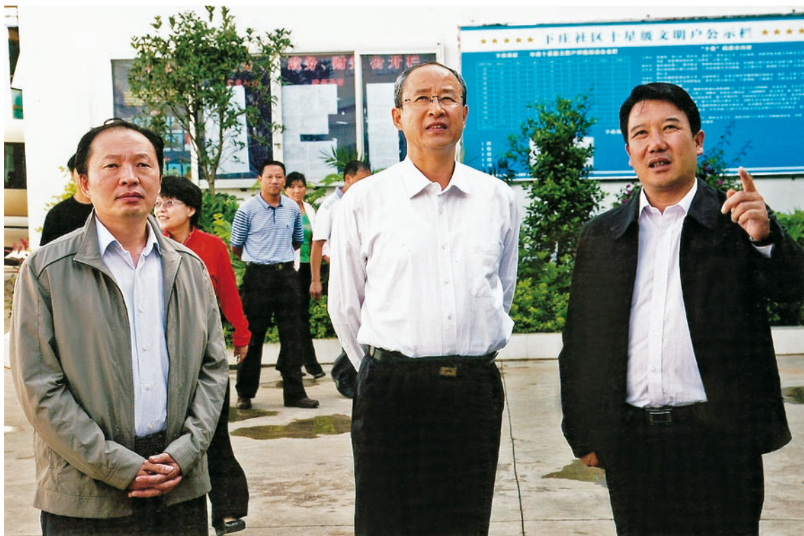
2011年8月23日，中共云南省委常委、组织部部长刘维佳在祥云调研