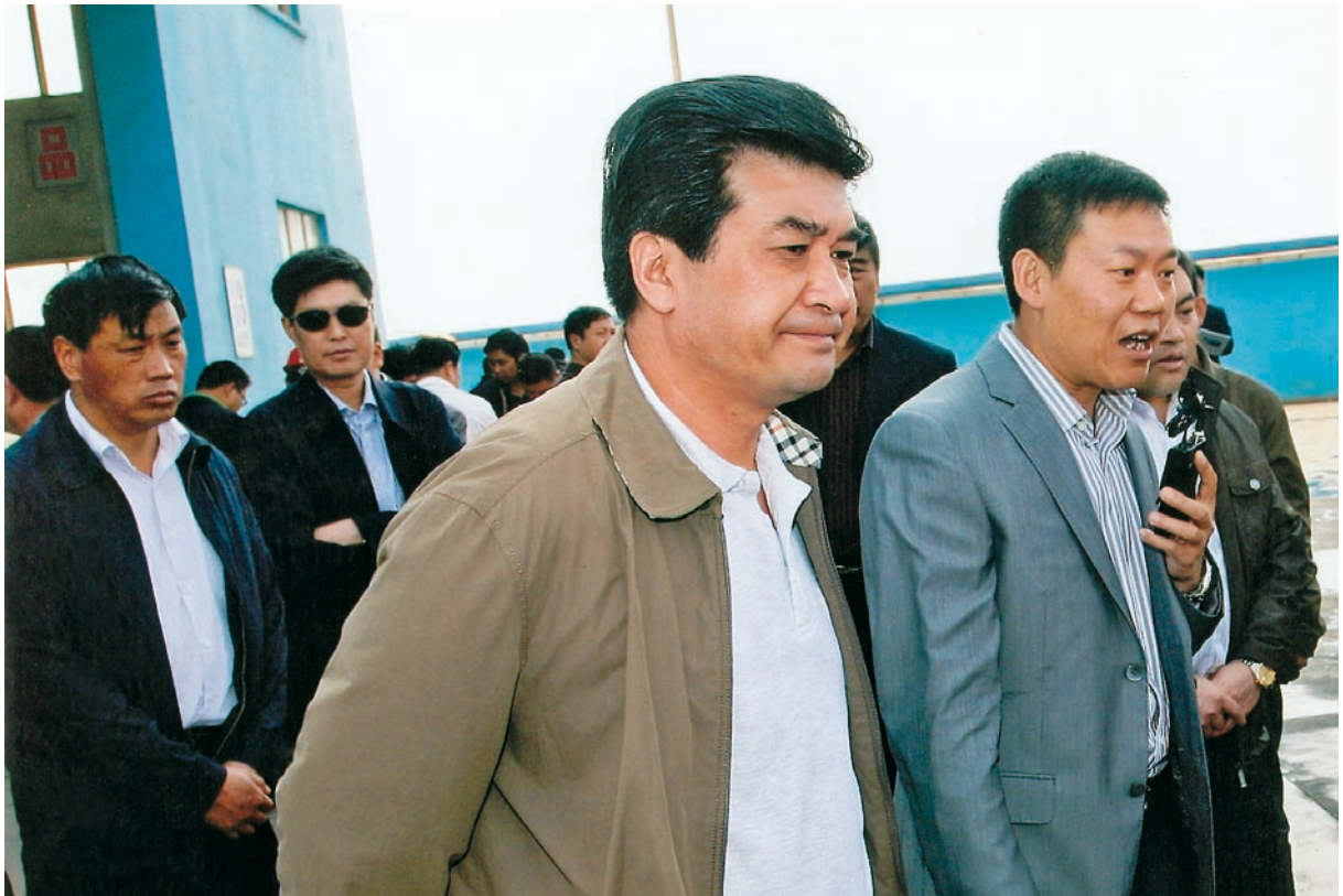
2011年4月26日，州人民政府州长何金平在飞龙公司调研