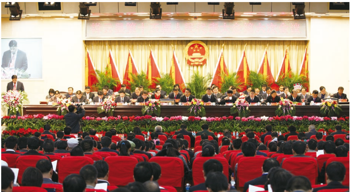
祥云县第十五届人民代表大会第六次会议全体会议会场

2012年2月10~15日，祥云县第十五届人民代表大会第六次会议、中国人民政治协商会议祥云县第七届委员会第五次会议在县行政会务中心召开。