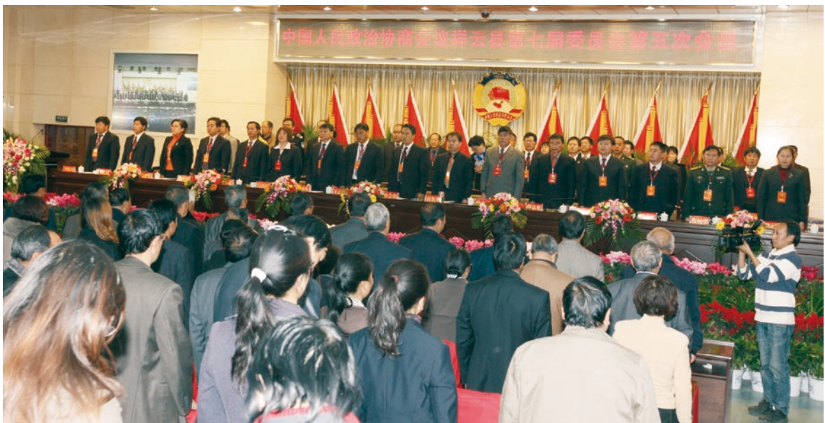
中国人民政治协商会议祥云县第七届委员会第五次会议会场