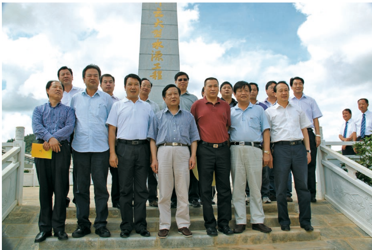
2011年9月14日，中央财经领导小组农村局局长谢德新（前排中）、国家烟草专卖局纪检组长潘家华等领导调研指导中国烟草云南祥云大型水源建设