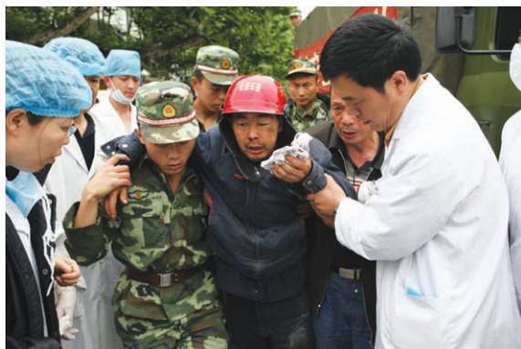
救护人员把伤员及时救出危险地带