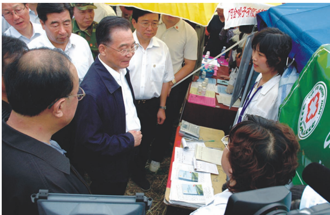
国务院总理温家宝在彭州视察治疗救护工作