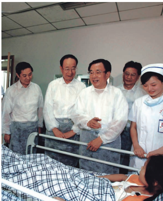
中共中央政治局常委、中央纪委书记贺国强（中），中共四川省委书记刘奇葆（左一）看望地震受伤的儿童