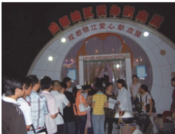
凌晨时分的献血屋