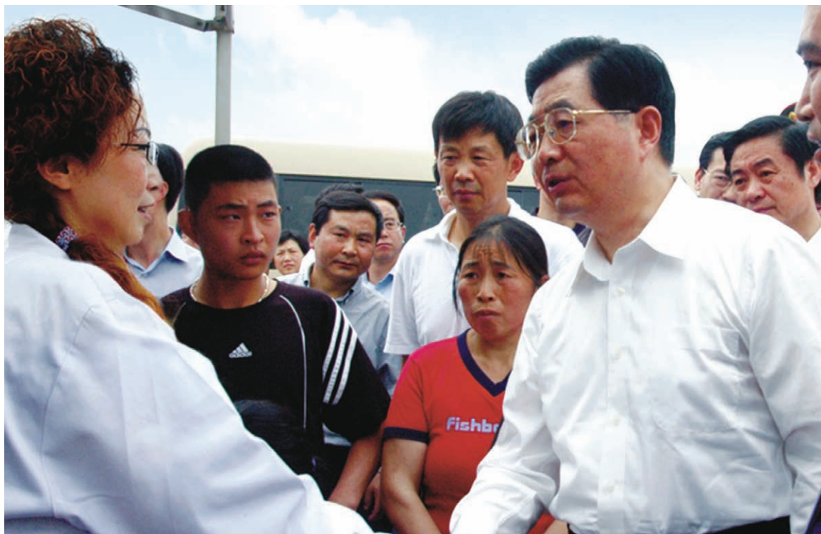
中共中央总书记胡锦涛亲切慰问抗震救灾的医务人员