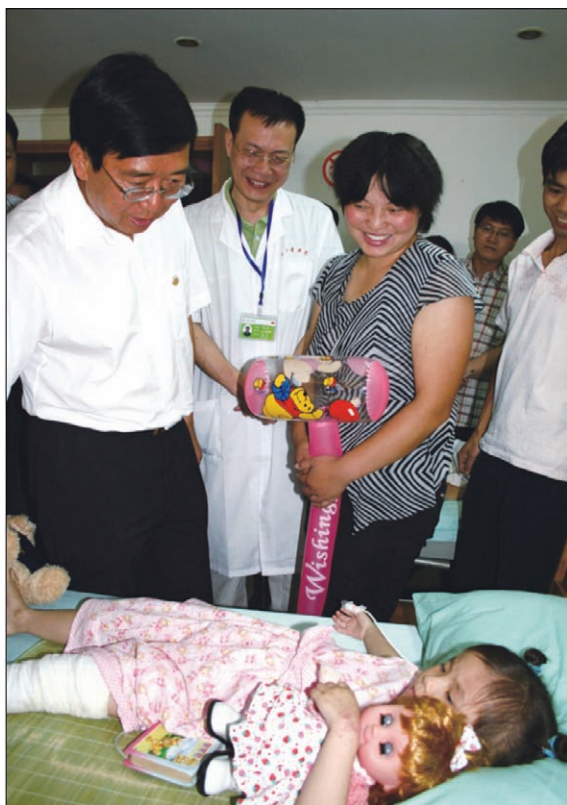
中共成都市委书记李春城看望地震受伤儿童