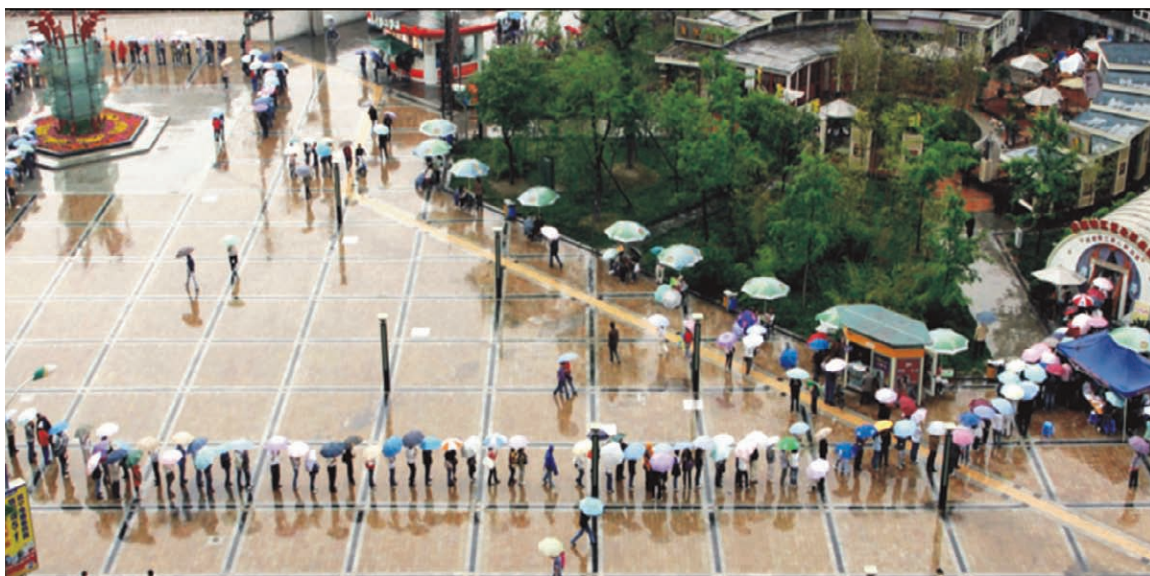
2008年5月13日，雨中的献血队伍