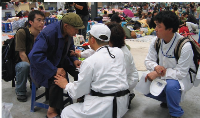
到灾民安置点进行心理干预