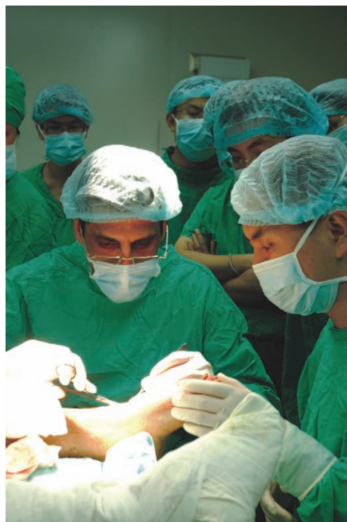
英国专家为地震伤员做手术