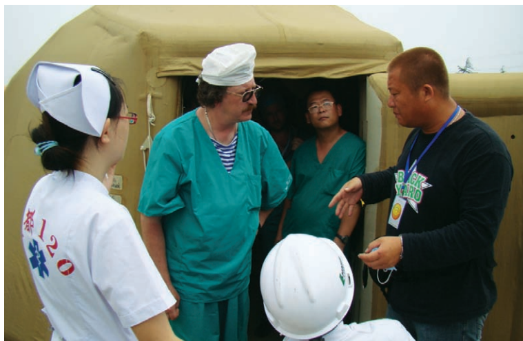
俄罗斯医疗队在彭州