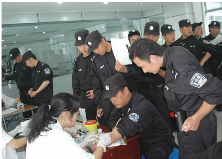
2008年5月24日，50位来自石家庄市公安特警支队的警察，刚从灾区抗震救灾归来，第二天就要离开成都，走之前为灾区人民再作一次贡献——献血。