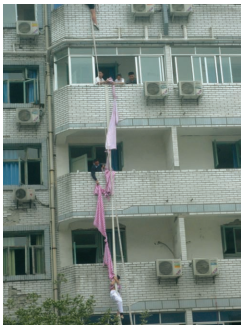
都江堰市中医医院的医护人员用消防水带和床单救助病员

在重灾区，医护人员在生命受到巨大威胁的情况下，以生命拯救生命，日夜鏖战在救死扶伤第一线