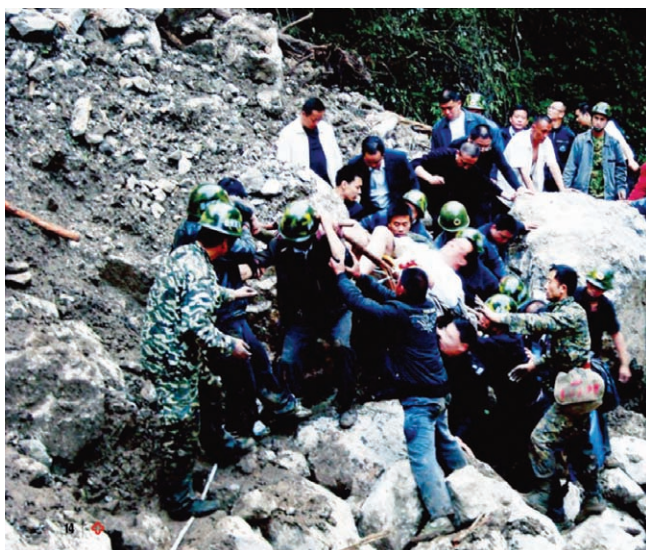
医护人员在废墟中抢救伤员