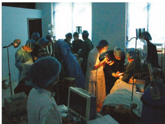
医务人员在手电筒光照下施行手术