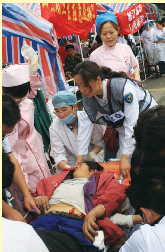
医务人员在十分简陋的条件下实施现场急救