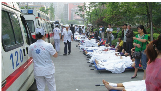
把大批伤病员转移到安全地带