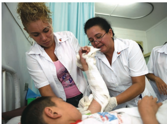
古巴医疗队救治灾区儿童