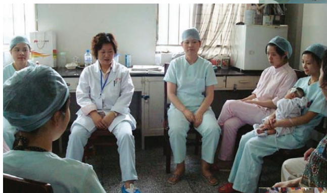
为灾区伤员做心理辅导