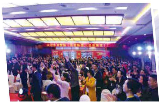
学员们在课堂上激情澎湃