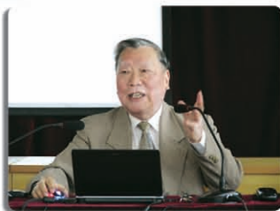
中国工程院院士、中国矿业大学银川学院名誉院长陈清如为学生作《中国能源》专题报告