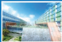
西交利物浦大学理学院大楼