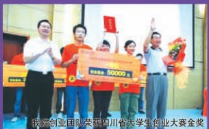
锦城学院创业团队荣获四川省大学生创业大赛金奖

这是一所培养学生会做人、能做事的学校 这是一所将劳动和创业纳入必修课程的学校 这是一所给大学生打下中华民族五千年文化烙印的学校 这是一所充满科学民主和现代精神的学校 这是一所就业率极高的学校 这是一所将改变学生一生的学校