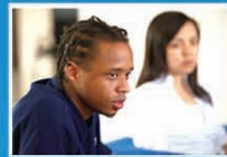
利物浦大学的 交换生在中国