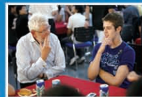
利物浦大学的 交换生在中国