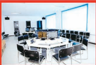
● 网络信息安全实验室