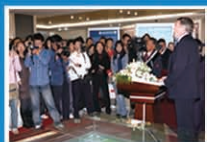
英国国务大臣来访