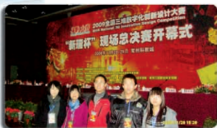
我院学生在2009年全国三维数字化创新设计大赛总决赛中获二等奖