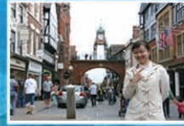
学生在英国交换学习