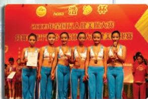
我院学生在全国万人健美操大赛宁夏赛区获得第一名,全国总决赛中获得三等奖