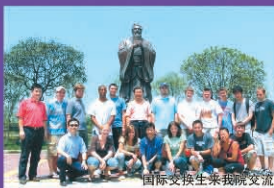
国际交换生来我院交流