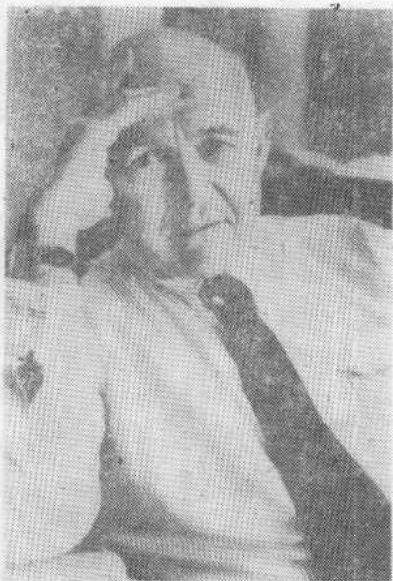
美国芝加哥大学社会学教授詹姆斯·科尔曼