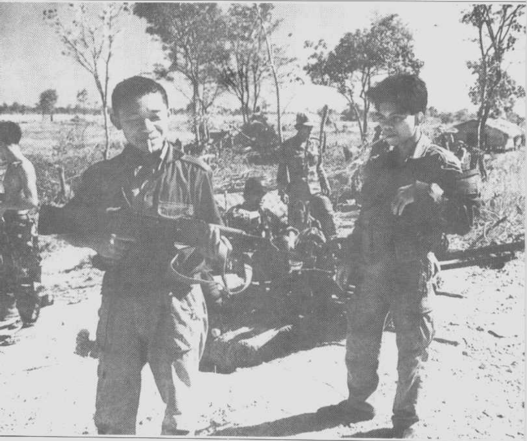
与红色高棉游击队作战间隙的政府军正在检查缴获的武器。