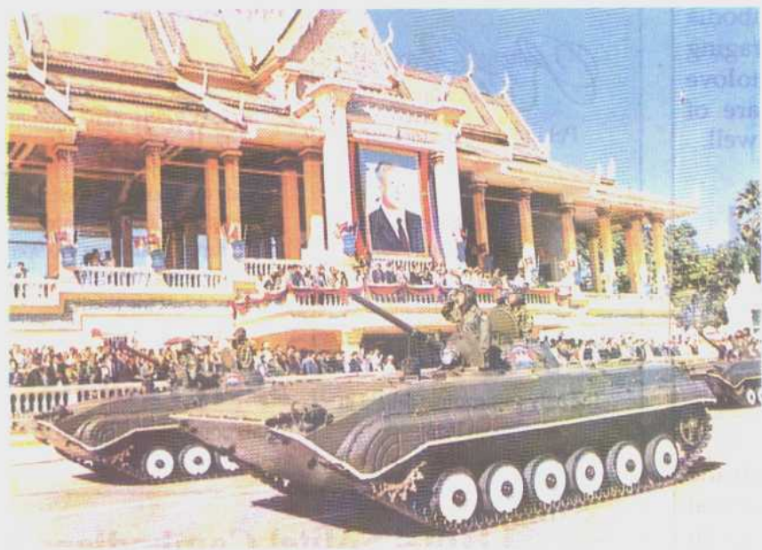
在庆祝柬埔寨独立 40 周年游行仪式上的场面。