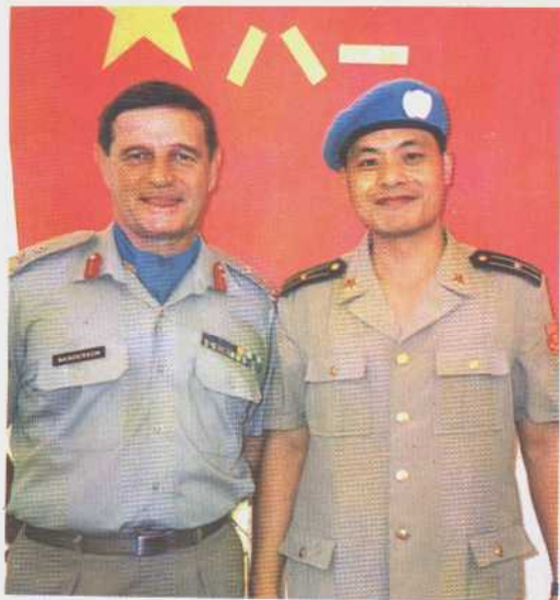
VNTAC 驻柬司令桑德森中将 和作者在一起。

1993年作为中国政府派出的联合国军事观察员,赴柬埔寨参加维持和平行动。在这里密集的战云笼罩之下,与外军同行们一道,穿行于古迹吴哥窟内外的丛林旷野,无数次经历雷炸炮轰,无数次经历死亡威胁,成功完成使命,获“维和勋章”一枚。