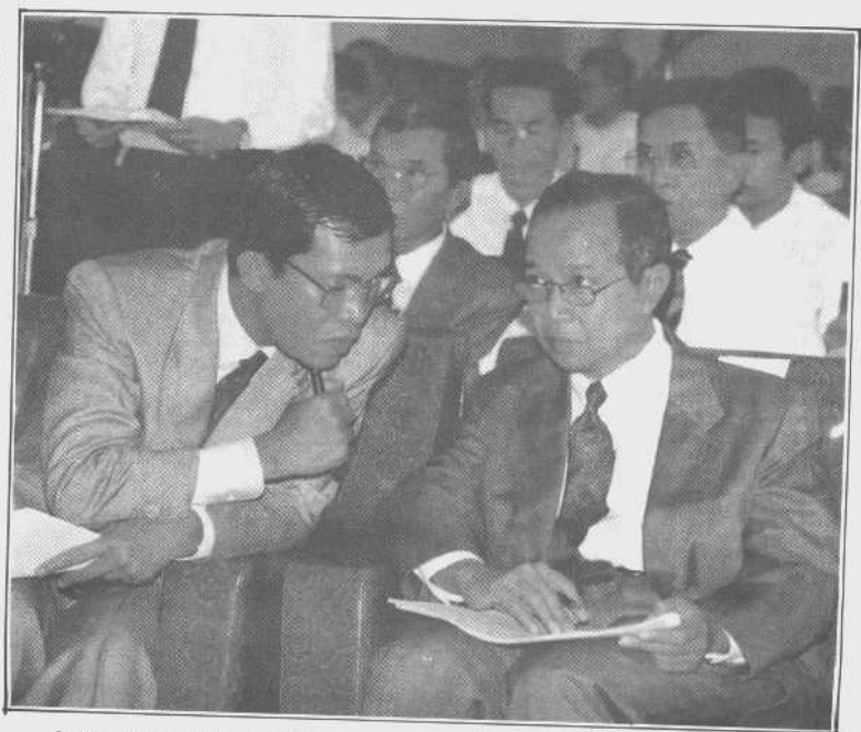
柬埔寨王国的两位新首相：拉那烈王子和洪森。