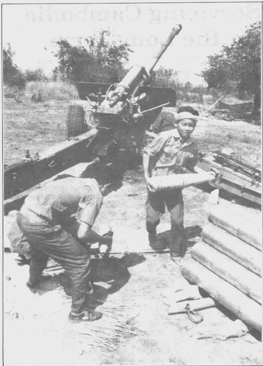
正在与红色高棉进行炮战的政府军炮兵。