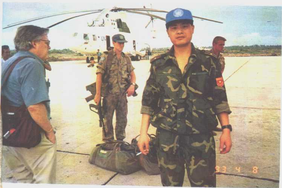
从金边抵达暹罗时在暹罗机场留影。