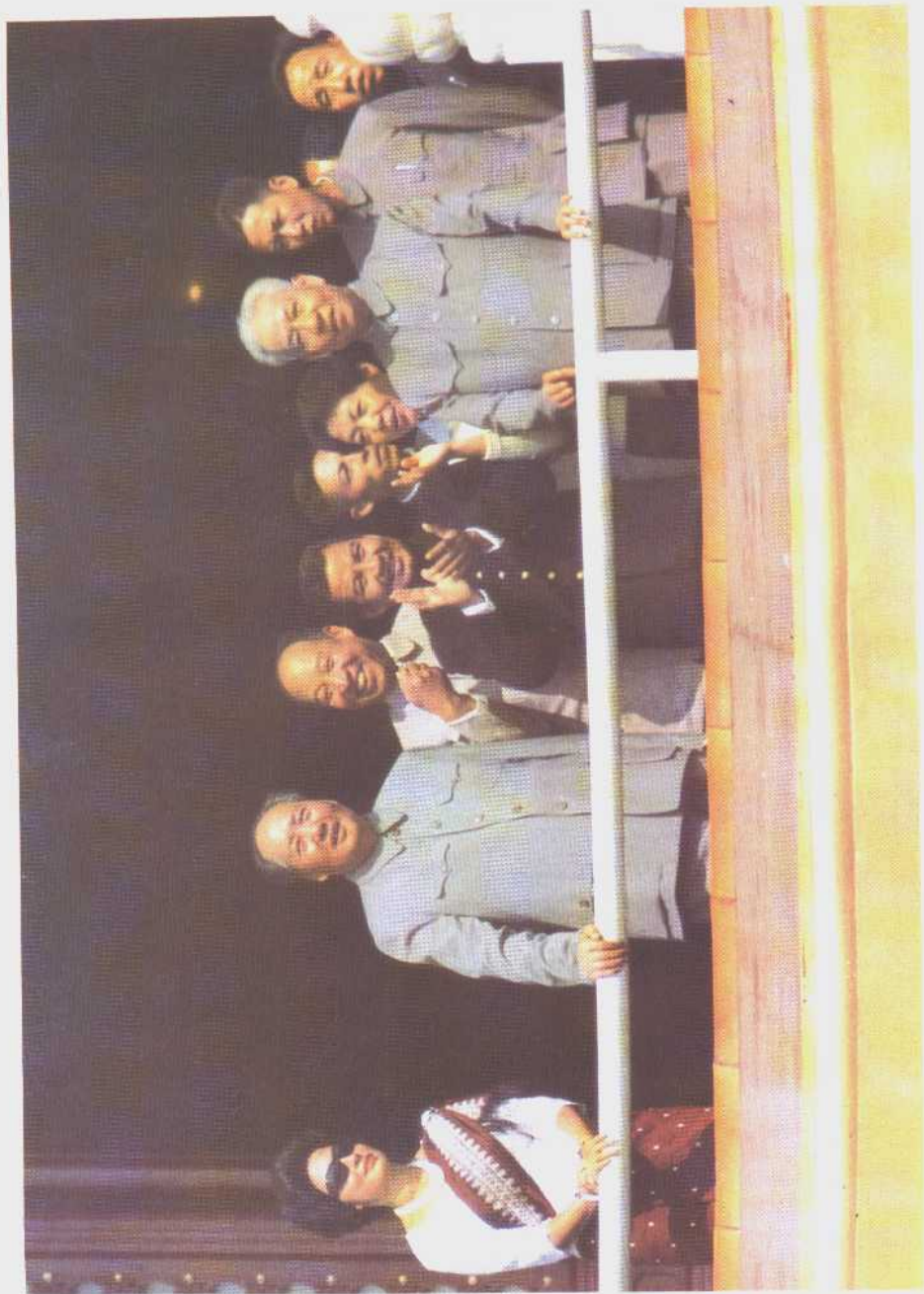
1955年10月1日，毛泽东、刘少奇和柬埔寨国家元首诺罗敦·西哈努克亲王及夫人莫尼克公主在天安门城楼上。