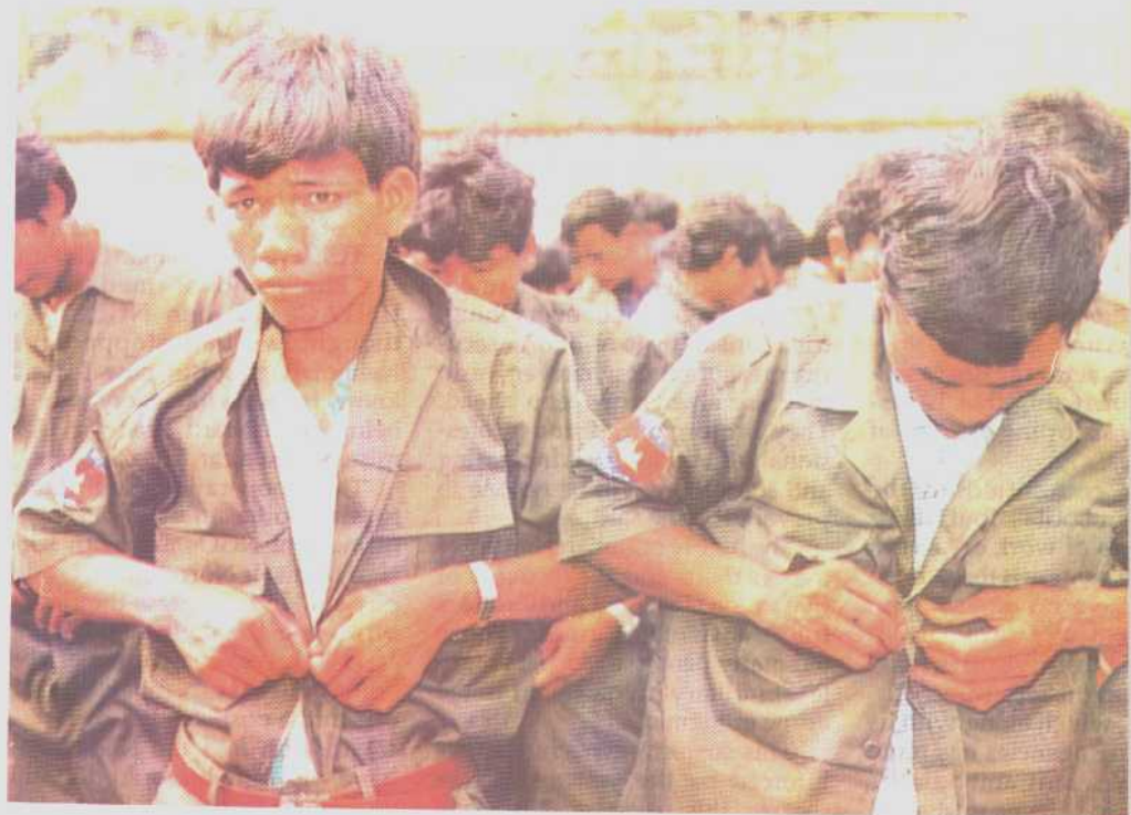
脱离民柬部队的士兵穿上了新成立的政府军军装。