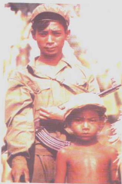
红色高棉战士和村里一小男孩。