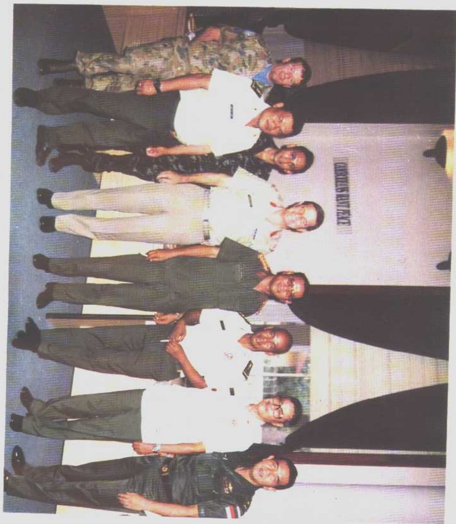
图为维合部队司令桑德林中将与参选三方总长在会议后留影