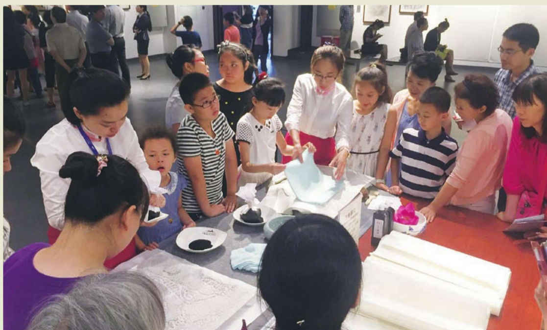
◎展览期间小学生在工作人员帮助下动手制作拓片