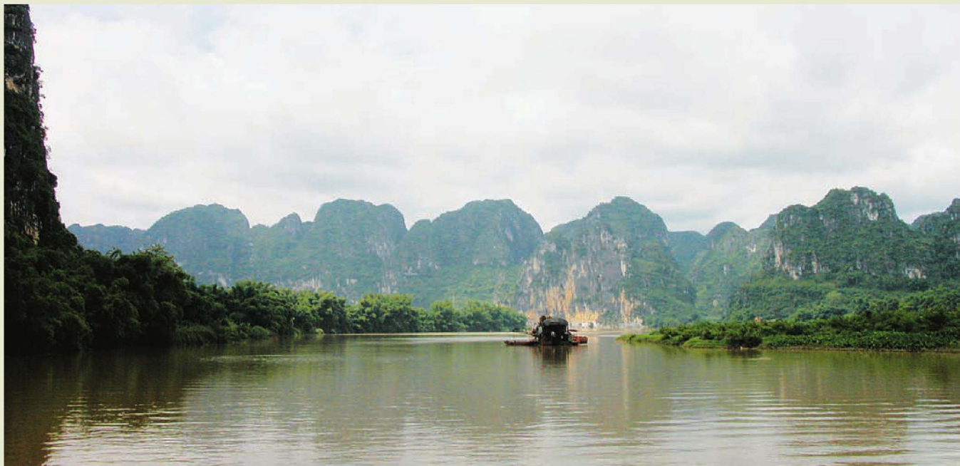
◎左江花山岩画环境