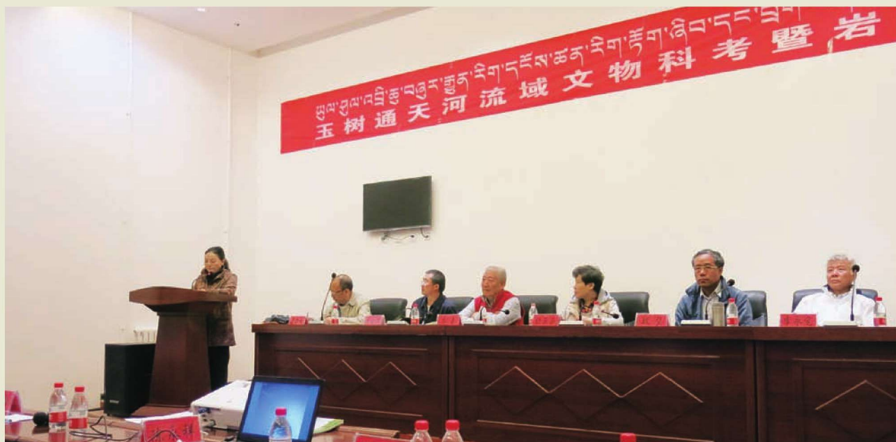
◎首届“玉树通天河流域文物科考暨岩画学术论坛”现场

◆ 2016年8月28至31日，由青海省玉树州文体局、玉树州文物管理局、玉树州博物馆共同举办的首届“玉树通天河流域文物科考暨岩画学术论坛”在青海省玉树州博物馆召开。来自全国各地的考古专家、岩画专家、藏学专家及相关学者共40余人参会。