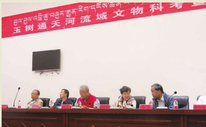
◎与会专家聆听发言

近年来，玉树文物工作者们在玉树州通天河流域的田野调查中，陆续发现了一批新的岩画遗迹。这些极具研究价值的岩画，对丰富玉树地区及青藏高原古人类活动的实物资料，研究青藏高原历史发展、文化变迁等问题都有着重要意义。（樊志威/文）