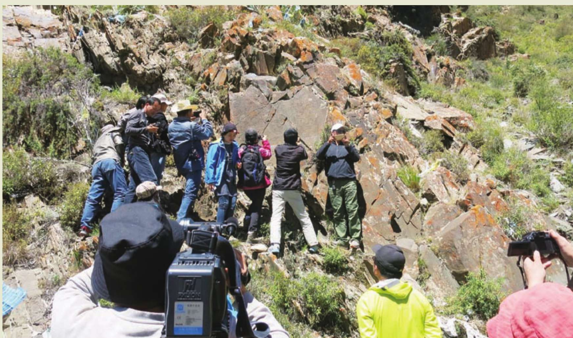
◎与会专家学者们对岩画进行实地考察（二）