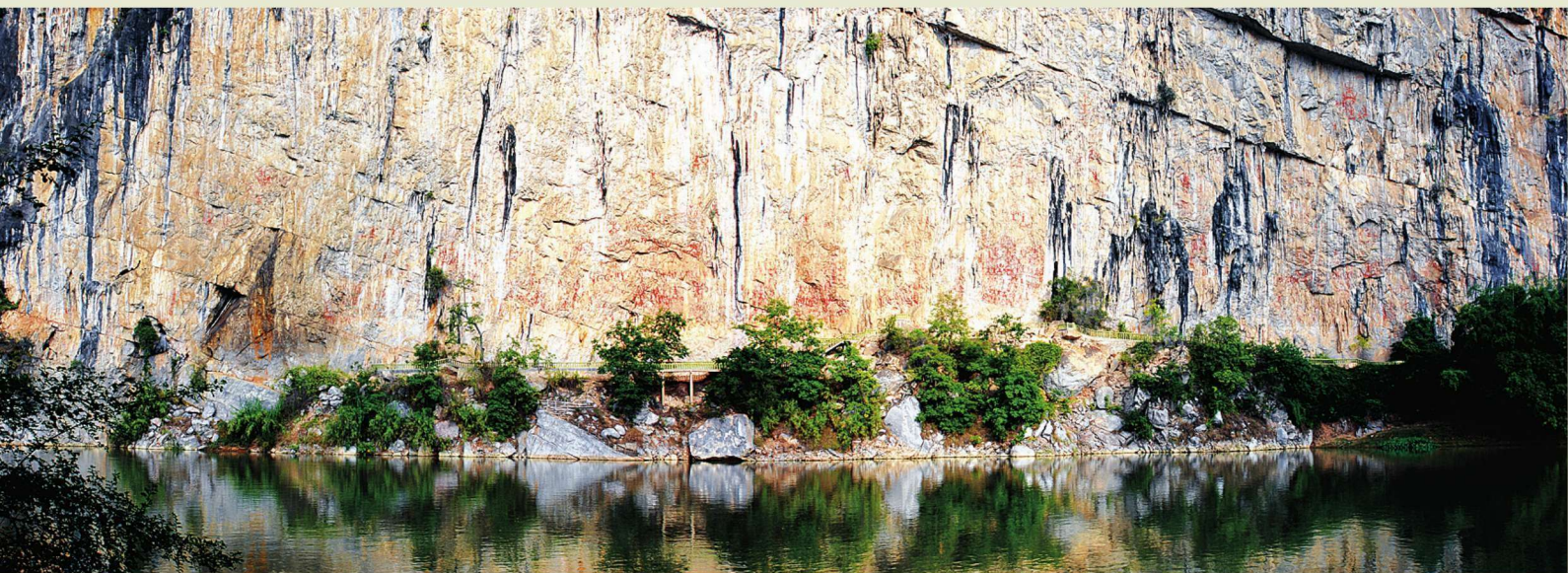
◎左江花山岩画全景