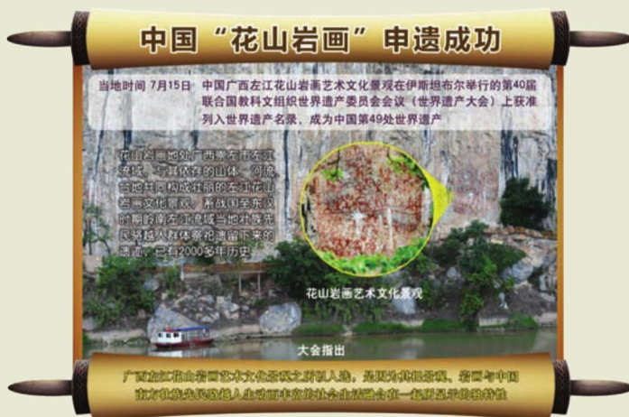
◎广西左江花山岩画申遗成功的新闻报道

此次申报的遗产分四个遗产区，共38个岩画点。宁明县为第一遗产区，含4个岩画点；龙州县为第二遗产区，含16个岩画点；江州区和扶绥县为第三遗产区，含18个岩画点。38个岩画点可分为109处、193组，图像总数为4050个，其中人物图像3315个，器物图像621个。图像包括铜鼓、羊角钮钟、细钮钟（铃）、环首刀、有格或有首剑、扁茎短剑、渡船、男女交媾图、动物等内容。（樊志威/文）