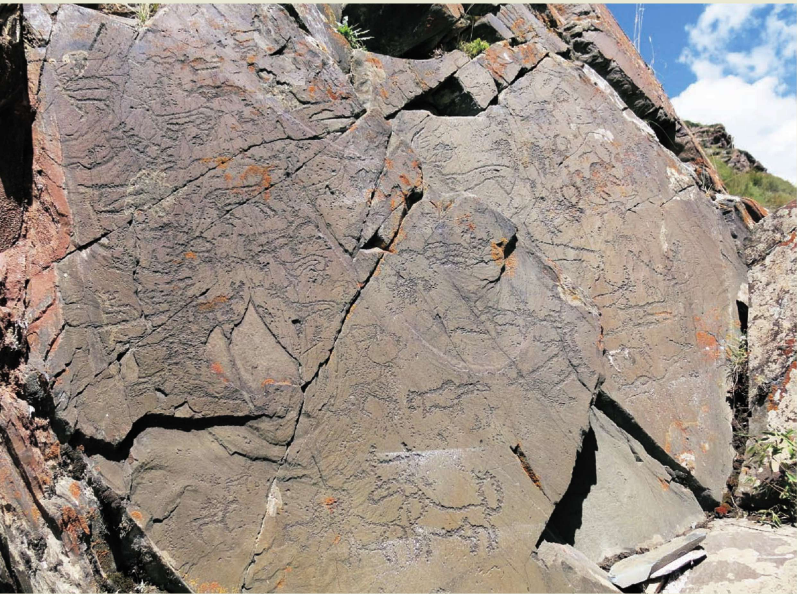
◎ 玉树通天河流域岩画