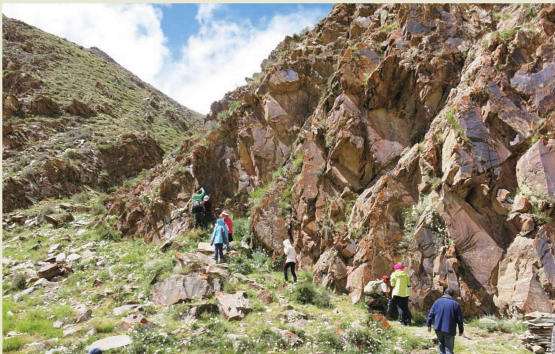
◎与会专家学者们对岩画进行实地考察（一）