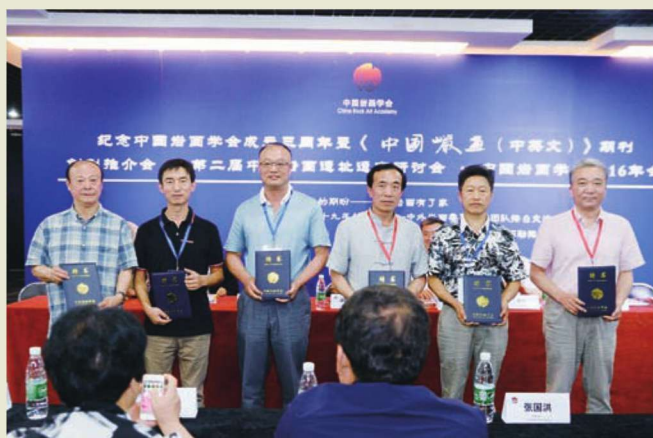
◎《中国岩画（中英文）》编辑委员会成员代表获颁聘书