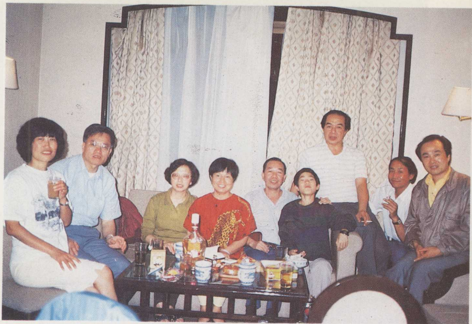
中秋前夕在北京紫玉饭店共尝广东月饼