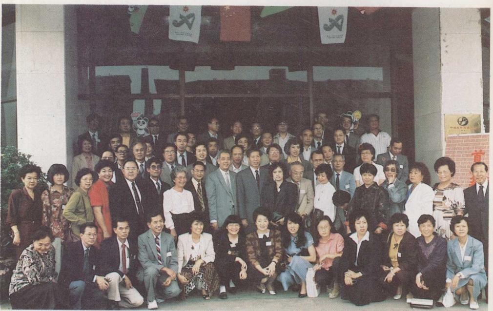
首届华文教学研讨会全体代表及工作人员大会闭幕后在紫玉饭店门前合影