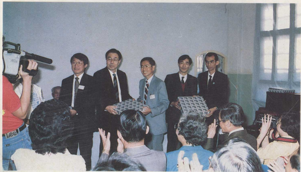
参加首届华文教学研讨会的代表在北京华侨学生补习学校四十周年校庆典礼上向北京、广州、集美三所侨校分别赠送纪念品