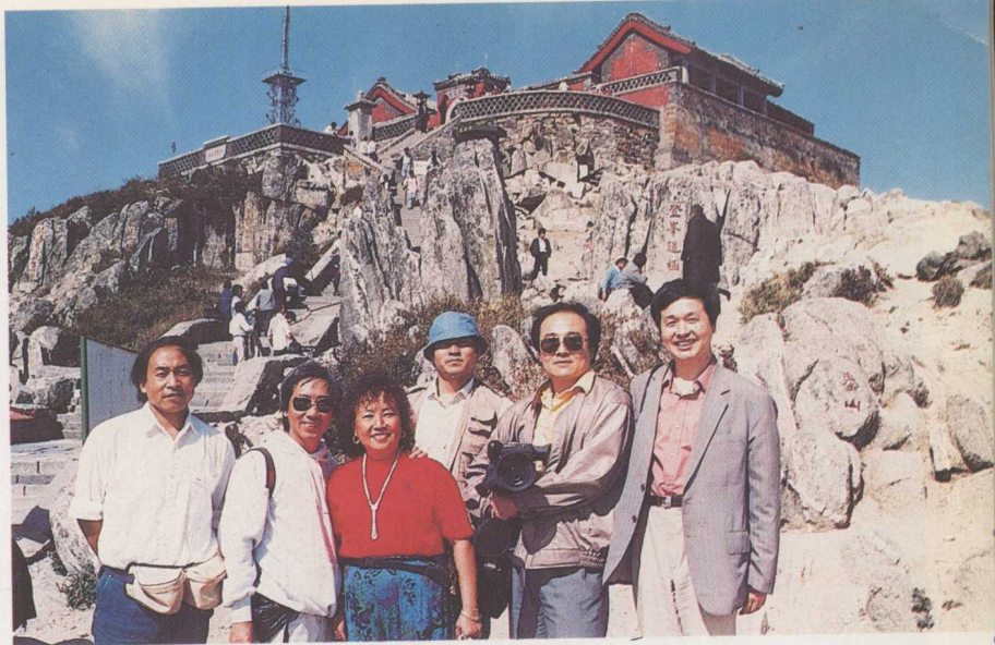
游览山东泰山时在玉皇顶旁留影