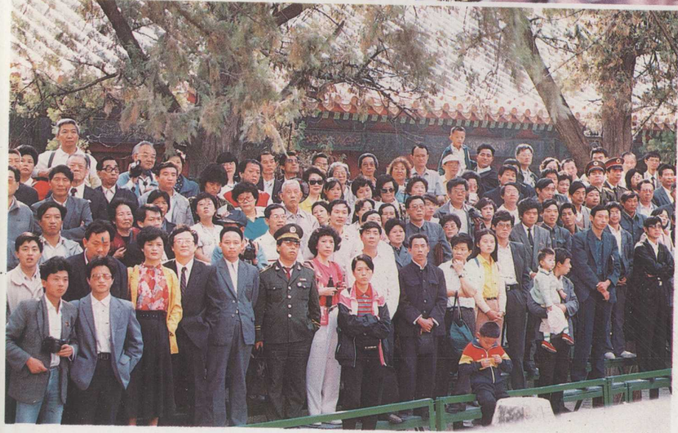
在山东省曲阜参加纪念孔子二五四一周华诞辰活动