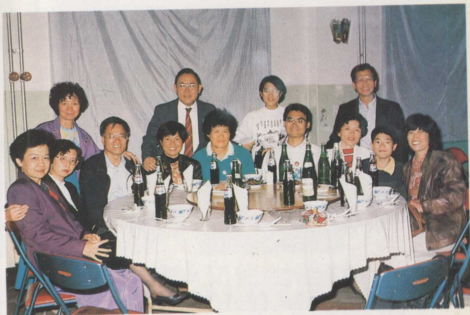
来自北美洲、欧洲、大洋洲等国家的代表难得相会在北京，分别前再留一个影