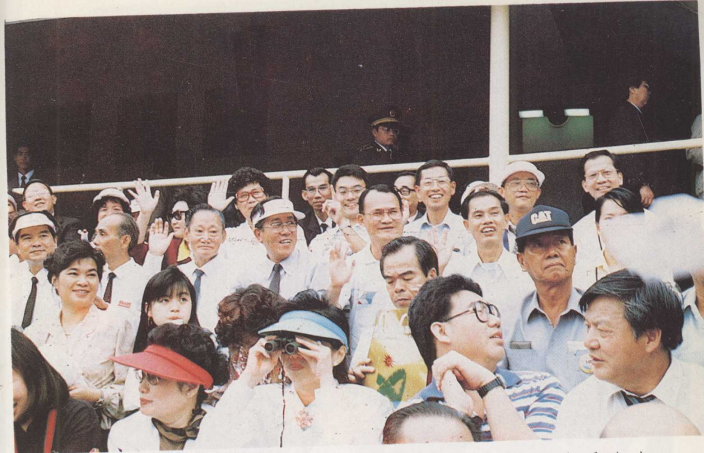
参加第十一届亚运会开幕仪式，这是部分代表在看台上。