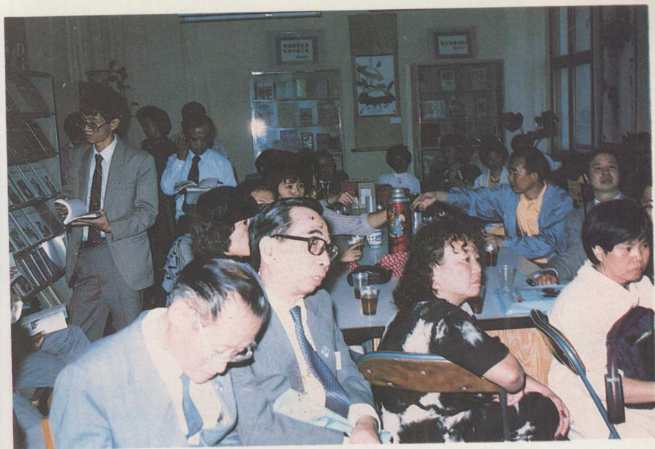
在北京中国语言文化学校教材阅览室交流并观看声像教材。