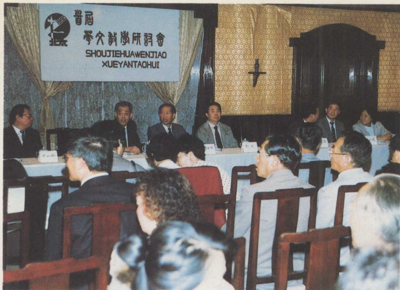
国务院侨务办公室副主任李星浩先生（左3）、 司长王棠先生（左2）、副司长郭瑞先生（左4） 在研讨会开幕式主席台上。