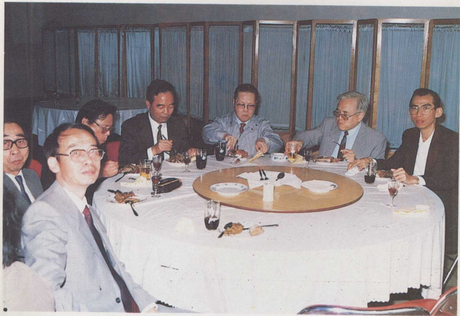
招待会上与中国的对外汉语教学专家们在一起