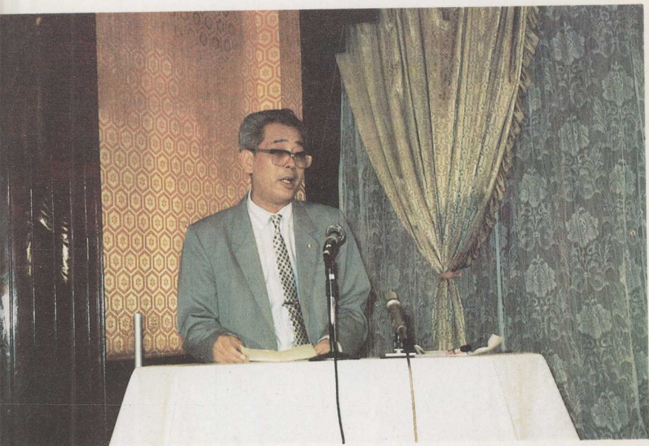
王棠先生致闭幕词