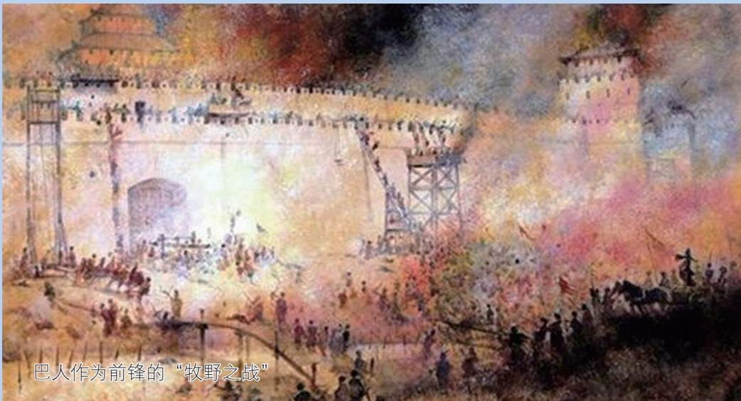
巴人作为前锋的“牧野之战”