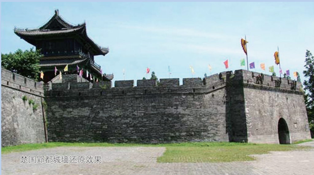
楚国郢都城墙还原效果

人多了，条件好了，人们就追求文化娱乐生活。当时的郢都常常举办一些大型音乐、舞蹈汇演来满足市民的需求，于是来自各地的艺术精英们经常汇聚于此施展技艺。