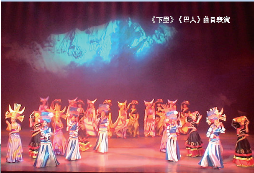
《下里》《巴人》曲目表演

其实，巴人并非是一个只懂打仗不懂生活艺术的民族。他们通过盐业达到衣食无虞后，也追求精神享受。劳动之余，他们在地头、树边围成一圈，席地而坐，边歌边舞，手舞足蹈，形成了自己独特的歌舞风格。其中有两支最著名的舞曲，一支叫《下里》，一支叫《巴