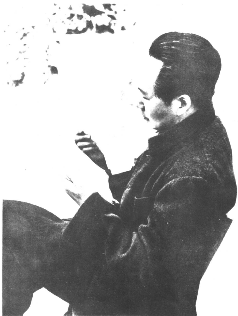
1946年毛泽东在审阅文件