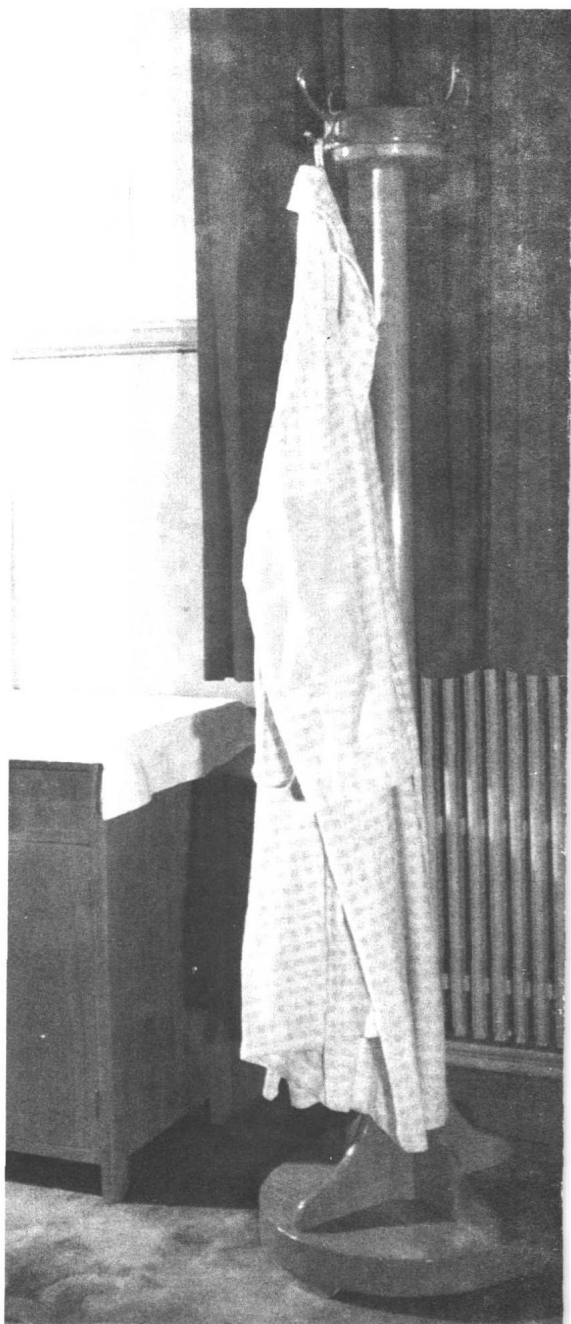
毛泽东穿过的绒布睡衣，肘部打了补丁。