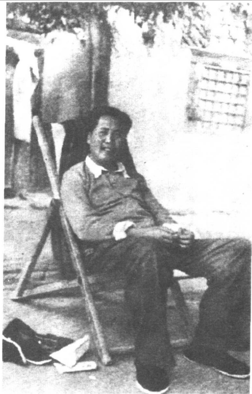
毛泽东身穿羊毛衫,在躺椅上休息