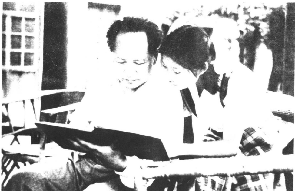
1951年毛泽东和李敏一起看影集