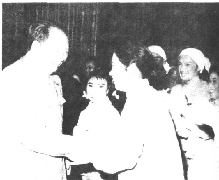
毛泽东观看豫剧现代戏《朝阳沟》时和豫剧表演艺术家常香玉握手