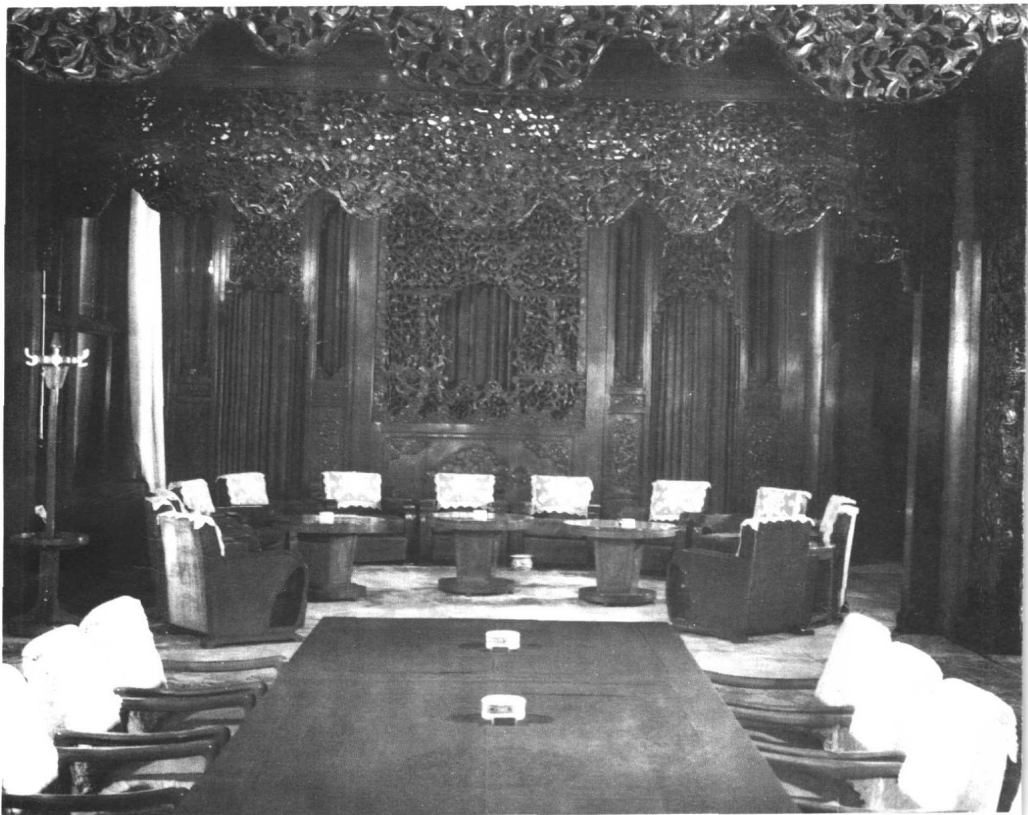
毛泽东在中南海会客厅