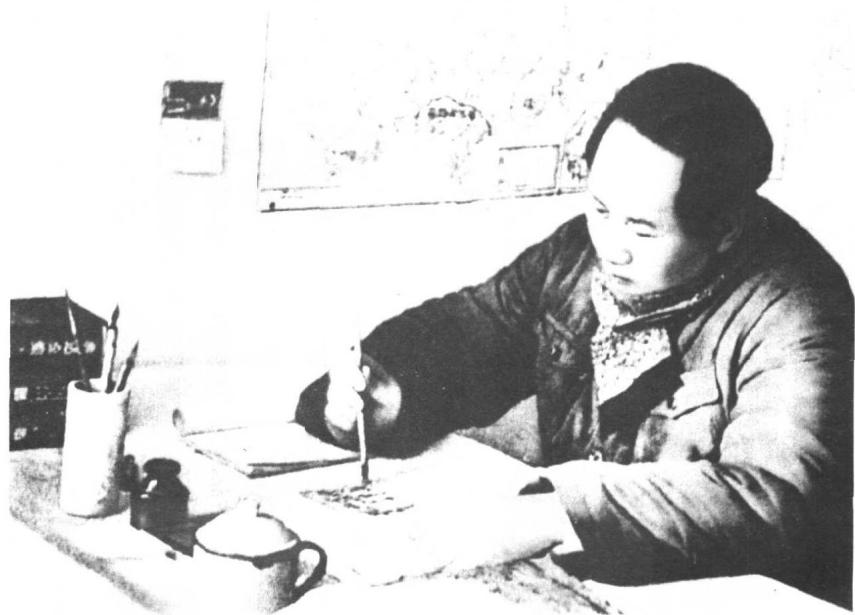
1946年毛泽东在枣园窑洞工作