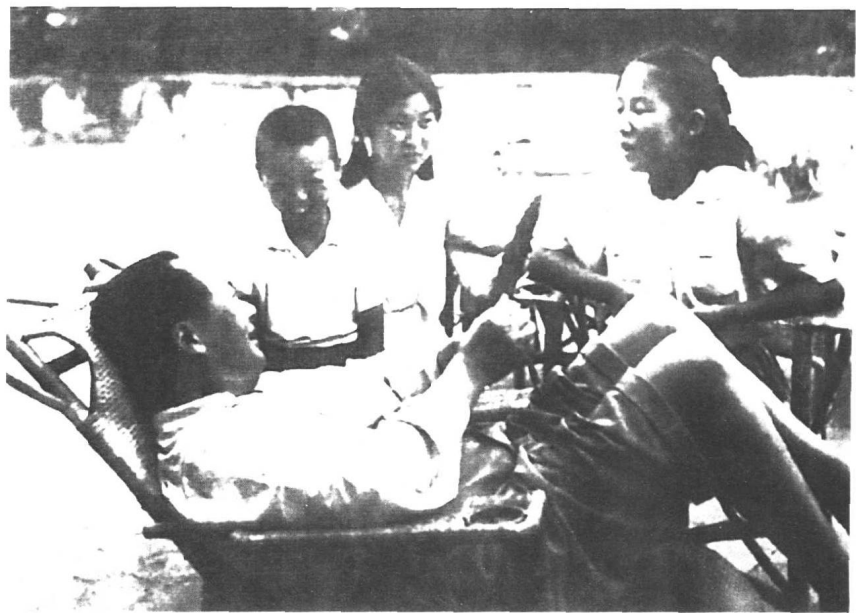
1951年8月9日，毛泽东同长女李敏、次女李讷等在香山讲故事。