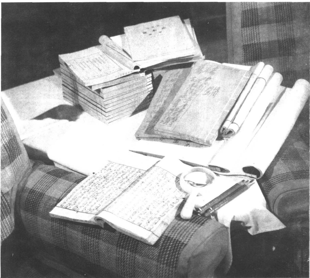
毛泽东阅读过的《资本论》等书。