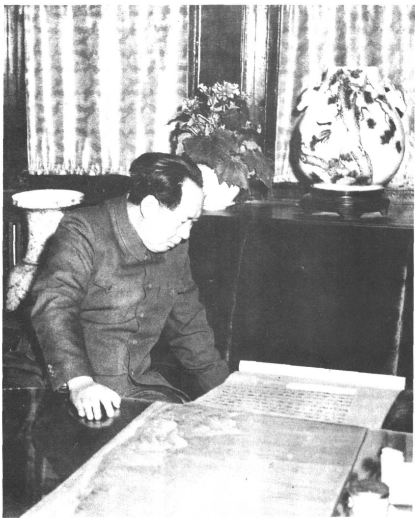
1953年毛泽东观察中国古画