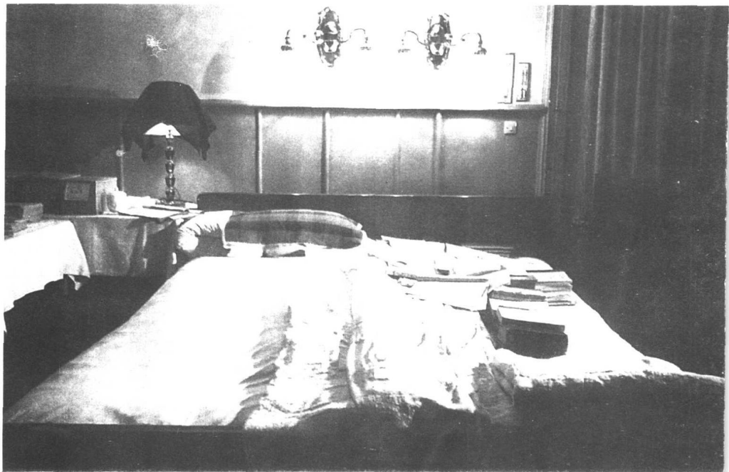
毛泽东在中南海卧室的木床。床上的毛巾被有许多补丁。右边放的书是为了便于随时阅读。