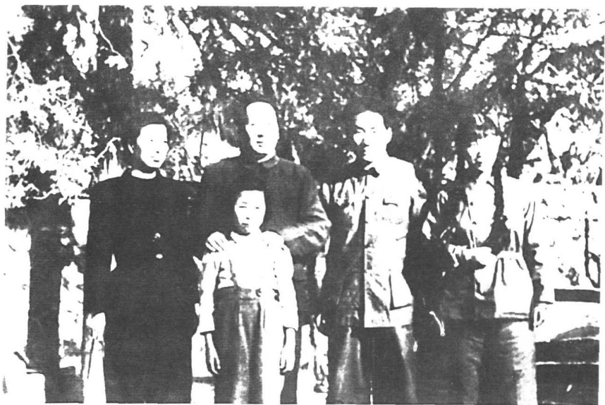
1949年，毛泽东和长子毛岸英（右二）、儿媳刘松林（右一）、女儿李讷在北平香山