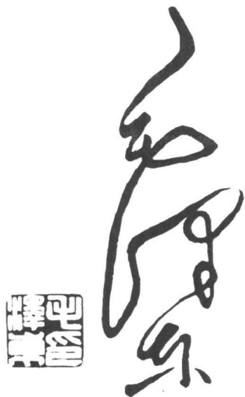
堪称双绝的毛泽东签名和印章