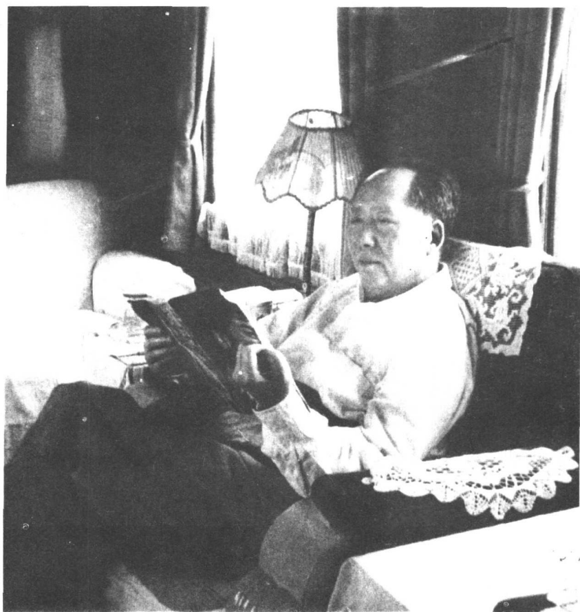
1962年毛泽东在火车上看书