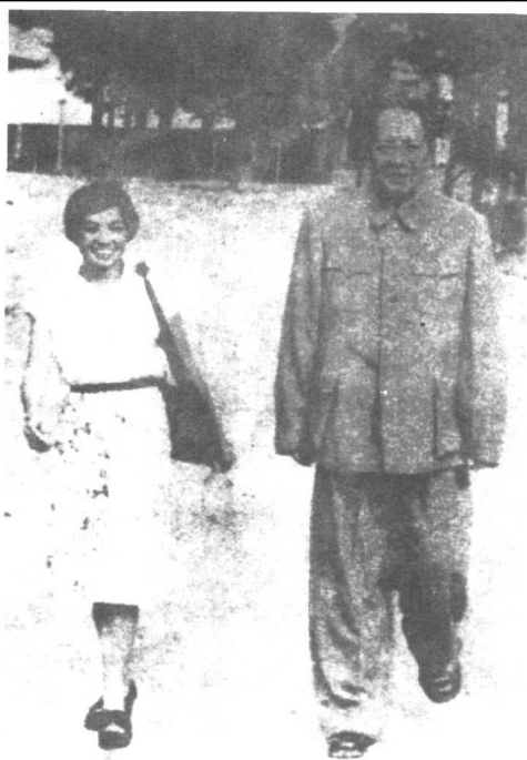
毛泽东和他的护士长吴旭君的合影。