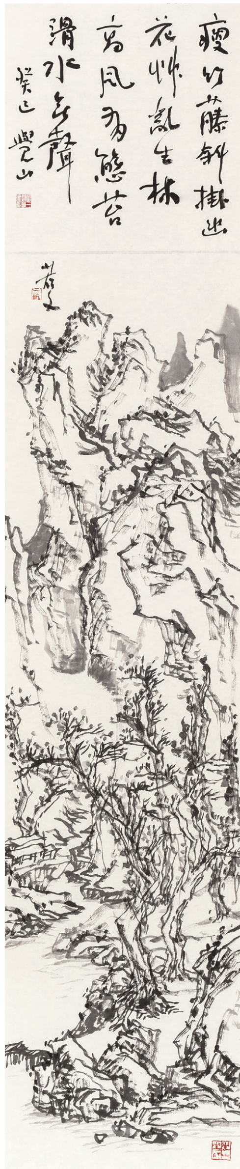
觉山之一 170cm×34cm 2013年

三凯是地道的以书入画的山水画家，书法中所谓魄书、气象、笔法、点画、意态、精神、兴趣、骨法、结构和血肉等等审美判断，都成为他理解传统山水画精妙之处的一