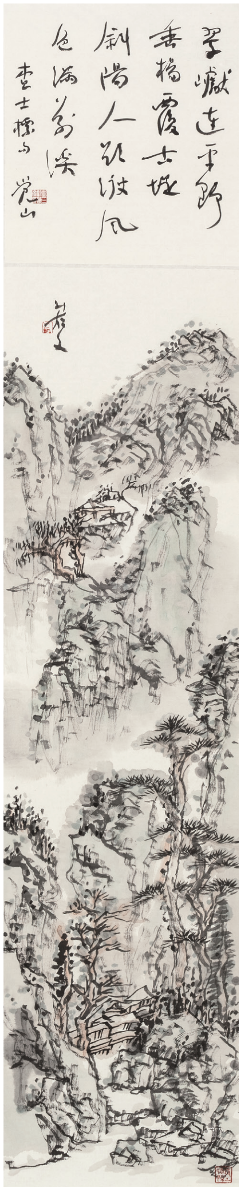
觉山之三 170cm×34cm 2013年

把把钥匙，他也很自然地把自己对魏楷审美书趣的追求转换到山水的用笔中，他的山水画由此而显得高古、雅正、率真和飘逸，虽寥寥数笔，却意境高远、率真自然。他完全用自己的书法素养即笔墨意趣传达了这样一种境界，其高妙之处颇得石溪、八大、青藤的遗风和气象。以三凯的年龄观其作，不由你不感叹他过人的天资和画面传达出的雏声老境。他的山水不仅有笔有墨，而且是涵养丰厚、浸透着浓郁书卷气的笔墨。这，正是传统笔墨山水的一种境界和魅力。