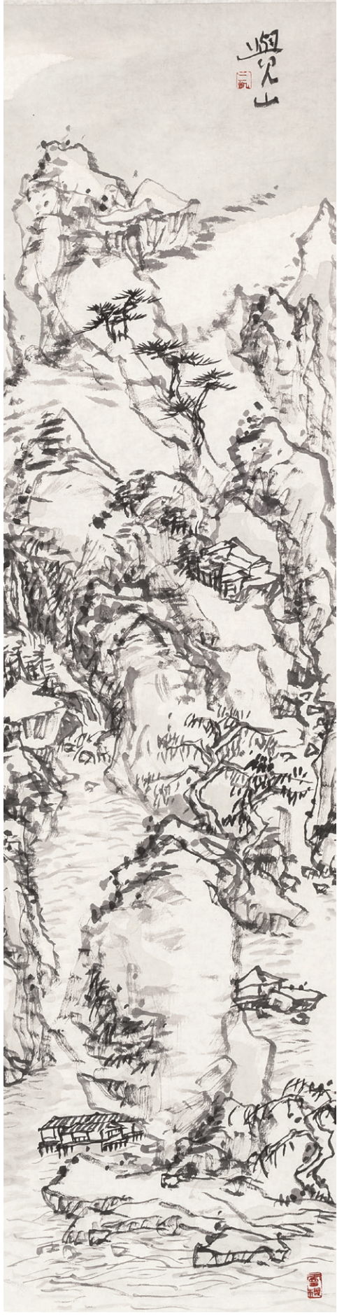
觉山之十 170cm X 34cm 2013年