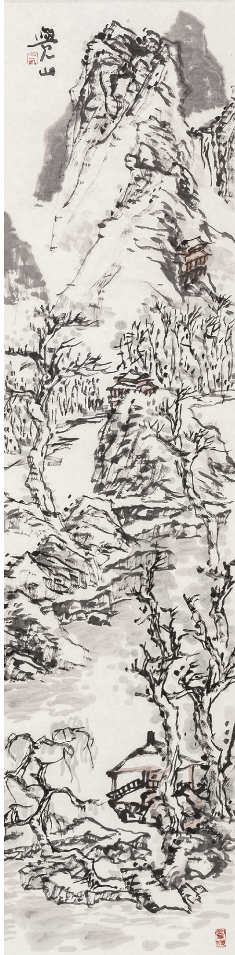
灤山之六 170cm×34cm 2013年