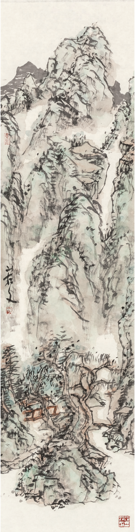
觉山之五 170cm×34cm 2013年