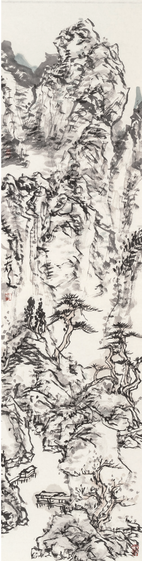
觉山之九 170cm X 34cm 2013年