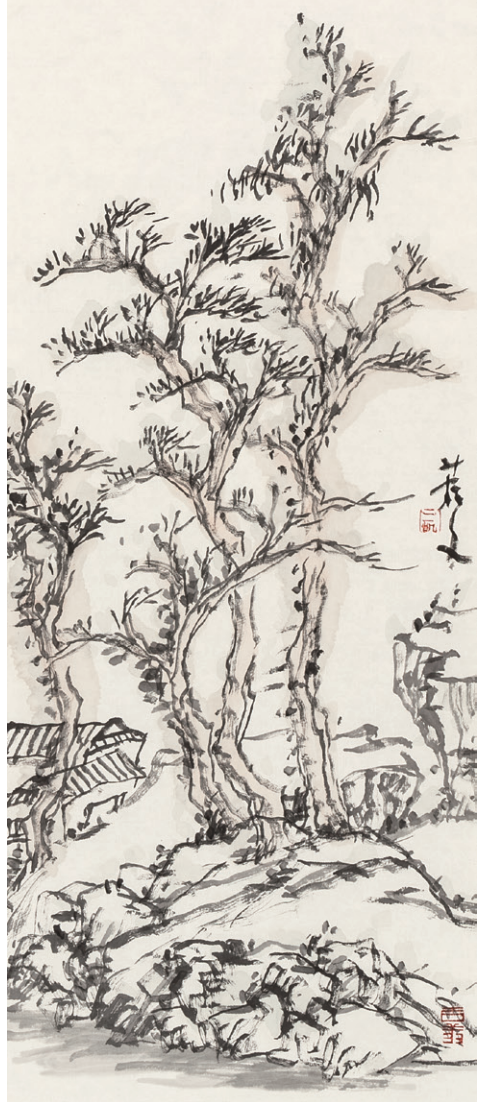
觉山之十一 170cm×34cm 2013年