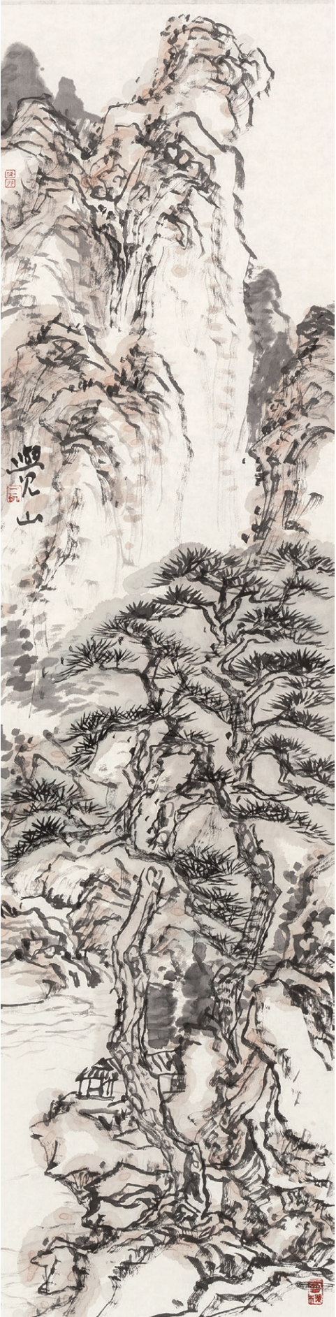
觉山之七 170cm×34cm 2013年