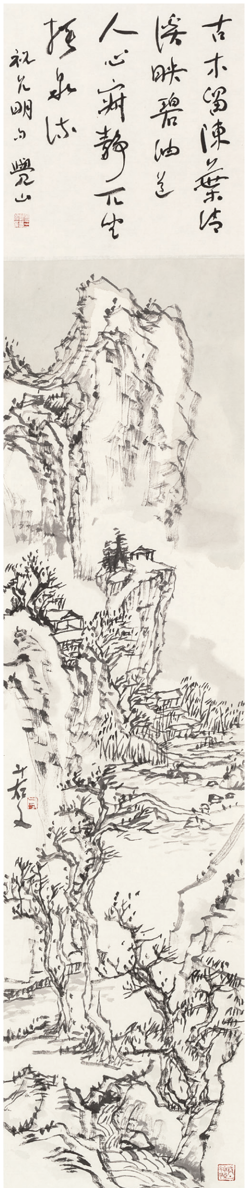
觉山之一 170cm×34cm 2013年

当山水画逐步被“当代性”推演的时候，传统离它也越来越远了。在某种意义上，当代画家已不缺乏对当代审美方式和价值判断的把握，问题反倒在怎样于“当代性”的位置上接近和本土文化之源的关系。特别是走进当代之后怎么使山水画不被他者所同化。“从传统迈向现代”，更多的是对年长者路径的企望，而对于七八十年代后出生