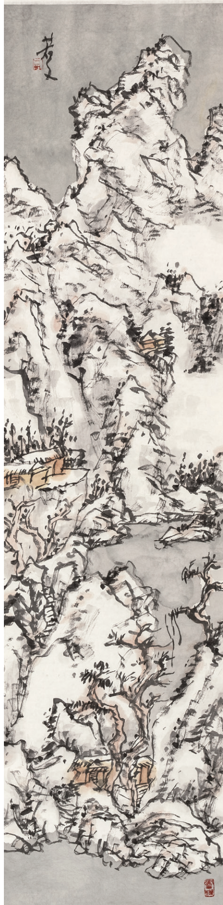
觉山之十一 170cm X 34cm 2013年

雪漫江山系木中 一窗蒨色夜霞诗 翁何人醉醒梅花 月踏过空山路 手 觉山 2013