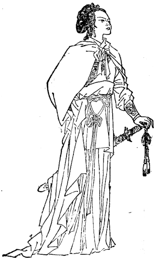
邓 威 娘