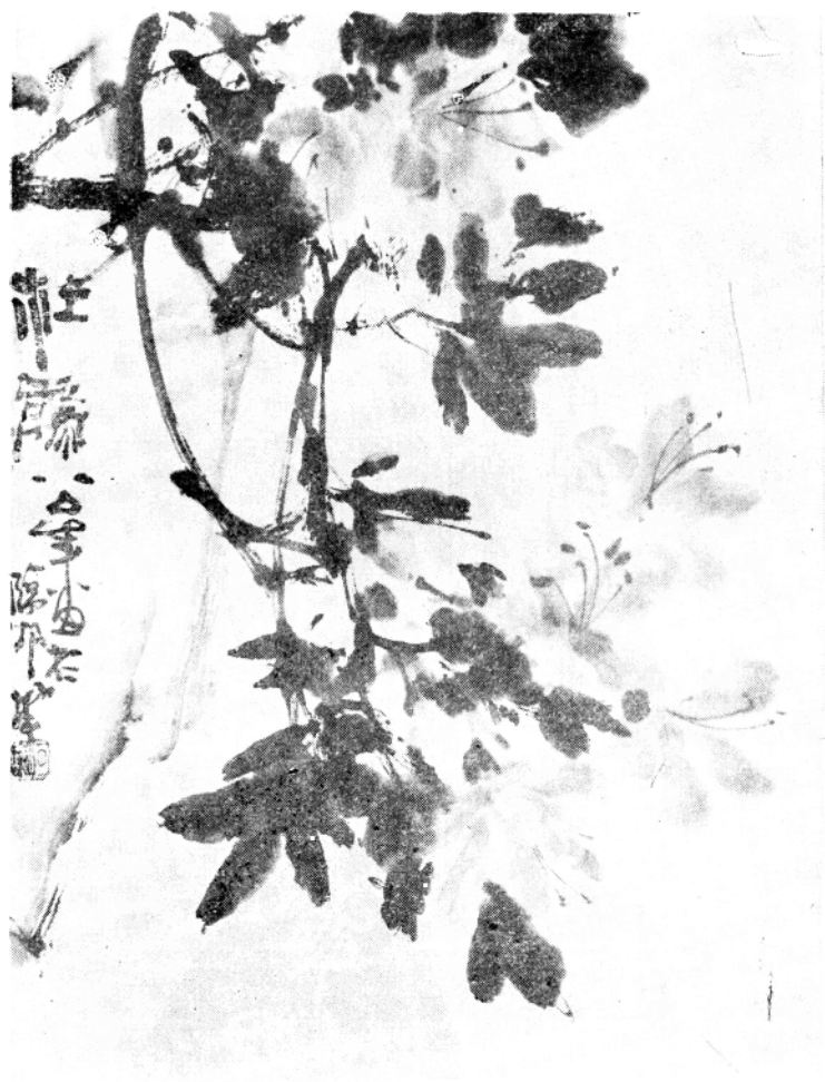
杜 鹃 花