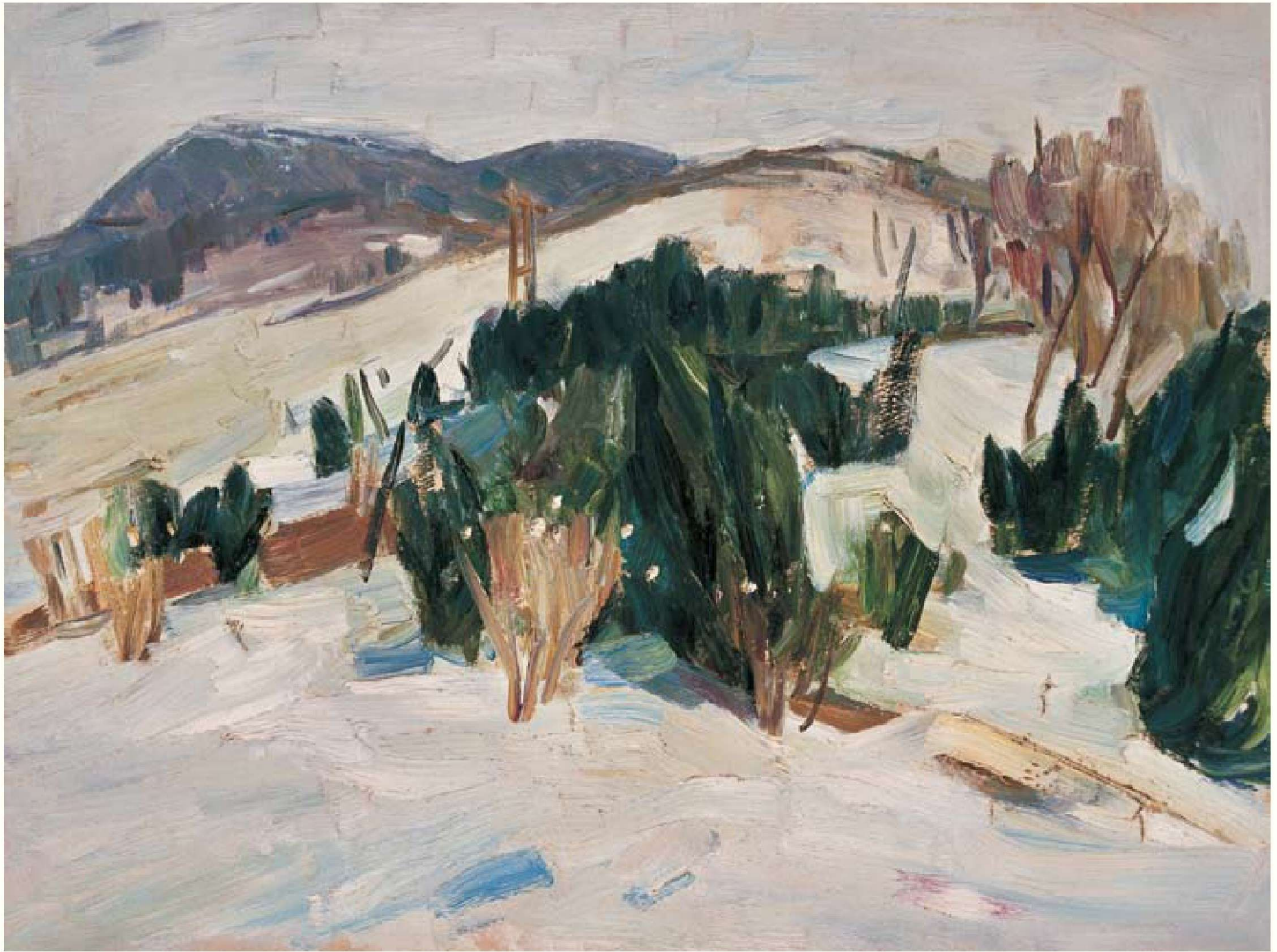
宝石山后的雪 纸板油画 39cm × 52cm 1963年