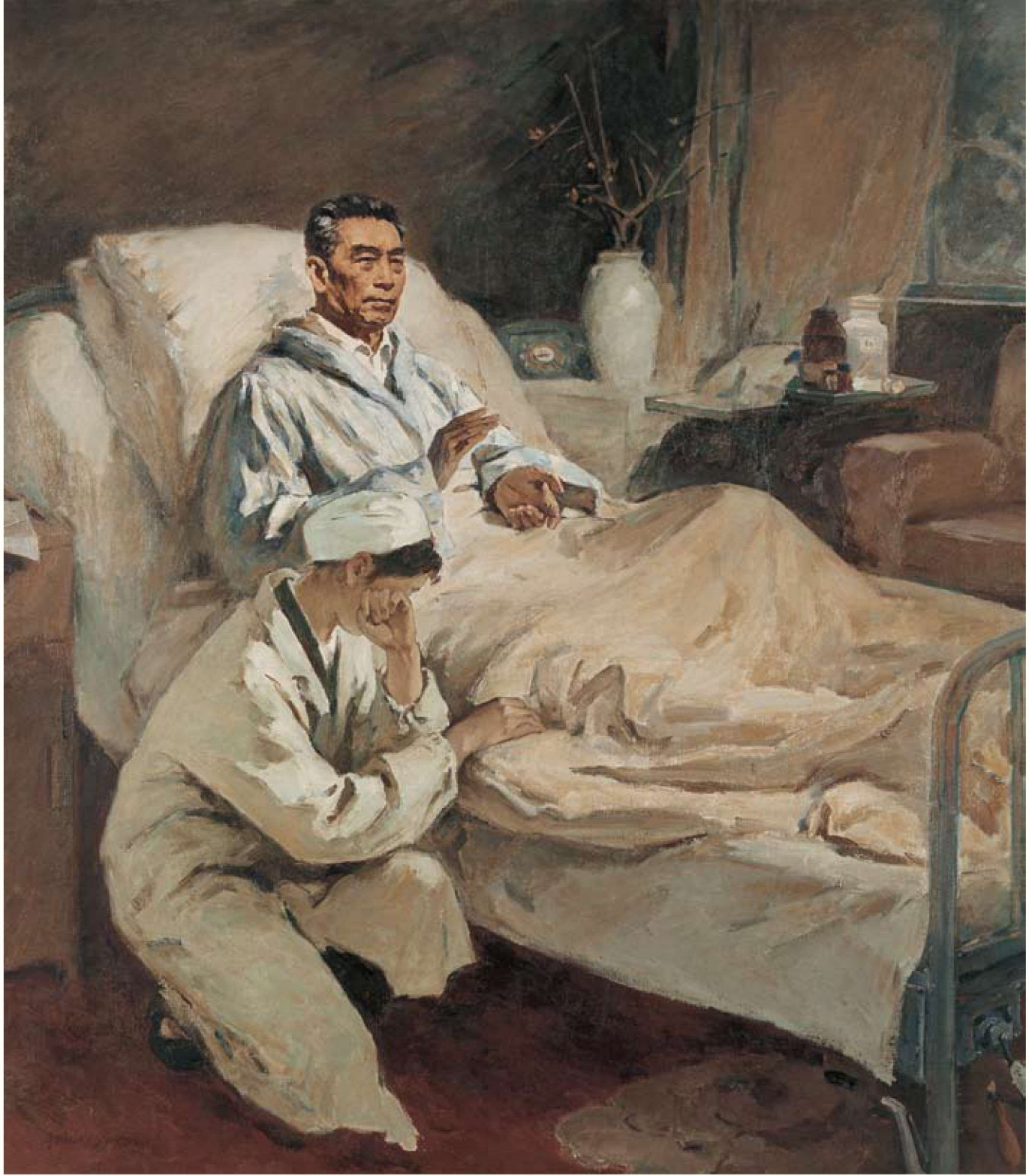
国际歌 布面油画 150cm × 130cm 1979年