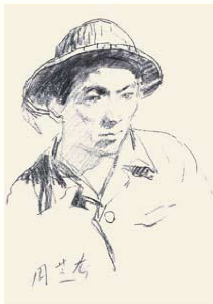
建筑工人 纸 碳笔 39cm × 27cm

“在汪诚一的作品中，我不仅看到了现代主义的风格，也看到了他对现代主义深入的研究和思考，这对当代中国美术是十分重要的。汪诚一的艺术，以早期现代主义绘画精髓为基础，吸收了中国文人画的元素，形成了现在大写意及半抽象的画风。在这一点上，汪诚一的作品具有很明显的继承性和学术性。”