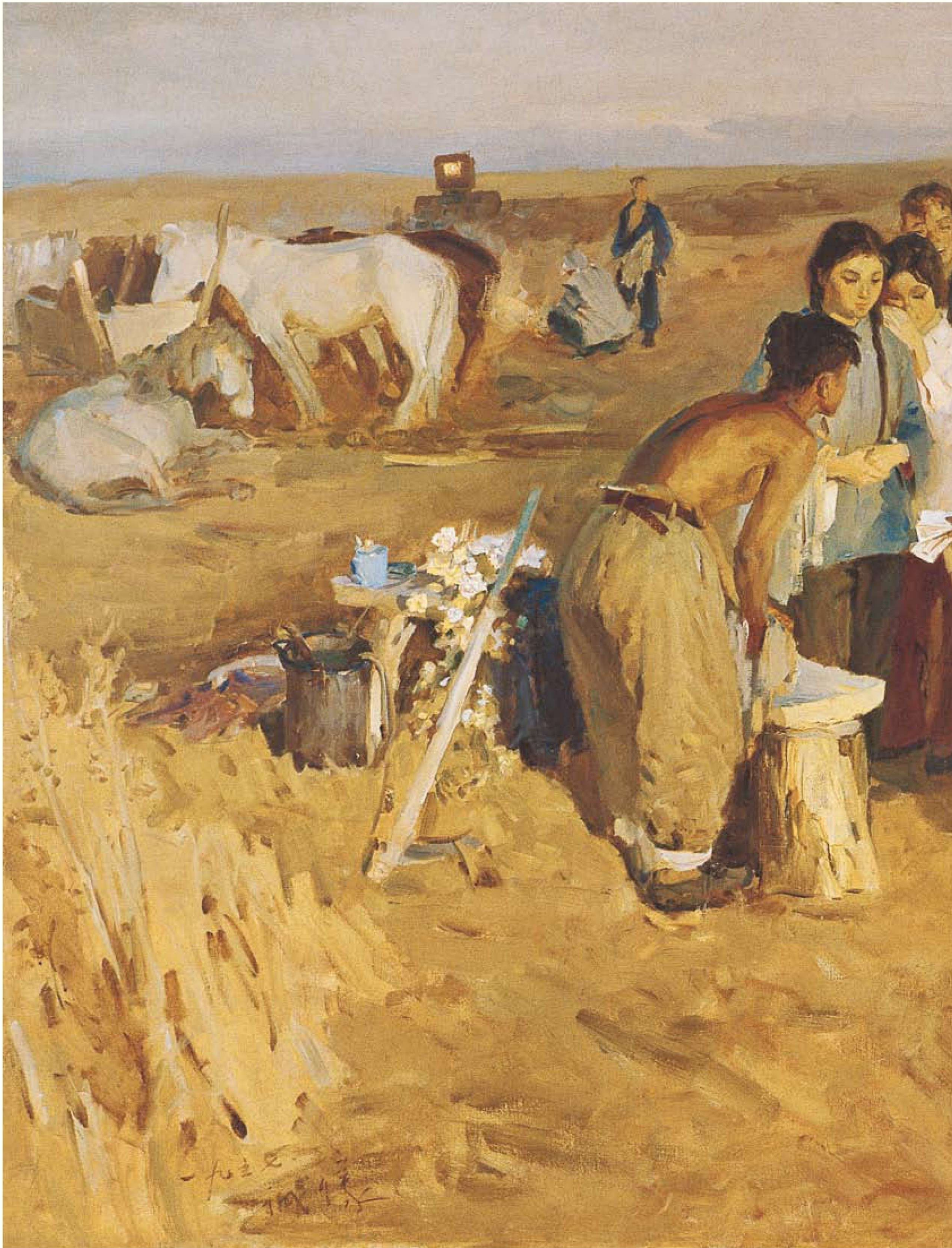
信 布面油画 143cm × 228cm 1957年