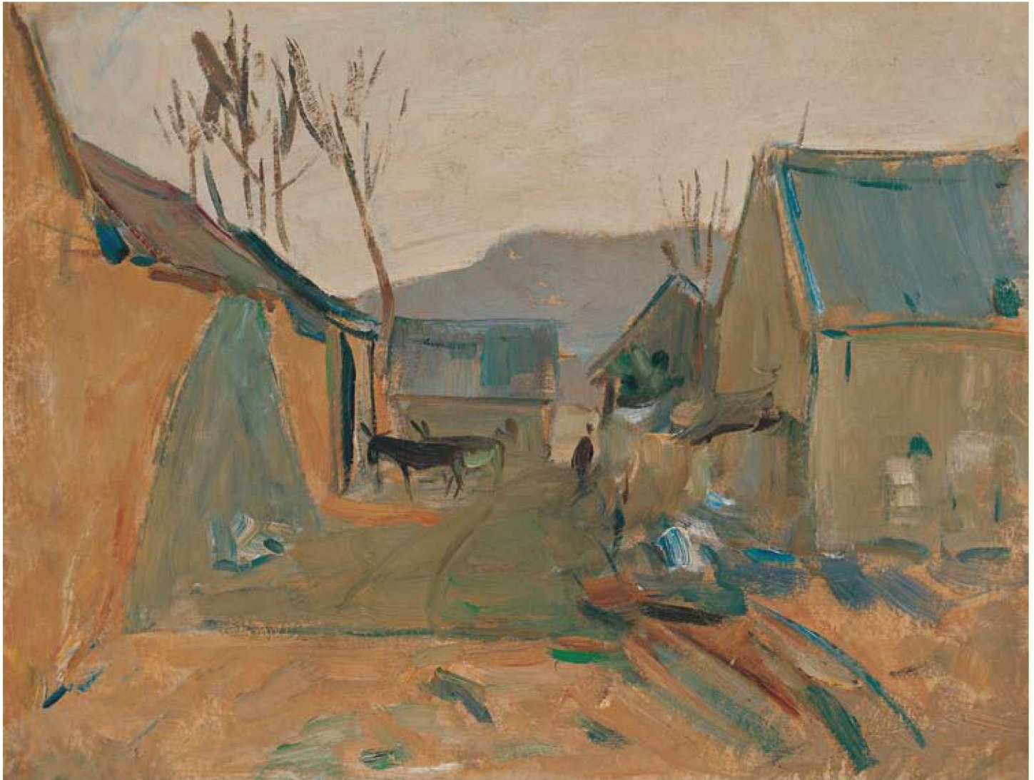
村口的阳光 纸板油画 39cm × 51cm 1962年