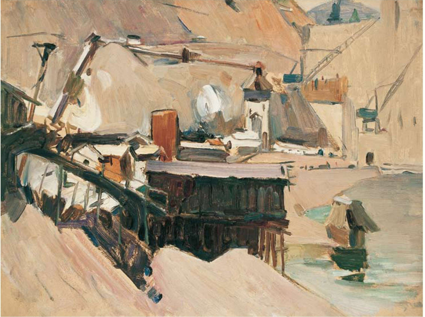
建设中的水电站 纸板油画 39cm × 54cm 1959年