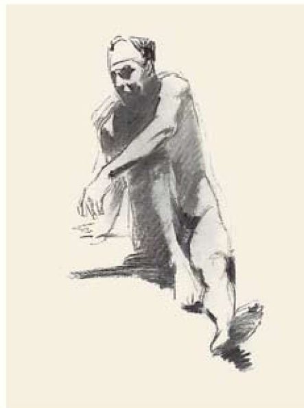
灯光下的男人体 纸 碳笔 36.5cm × 26cm

“遵循汪诚一多年来不断变化的艺术创新之路，我们可以感到有一条十分清晰的逻辑发展轨迹，这就是统领他艺术风格的诗性绘画语言的建构。油画创作之于他已越来越成为一个抒发胸臆、铺陈想象力的过程。他在画面上所营构的和谐的色彩和委婉的笔致，已不仅仅是外部世界中的和谐和委婉，而更是精神和情感层面上的心象的真实。汪诚一的油画作品如一首首意蕴深远的抒情诗，这些抒情诗不是哀婉的慢板，也不是激情的快板，而是如歌的行板，传递出幽雅、恬淡、沉静、隽永的生命节律，如在空中轻轻回旋的歌声，缠绵于画面的物象之中，弥久不散。这是汪诚一用他独特的色彩关系、笔触铺陈、空间结构营建的诗的语言，从中幻化出独具魅力的诗的意蕴，呈现出富有诗歌内涵的审美意境，一个诗的世界。……正如黄宾虹所追求的蕴藉中国文化精神的“江山本如画，内美静中参”中的“内美”；也如康定斯基反复强调的“内在的音响”。这种“内美”和“内在的音响”所透出的具有强烈穿透力的诗意和抒情，构成了汪诚一油画艺术风格的基调。在不同时期他的图式发生着变化，但这种基调不仅始终如一没有变化而且越来越得到强烈的彰显。”