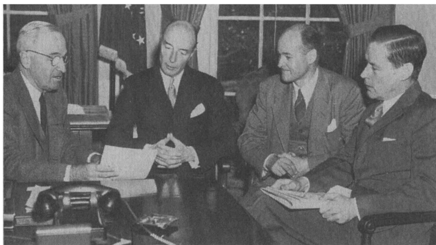
杜鲁门总统在白宫与（从左至右）副国务卿罗伯特·洛维特、外交政策顾问乔治·F. 凯南和查尔斯·E. 波伦商谈。