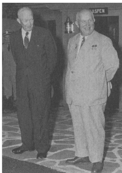
1959年9月25日，艾森豪威尔和赫鲁晓夫在马里兰州的戴维营。