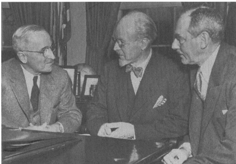
1950年1月23日，杜鲁门总统在白宫会见美国前驻沈阳领事安古斯·沃德（中）和国务卿迪安·艾奇逊。中国人以包括间谍罪名在内的各种指控拘留沃德数月。