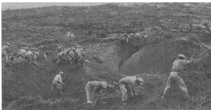
1953年朝鲜停火后，中国军队正拆除位于非军事区的防御工事。

1954年9月，美国国务卿约翰·福斯特·杜勒斯和艾森豪威尔总统在科罗拉多州的丹佛。第一次台海危机是在9月3日发生的。