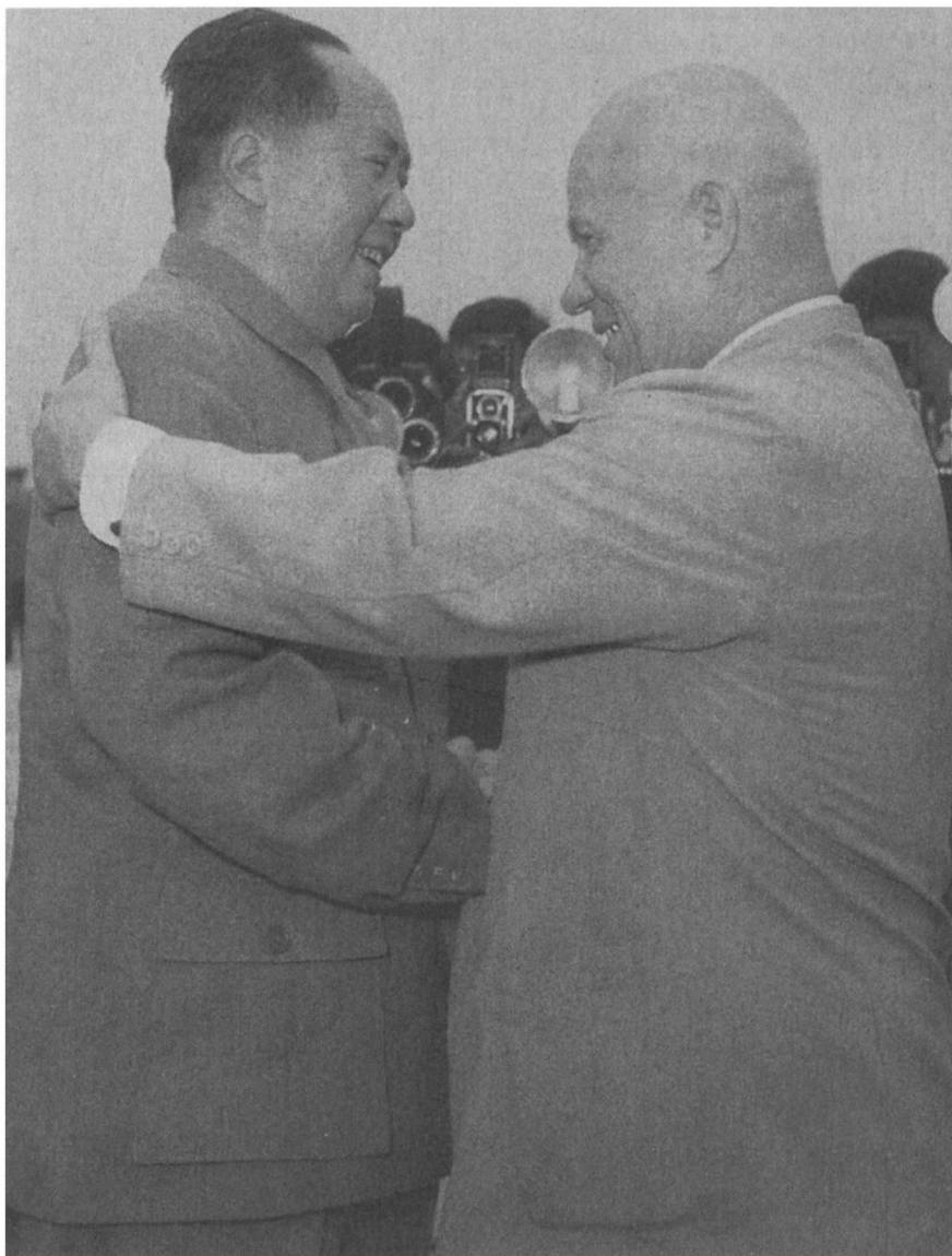
1959年9月30日，毛泽东欢迎赫鲁晓夫到北京。这恐怕是过去30年间最后一次中苏高层首脑会议。