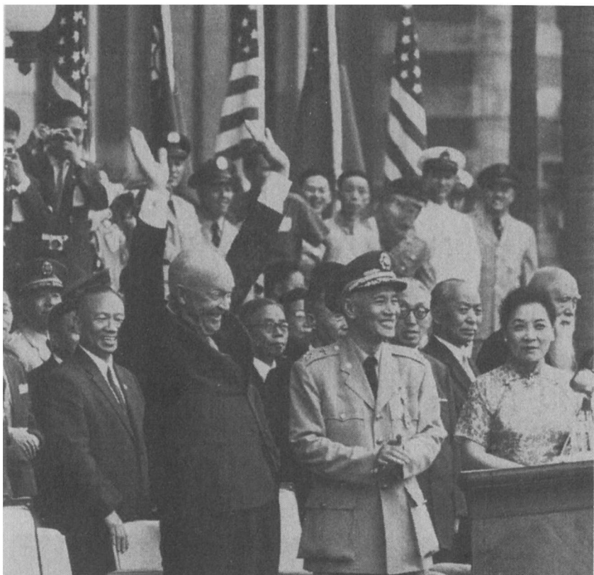
1960年6月，艾森豪威尔总统访问台湾，与蒋介石和宋美龄在一起。