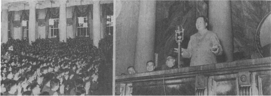
1957年11月17日，毛泽东在莫斯科向中国留学生发表讲话。