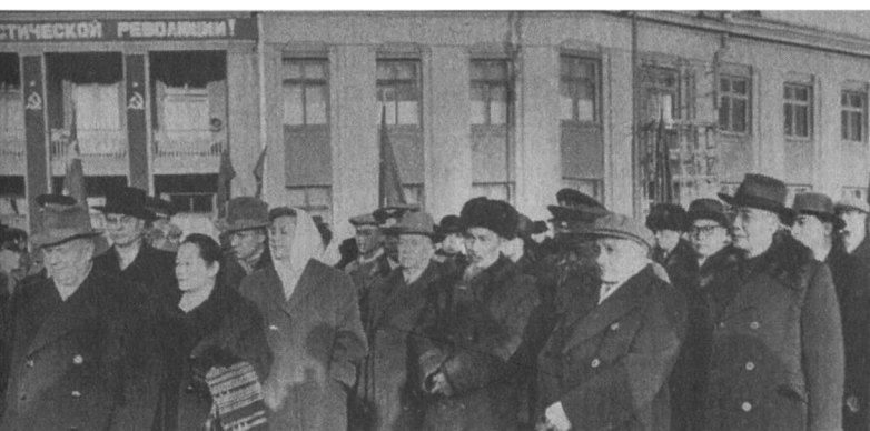
邓小平 胡志明 叶卡捷琳娜·福尔采娃 安德烈·葛罗米柯(?) 宋庆龄 米哈伊尔·苏斯洛夫 尼基塔·赫鲁晓夫