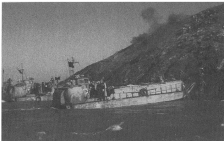
1955年1月18日，中国人民解放军陆军在海军和空军的炮火掩护下于浙江沿海的一江山岛登陆。