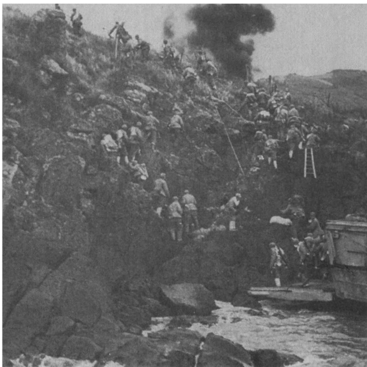
1955年1月18日，中国人民解放军陆军登上一江山岛。