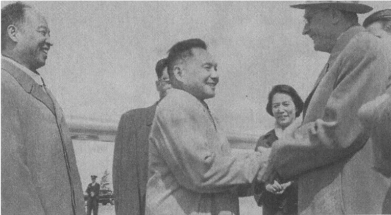
1963年7月5日，当参加中苏两党会谈的中国代表团抵达莫斯科机场时，苏联党的领导人米哈伊尔·苏斯洛夫迎接邓小平。左边是彭真。