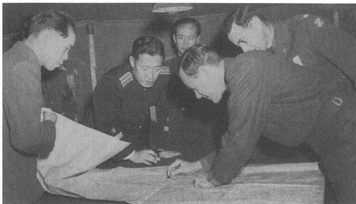
1951年11月，中国、朝鲜和美国的谈判人员正在讨论一个停火线的位置。