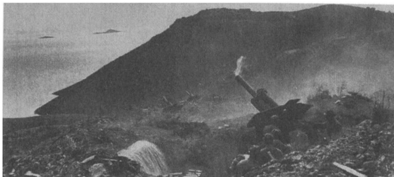
1955年1月18日，从中国大陆炮击一江山岛。