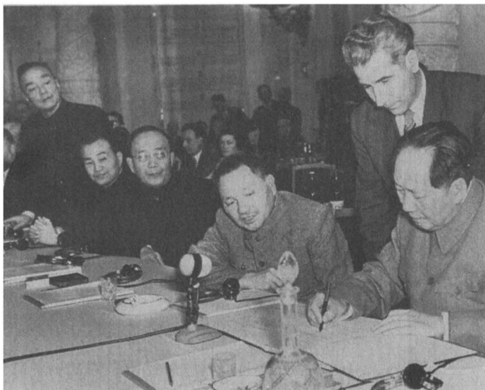
1957年11月14—16日，毛泽东正在《社会主义国家共产党和工人党代表会议宣言》上签字。坐在毛泽东右边的是邓小平和郭沫若。站在最左边的是杨尚昆。