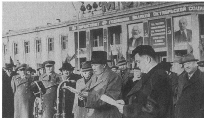
安纳斯塔斯·米高扬