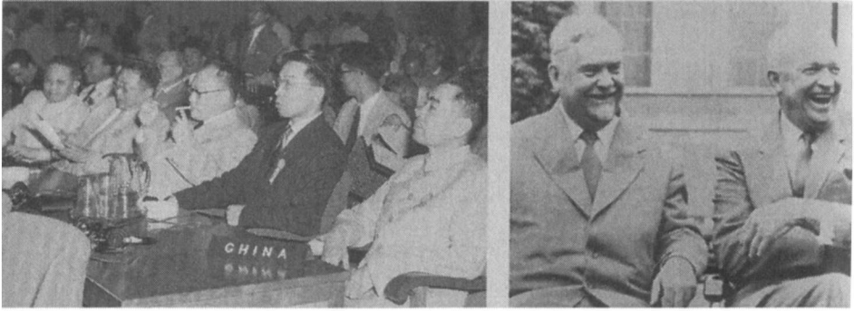
左边：1955年，周恩来（最右边）和中国代表团出席万隆会议。 右边：1955年7月，苏联总理尼古拉·布尔加宁与艾森豪威尔总统在日内瓦。