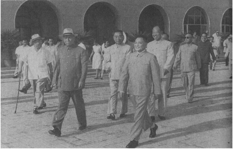
1963年7月5日，在北京机场欢送中国代表团赴苏联参加于莫斯科举办的中苏两党会谈：（从左至右）朱德（拄手杖）、刘少奇、周恩来、邓小平、彭真和陈伯达（戴着墨镜）。