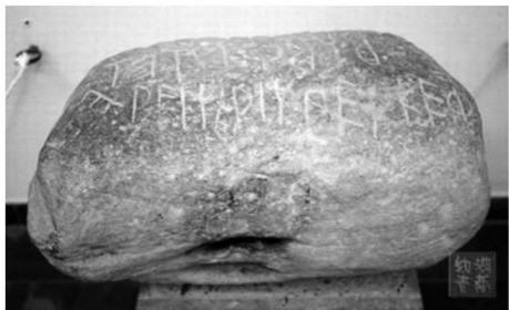
▲ 古奥运举重用的石头

尽管神话传说各有异同,但有一点是一致的,那就是古奥运会与神有关。虔诚的古希腊人民为了让诸神高兴,在耕种、航海、战斗等活动中帮助自己,就举办了名目繁多的祭神仪式,希望藉此博得众神的欢喜,将竞技作为一种祭品献于诸神。于是,古希