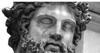
▲ 传说中的宙斯头像

因推翻父亲的统治而当权的天神克罗诺斯,预知自己将来的子女会夺取他的王位,便相继把自己的五个孩子在他们出生时就生吞进了肚子。但当第六胎宙斯降生时,母亲提坦女神瑞亚把他藏到了克里特岛的伊达山洞里,由两个仙女养育。后来长大成人的宙斯在祖母地神盖娅的帮助下,迫使父亲吐出了自己的五个兄姐,并与他们在奥林匹斯山上筑起了坚固的堡垒,与其父和提坦族巨神们对抗。经过四年鏖战,他们最后打败了克罗诺斯和提坦巨神,宙斯也被公推为万神之尊。为了庆祝这一胜利,宙斯下令在奥林匹亚举办竞技运动会。