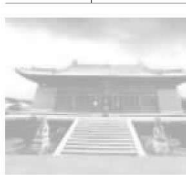
一、广武地理位置与得名

广武因地处雁门关外,依勾注山险,雄踞内长城之北,辖控18处险要隘口,历史上曾是赵战楼烦、汉逐匈奴、唐御突厥、宋抗辽金、明击瓦剌等战争屯兵重地。也曾是匈奴、突厥、回纥、鲜卑、契丹、女真、蒙古等少数民族南进中原必争的军事要地和通道。汉民族和北方少数民族的许多大大小小战事多发生在这里,总计4700余次。历代出名的将领,如赵国良将李牧,驻守雁门数十年,于此处屯兵抗击北狄,现在雁门关内还留有李牧