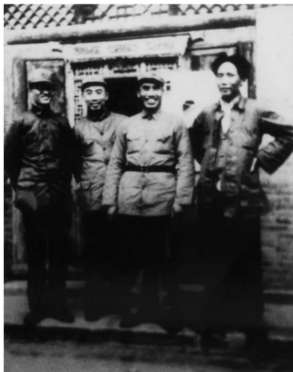
1937年，在延安凤凰山毛泽东的住处（左起：博古、周恩来、朱德、毛泽东）