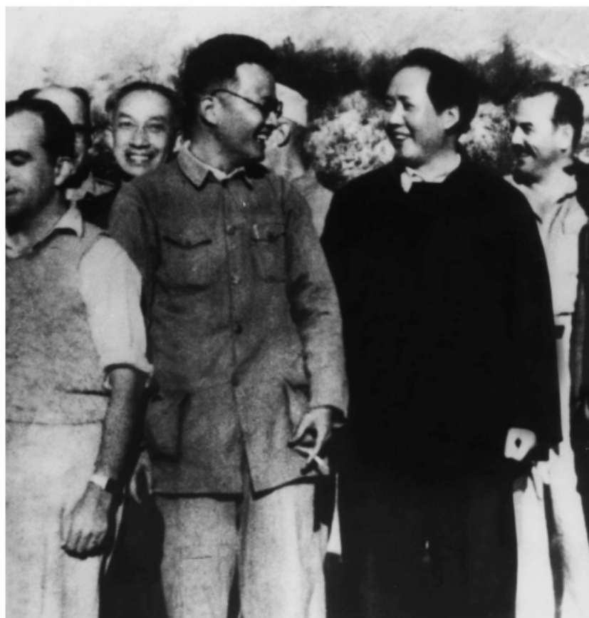
1944年，博古、毛泽东在延安机场欢迎美军观察组