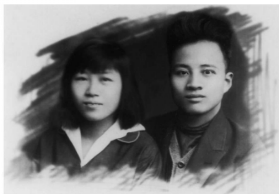
1928年5月，秦邦宪与刘群先在苏联结婚