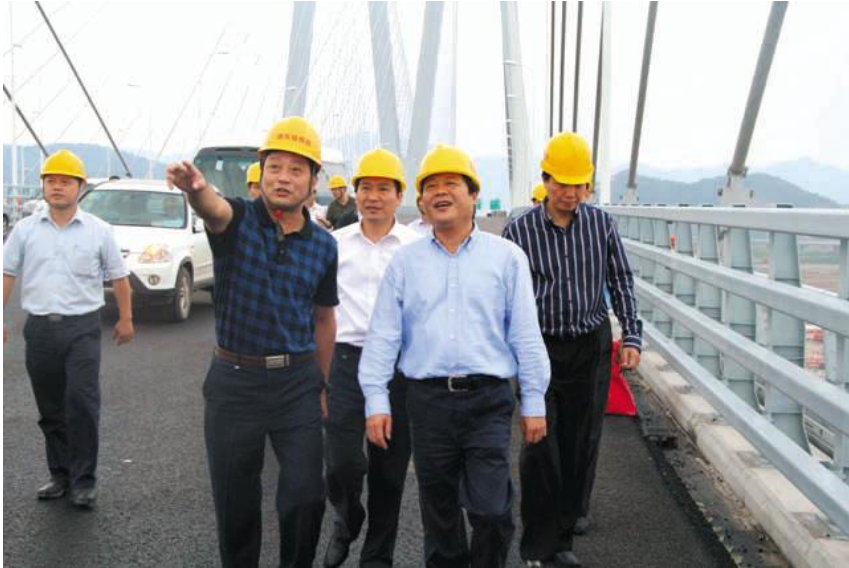
宁波市市委常委、常务副市长王勇在东段工地检查工作。