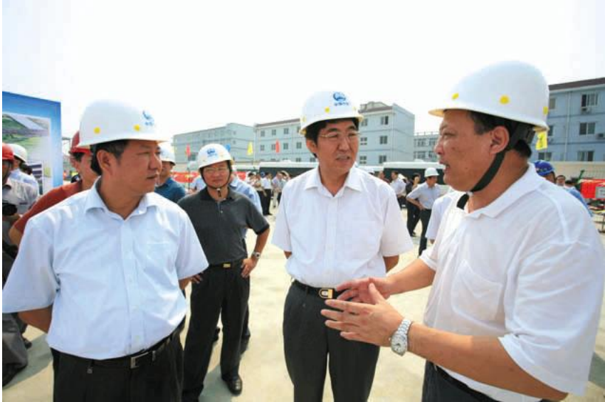
宁波市委原书记巴音朝鲁,市委原副书记、原市长毛光烈在绕城高速公路东段建设现场。