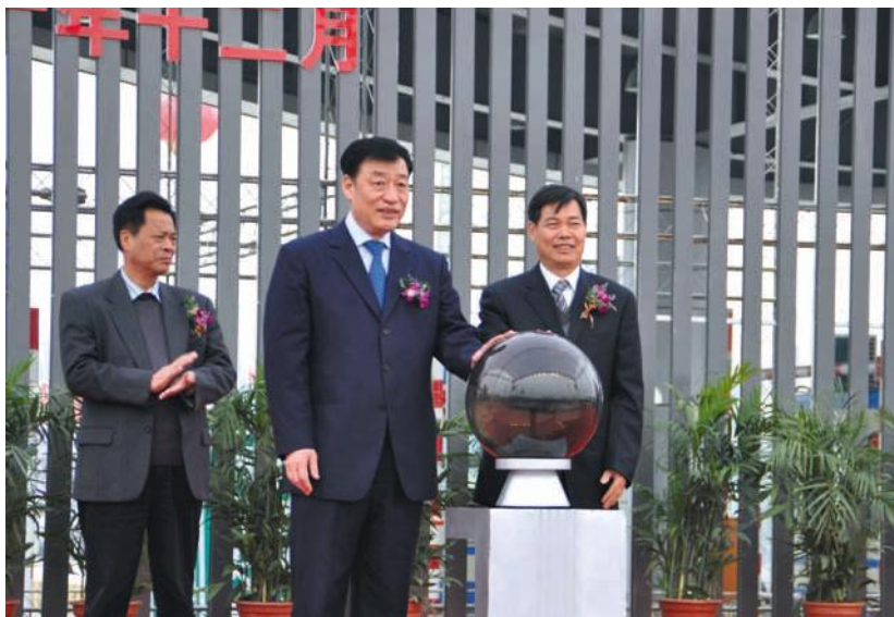
宁波市委副书记、市长刘奇出席宁波绕城高速公路通车典礼。