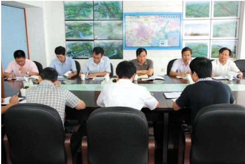
宁波市交通运输委员会主任劳可军听取绕城高速东段工程建设情况汇报。