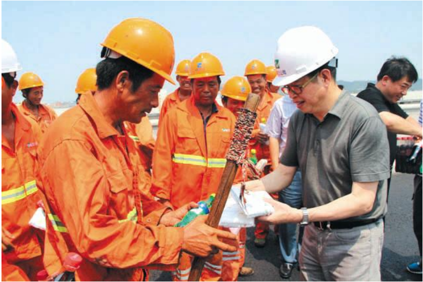
宁波市副市长苏利冕到绕城高速公路建设工地慰问一线工人。