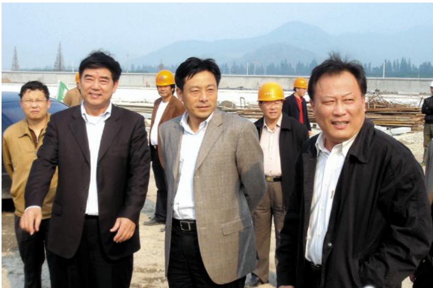
浙江省交通厅厅长郭剑彪在宁波绕城高速公路建设现场。