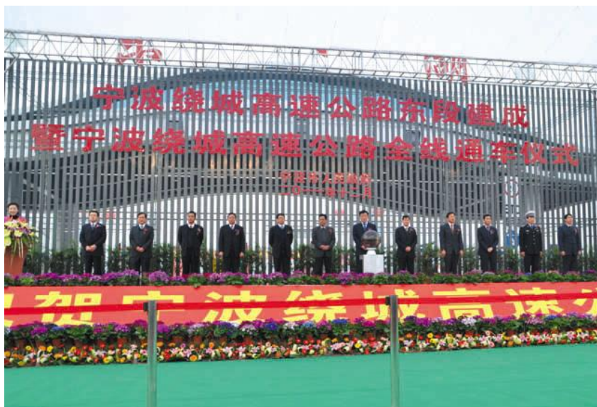
2011年12月27日，东段建成通车，宣告宁波绕城高速公路全面竣工。