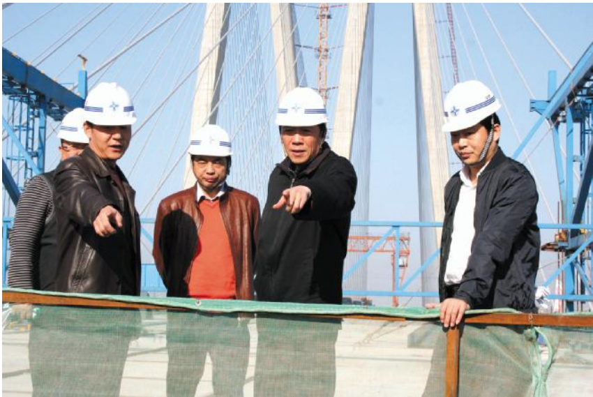
交通运输部总工程师周海涛在第九合同项目施工现场调研工作。