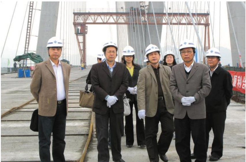
宁波市人大代表团考察甬江特大桥工程。