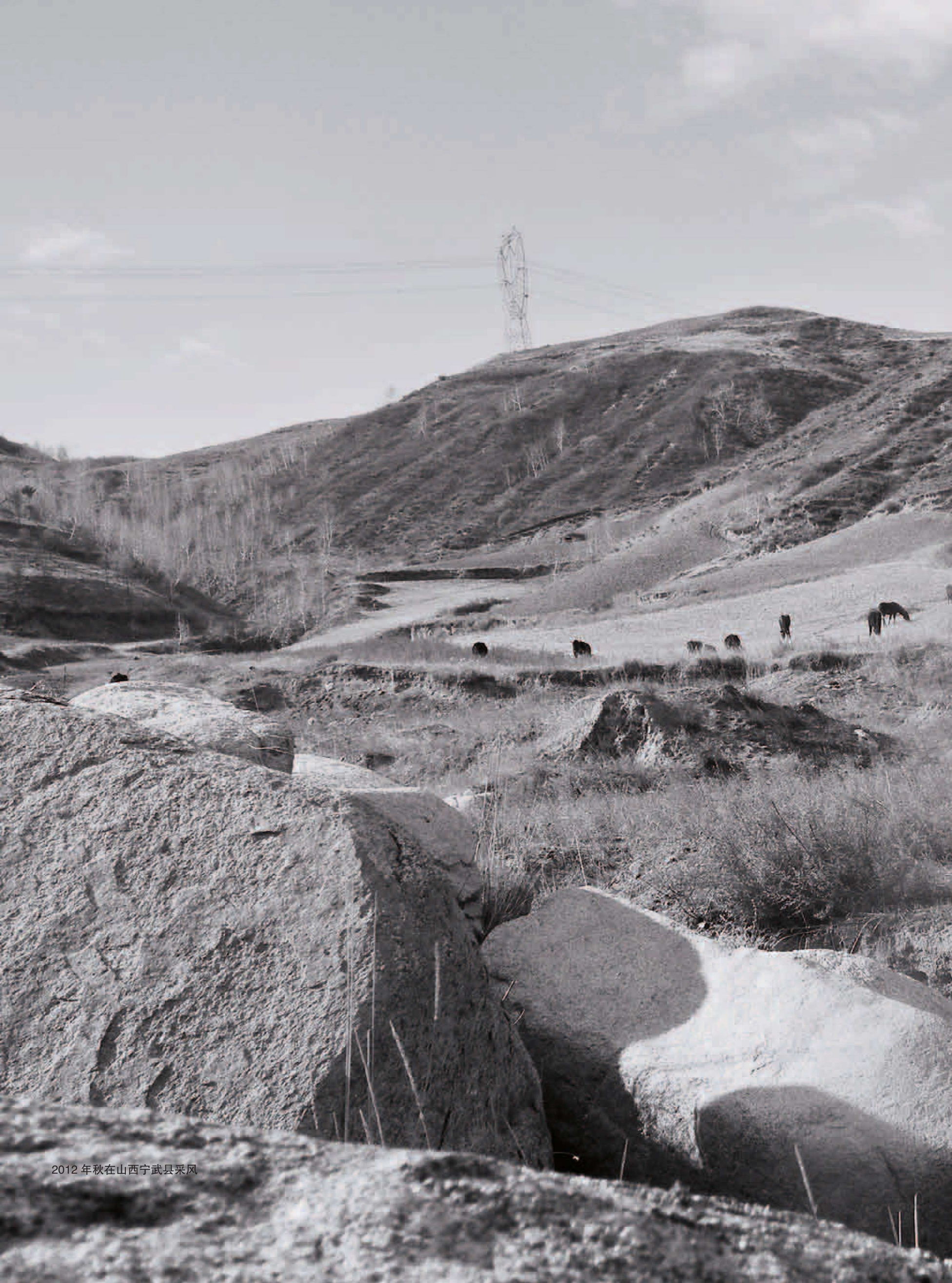
2012 年秋在山西宁武县采风