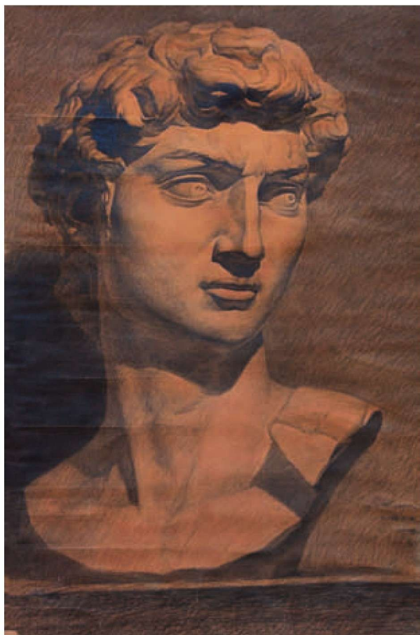
大卫素描 1978年课堂作业

这个时期,首先从文学界涌动的新思潮有意冲垮长期禁锢的精神围栏,以复苏人性的理念对现实进行批判和反思,给整个文学艺术界带来了生机,美术界以罗中立的《父亲》为例,一改几十年红、光、亮的虚假模式,将中国农民艰辛苦涩的真实现状镌刻在一条条深深的皱纹上。还现实以真实,安