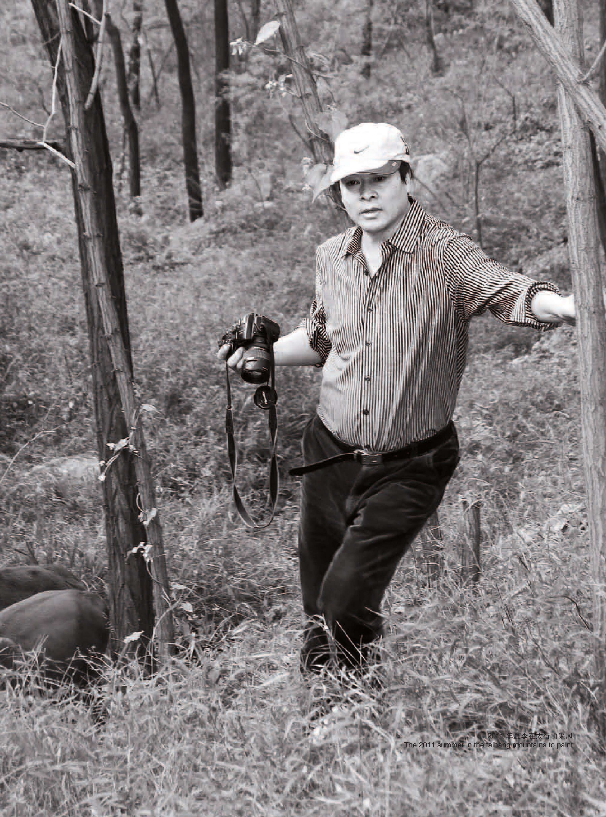
2011年夏季在太行山采风 The 2011 summer in the taihang mountains to paint