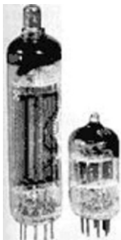
世界移动通信 发展的历程

和接通效率都与今天的移动通信差的太多。不过当时的工程师们都看到了移动通信的潜力,将大量的人力物力投入在移动通信的发展上。