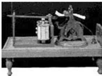
关于无线通信发展的趣事

马可尼发明之路荆棘丛生。他在申请政府赞助落空后，于 1896 年毅然赴英。在那里他得到了科学界和实业界的重视和支持，取得了专利。1897 年，马可尼成立了世界上第一家无线电器材公司——美国马可尼公司。这一年的 5 月 18 日，马可尼进行横跨布里斯托尔海峡的无线电通信获得成功。1898 年，英国举行游艇赛，终点是距海岸 20 英里的海上。《都柏林快报》特聘马可尼用无线电传递消息，游艇一到终点，他便通过无线电波，使岸上的人们立即知道胜负结果，观众为之欣喜若狂。可以说，这是无线电通信的第一次实际应用。