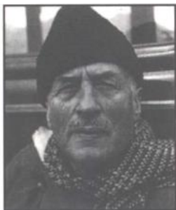
斯文·赫定 (Sven Hedin)

斯文·赫定，一八六五年出生于瑞典首都斯德哥尔摩一个中产阶级家庭，其父为知识分子，终生对斯