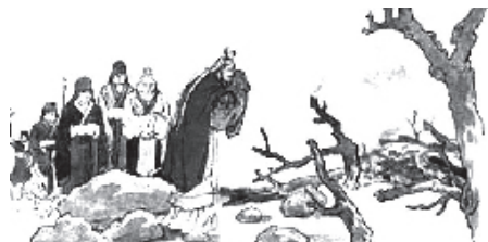
晋文公寻找介子推

介子推是东周时期晋国侍奉太子重耳的一个小臣，在重耳落难奔走他国时，一直跟随着重耳，躲避朝廷的追杀，忍受邻国的驱逐。在落荒而逃的日子里，重耳说了一句几个月没有尝到肉味了，介子推就在自己的臀上割下一块