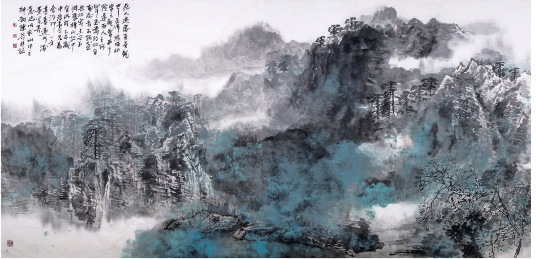
无人迹处有奇观 纸本水墨 130cm × 280cm 2015年