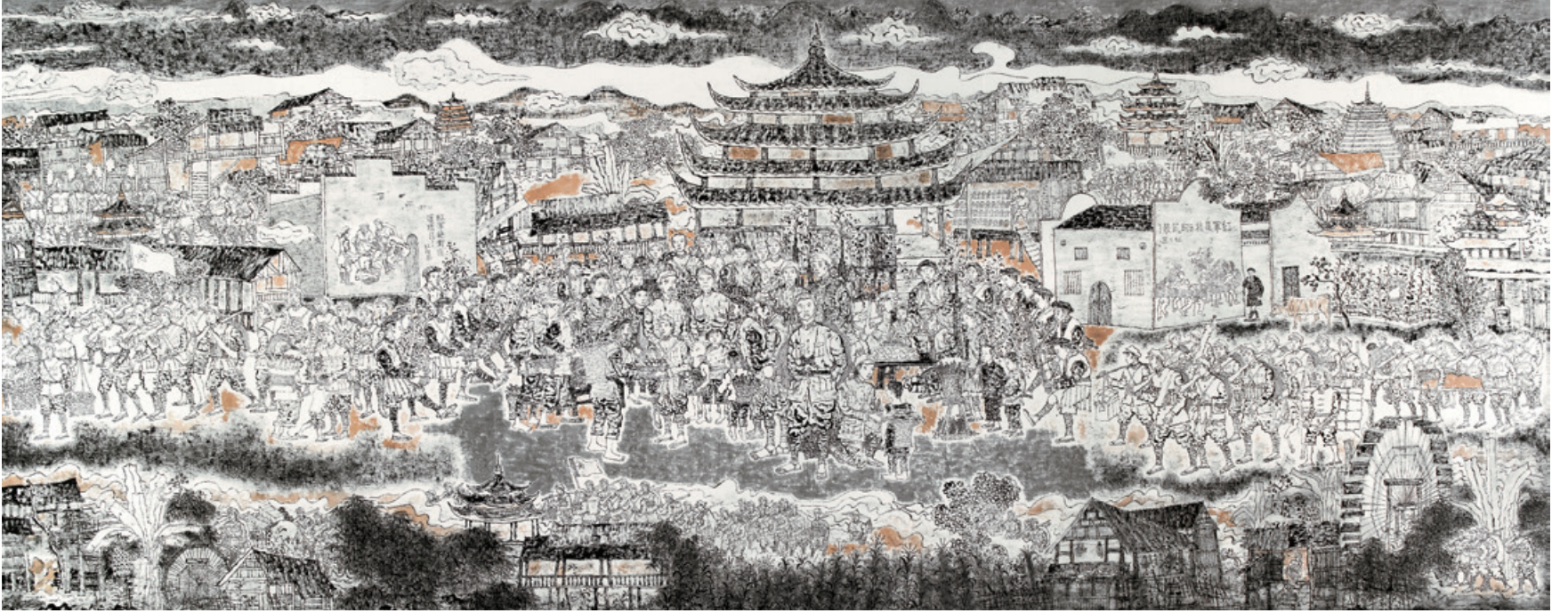
红军长征过广西 纸本水墨 200cm × 480cm 2012年