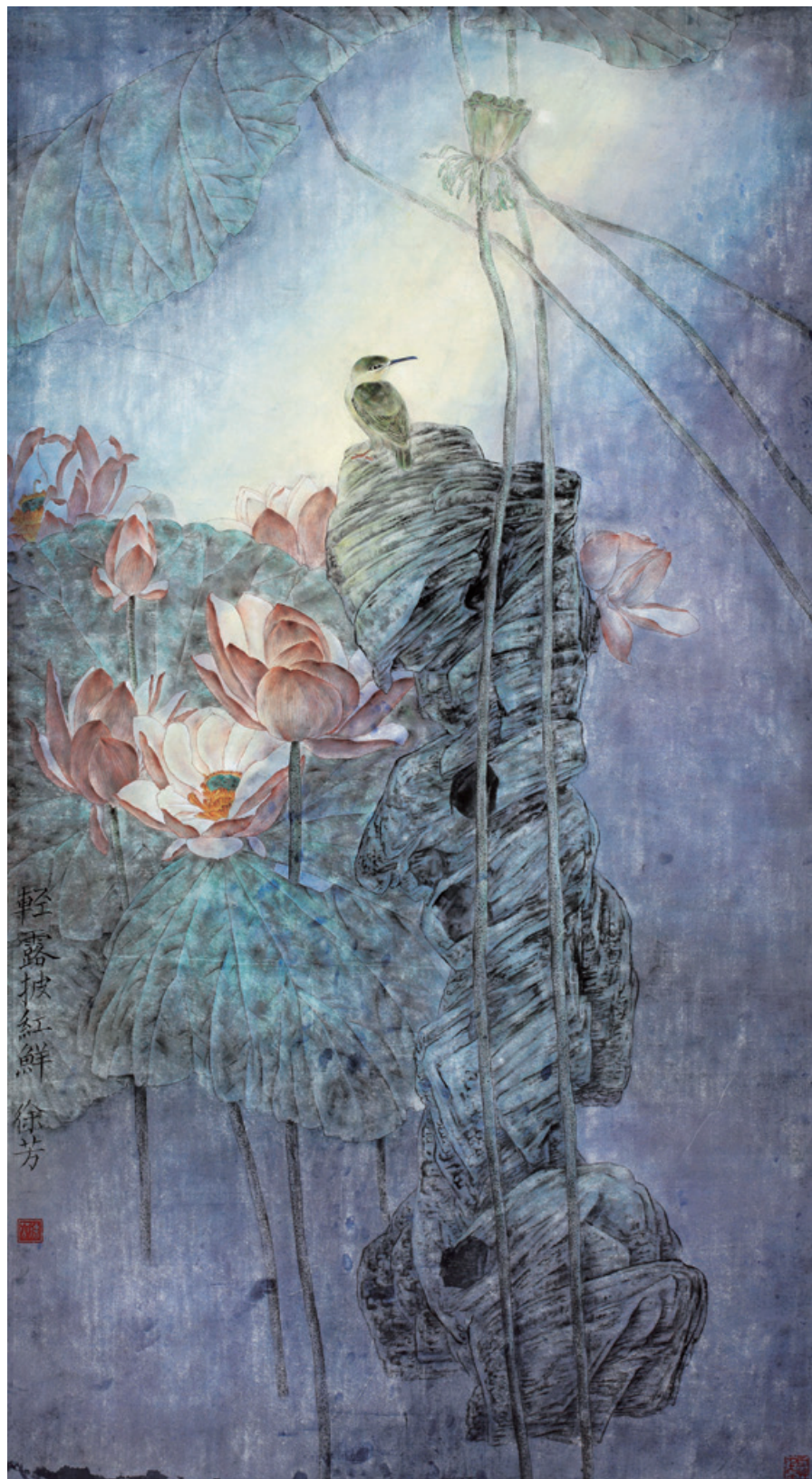
荷 紙本 100cm × 200cm 2014年