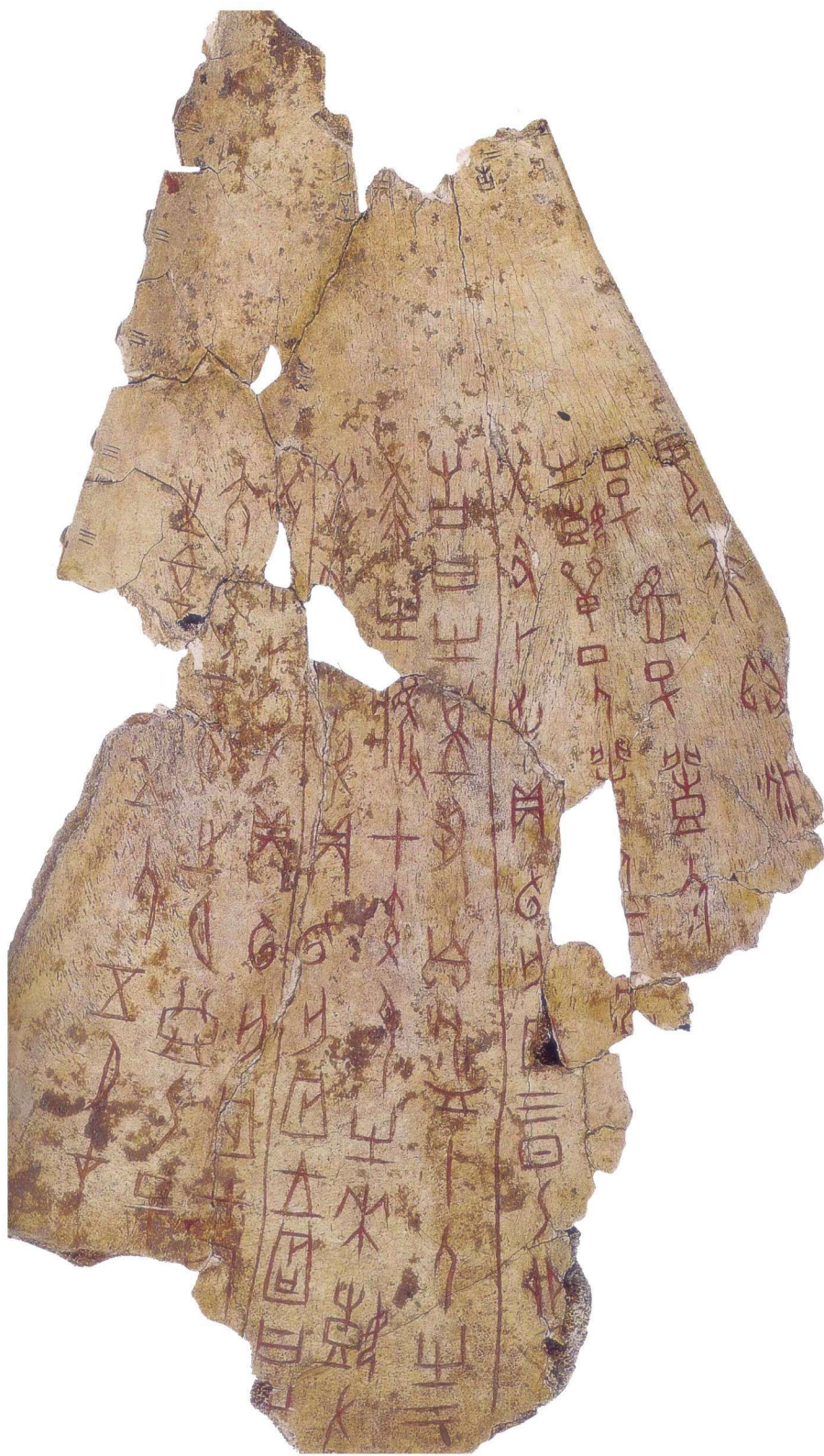
图1-1 武丁时期甲骨文卜辞 国博YO712正面 (释文见6-1-1)