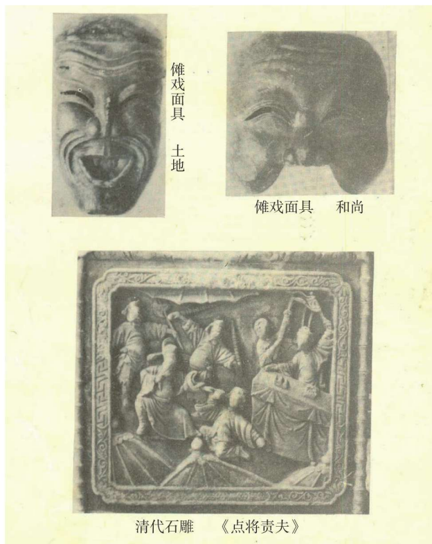
图 1.1 傩戏面具