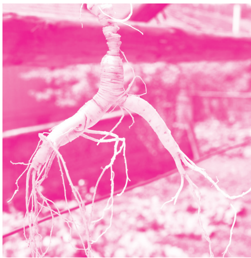
图 1-2 被誉为东北三宝之一的人参

年生、重 287.5 克、长 79.5 厘米的大山参，被誉为“山参之王”，作为国宝存放在北京人民大会堂吉林厅。貂皮，为紫貂的毛皮，呈棕褐色或灰褐色，间有白色针毛，皮质轻柔坚韧，毛绒华美，细致丰厚，柔软轻暖，具有光泽，堪称裘皮之冠，真可谓“东瀛物产富难详，美毳（cuì）尤称貂鼠良”。吉林省也是中国著名的梅花鹿之乡，盛产鹿茸，是一种珍贵的中药材，有生精补髓、滋血助阳、强筋健骨之功效。