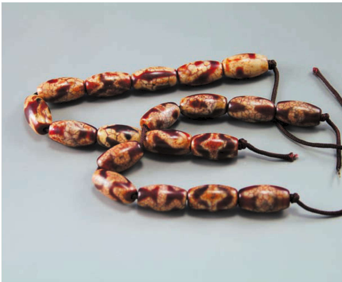
红玉髓梭形小天珠

“天遗瑰宝”。此处，人们不会从“天遗”二字中认为寿山石是“上天之遗石”。显然，被国人称为“天”者，乃暗寓其珍贵、奇特、难觅之义。