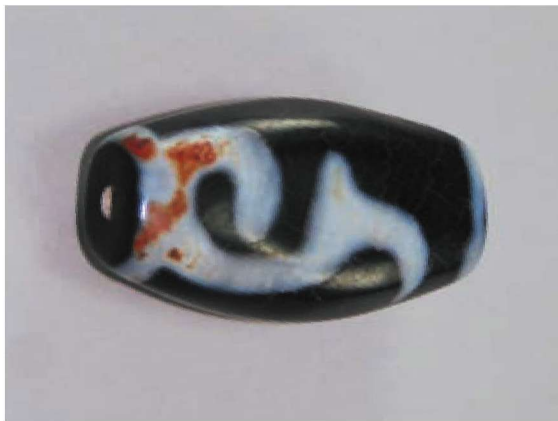
缺乏形神兼备特点之图纹新天珠