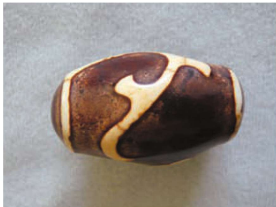
形神兼备之图纹天珠