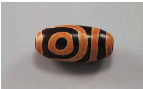
缺乏形神兼备特点之眼纹新天珠