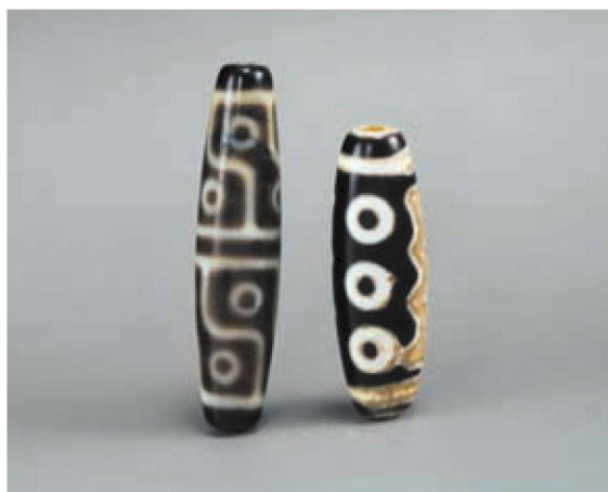
梭形天珠（常见天珠之形）

(以上简称《天珠》)一书中所说“是天上众神赐予人间的财物”，结合其形制如珠之特点，故称“天珠”。