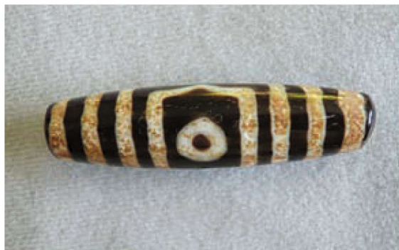
形神兼备之眼纹天珠