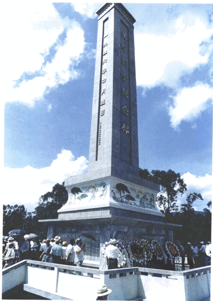
玉溪市革命烈士纪念碑