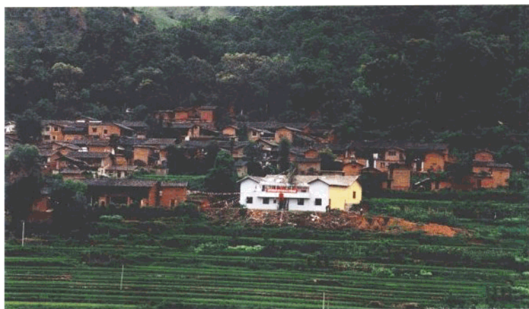
滇中地委冤耻冲办公旧址