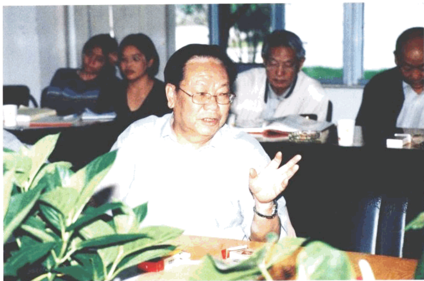
全国人大常委会委员、原中共云南省委书记普朝柱在审稿会上讲话