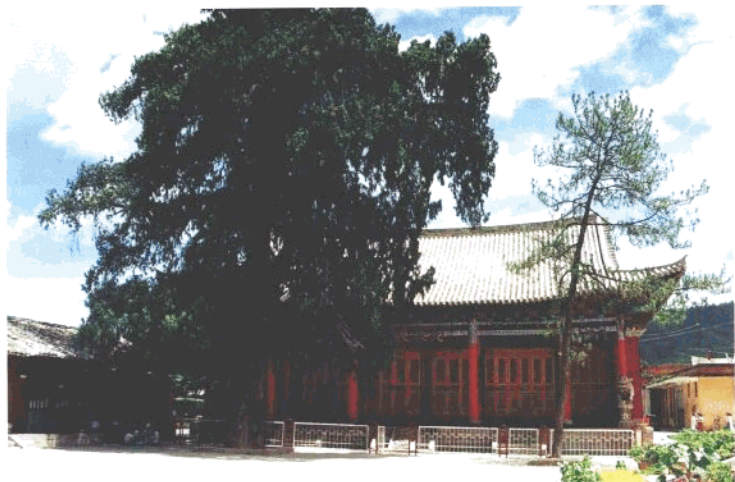
滇中革命摇篮——峨山中学旧址