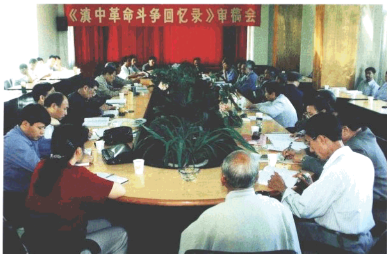
《滇中革命斗争回忆录》（第一辑）审稿会会场