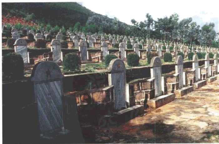
新平县革命烈士陵园