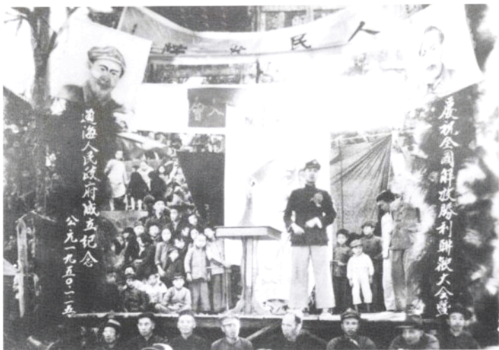
通海县人民政府成立大会会场