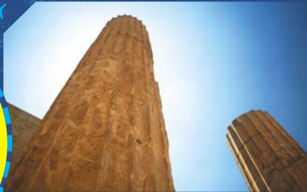
● 雅典卫城神庙立柱

这些闪耀着人类早期智慧光芒的青铜文明被统称为爱琴文明，它们的出现犹如一盏盏明灯，照亮了尚处于石器时代的爱琴海和希腊半岛。