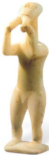
● 吹奏双管笛子的石偶。吹奏者仰首望天，似乎陶醉在迷人的旋律之中。

石器时代在古希腊的土地上缓缓走过了漫长的岁月，到公元前3000年，青铜文明的曙光终于在陆地和海