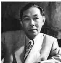
中国著名作家 文学评论家 文化活动家 社会活动家