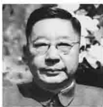
中国著名小说家 文学家 戏剧家

凡是干的、玩的、想的，觉得有意思就记，一句两句也可以，几百个字也可以，不强拉长，也不硬要缩短。