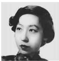
中国著名 现代作家

应当时时刻刻身边有一支铅笔和一本草簿，把你所见所闻所为所感随时记下来……美的文学语言，应当是形象化的、准确和精练的、富有表现力的。