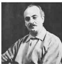
著名诗人、作家、 画家。阿拉伯现代 小说艺术和散文的 主要奠基人

写作果然是一件苦事么？写作不过是发表意见，说话也同样是发表意见，不见得写文章就比说话难。