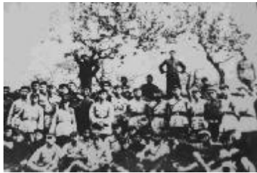
红军长征起点——第一村

随后不久，有些胆大一点的士兵开始在两军阵前做起了生意，他们将私自收藏的枪支、弹药、医药偷偷卖给“走私商人”。一时间，前沿部队弹药消耗量骤增，让粤军后勤部门叫苦不迭。陈济棠、余汉谋连连向南昌“剿总”请求供给弹药物品。