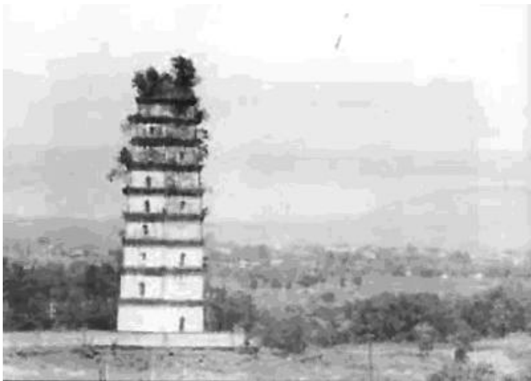
红色苏维埃政府所在地江西省瑞金(1934年)