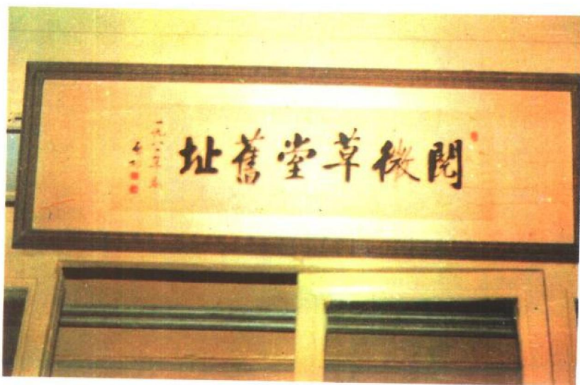
北京纪晓岚阅微草堂旧址匾额,为启功书。