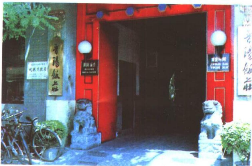
位于北京宣武区珠市口西街 241 号的纪晓岚故居,即阅微草堂旧址,今为晋阳饭庄。