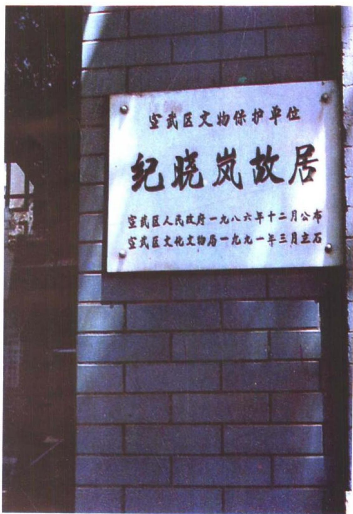
北京纪晓岚故居文物保护单位牌额。