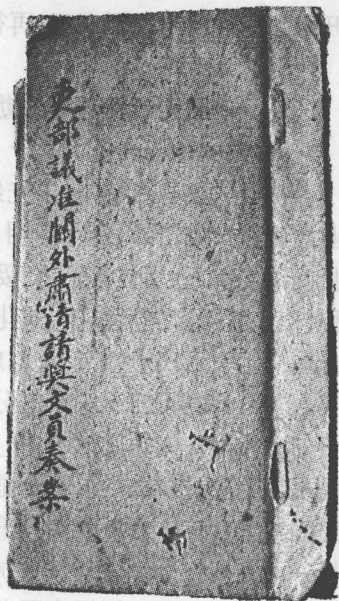
现存于恩施自治州图书馆。

保。惟议定章程，前敌各军，每百人准保武职十员，后路每百人准保武职五员，分别奏咨余只给功牌文职，统营准保四五员，各营三员，各旗二员，后路各营二员，各旗一员，如前敌有稍次生力，后路有异常出力者，酌再增减。各营务处台局均须派委有案，实在出力，始准开保。臣分饬遵办。有稍涉浮滥者驳还删减，必合于定章而后准，是以迟逾半年始定，臣维保举以劝有功也。太刻则有功者失望无示鼓励于将来，而勇夫短气。太滥则无功者奖，无以昭赏罚之公允，而战士寒心。臣无驭兵之才，惟自矢天良。恪遵历次谕旨，严杜冒滥。凡未在事出力者，无论如何请托，皆深闭固拒，未敢