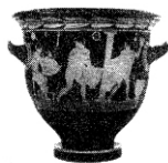
图一 陶瓶上的绘画反映了雅典制陶工场上的场景