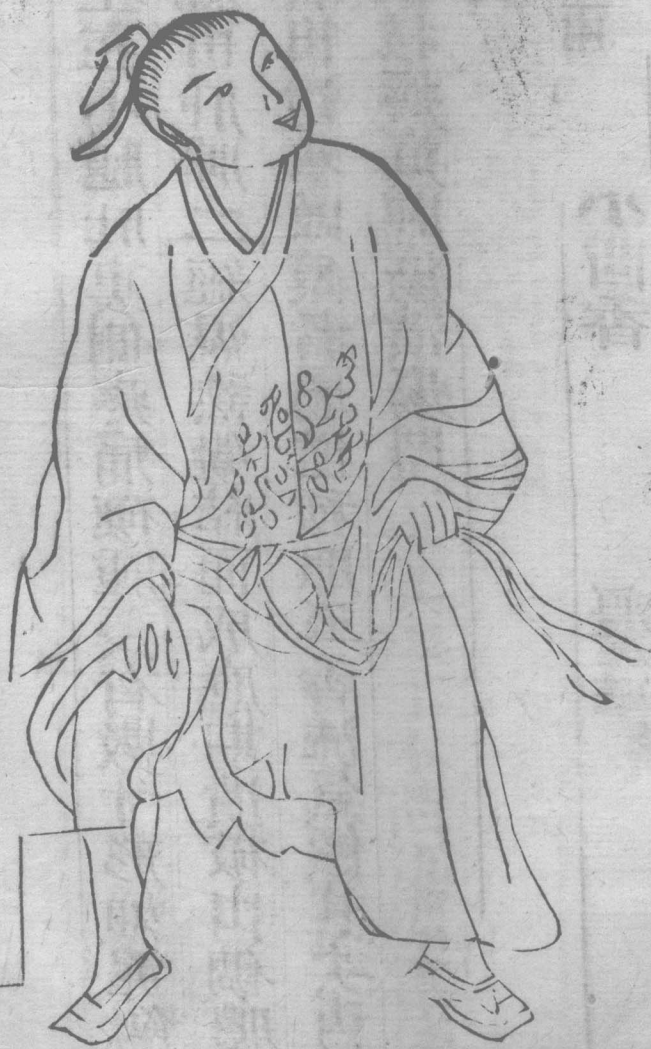
黃鯀癰生腿肚裏長數寸紅腫形如泥鯀左右皆同