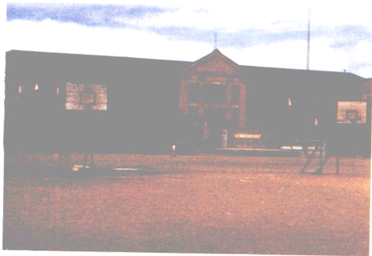
沈阳市第五中学教学楼