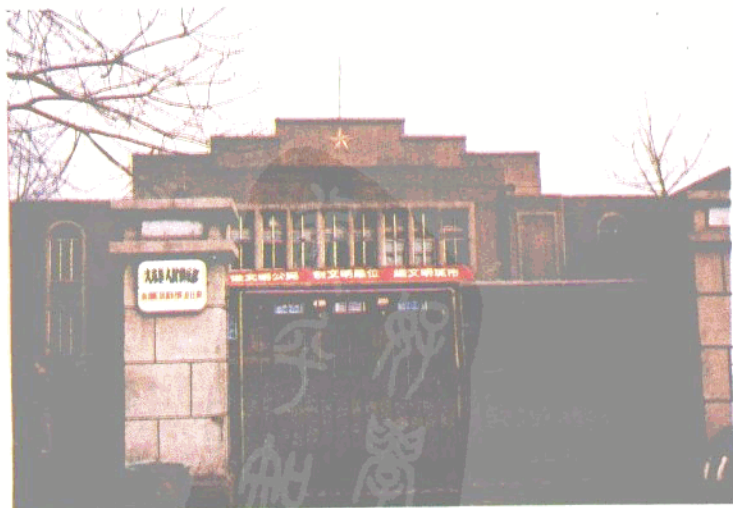
大东区人民俱乐部