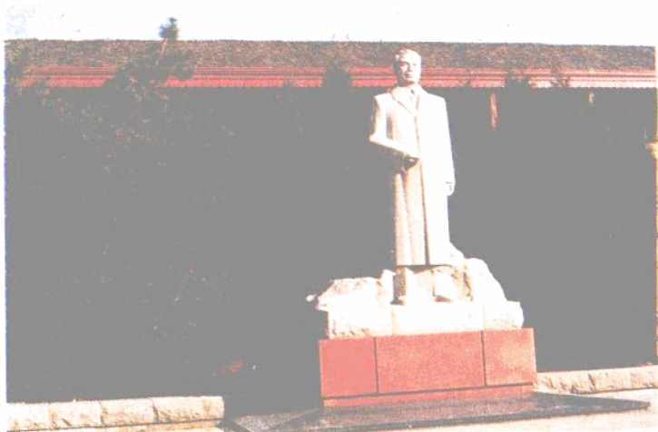
周恩来少年读书旧址 系沈阳市重点文物保护单位之一