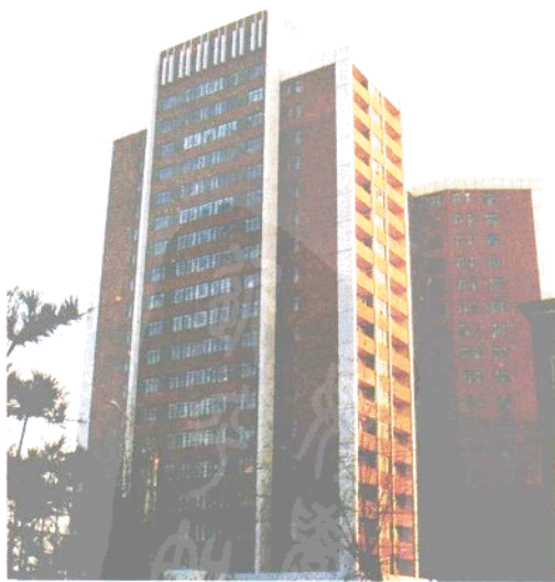
大东区津桥路十八层高楼住宅