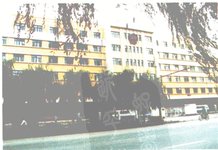
大东区人民政府办公楼