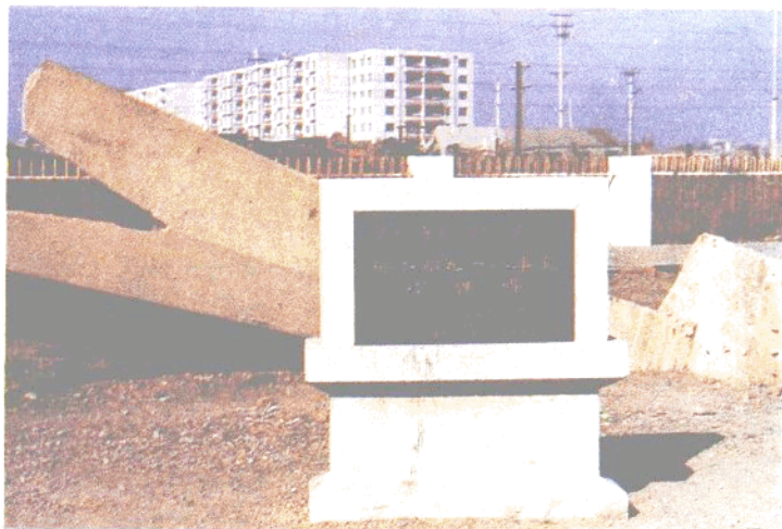
“九·一八”事变炸弹碑 系沈阳市重点文物保护单位之一