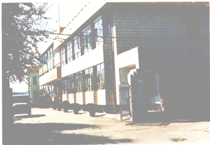
中共大东区委办公楼