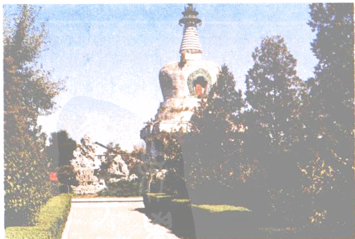
东塔 系沈阳市重点文物保护单位之一