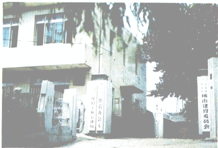
大东区域建委办公楼