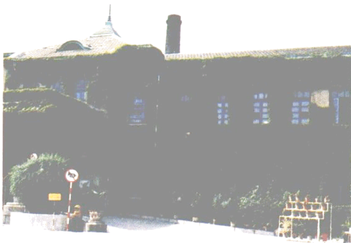
三五〇五厂办公楼的垂直绿化