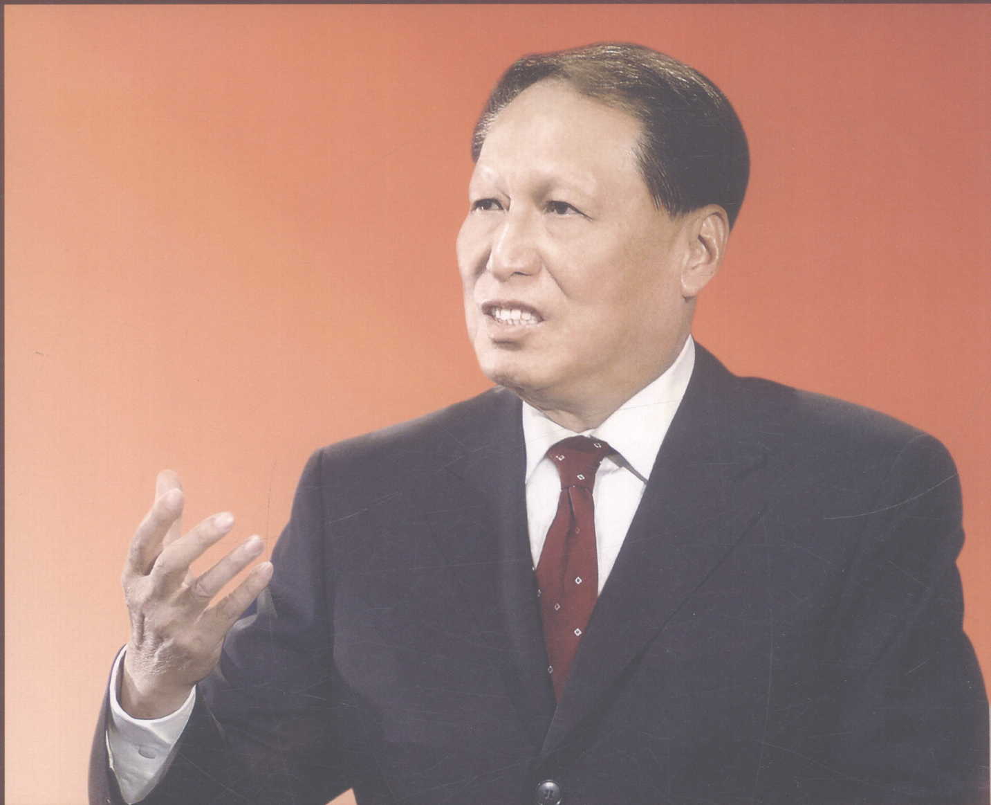
全国人大常委会副委员长成思危同志接受本报采访。