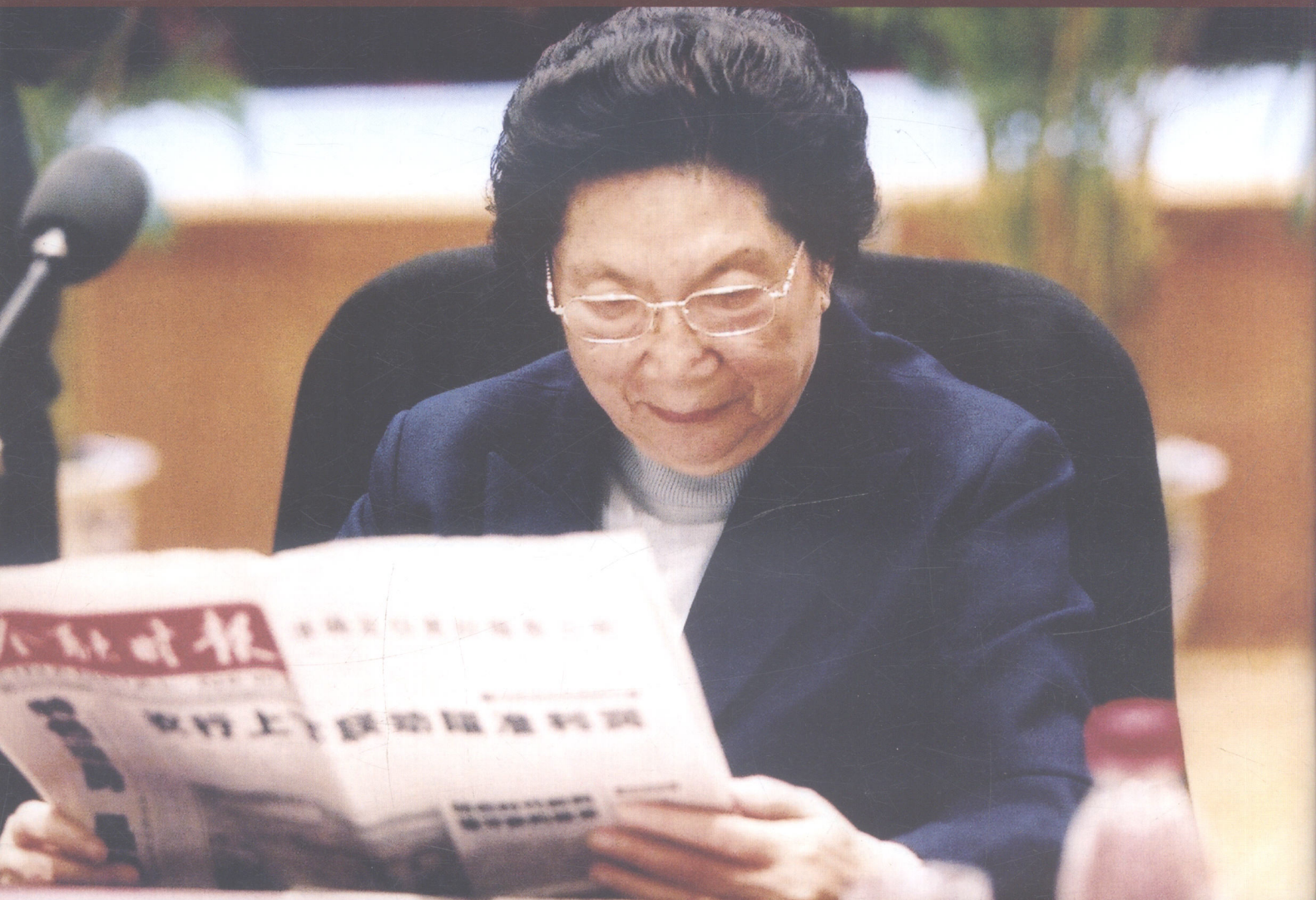
全国人大常委会原副委员长、中国人民银行原行长陈慕华同志出席金融时报社2002年4月29日举办的“纪念邓小平同志为《金融时报》题写报名暨《金融时报》创刊十五周年座谈会”。