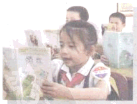
认真读书 精神饱满