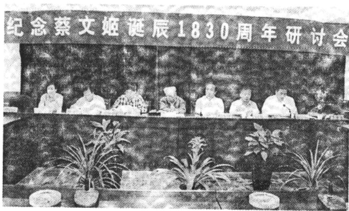
尉氏县举行蔡氏文化学术研讨会

著名女诗人蔡琰，字文姬，177 年初夏出生于河南省尉氏县蔡家庄。八月三十一日，来自海峡两岸及省地市 50 余名专家学者，云集尉氏隆重纪念蔡文姬诞辰 1830 周年。