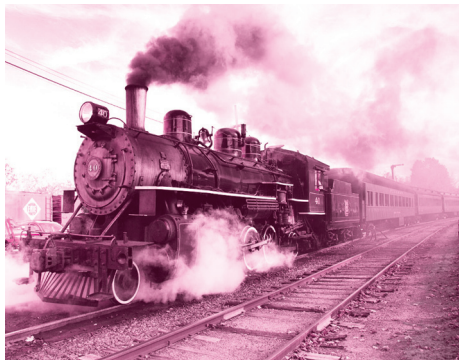
✦ 蒸汽火车：利用煤为动力，蒸汽机为核心的最古老的火车。

三个人就这样你一言我一语，你一问我一答地谈着。在不知不觉中夜已经很深了，海伦的脸上流下了感动和同情的泪水。