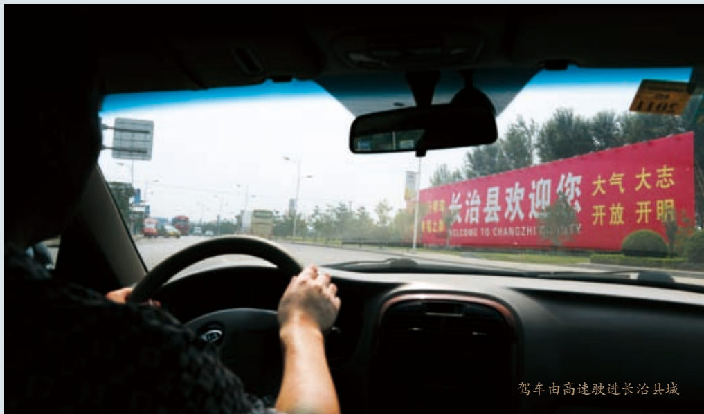
驾车由高速驶进长治县城