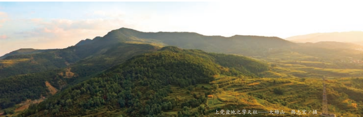
上党盆地之擎天柱——大雄山