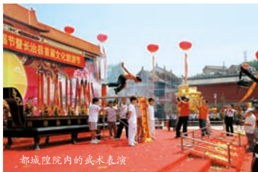
都城隍院内的武术表演

一座庙名扬天下。都城隍庙坐落于东南部一座并不雄伟的山头上。却因与刘秀结下善缘而名闻历史。从此这座护佑城池的庙宇不在城内，而待在山野间，令历史大跌眼镜，而它竟是不以为奇，反而敢以“天下城隍庙”相称。这座庙是城隍祈福文化的一个亮点，也是帝王与黎民百姓和谐相处的一种昭示，它之所以千年以来长盛不衰，折射出的是当地居民对幸福的强烈渴望。由此，