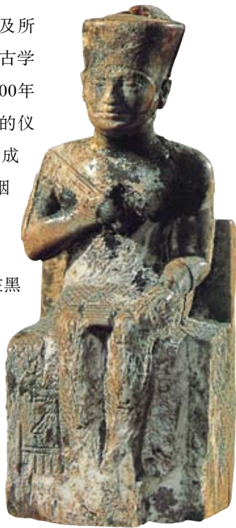
↓胡夫金字塔内出土的胡夫像

人们对胡夫金字塔的研究越深入，遇到的难题也越多。沉默的金字塔简直就是古埃及人留在沙漠中的一座谜语之宫。它的存在，是对人类智慧与想象力无休止的挑战。