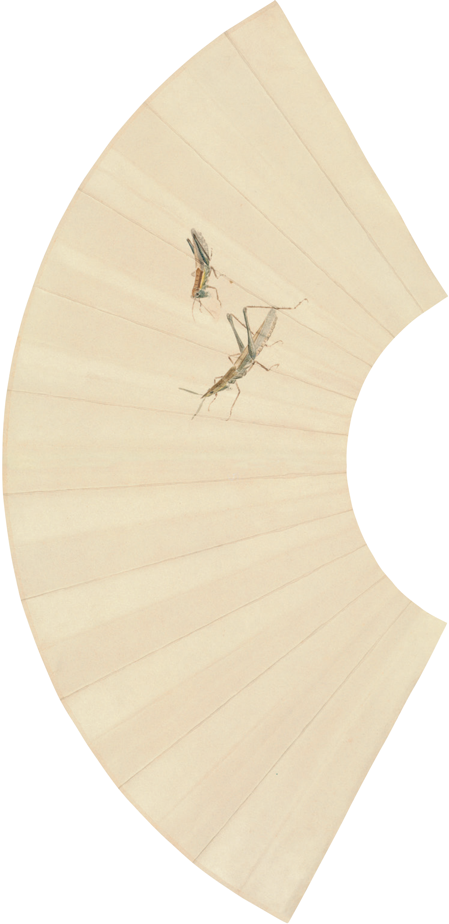
蚱蜢与蝗虫 纸本 设色 56.5cm x 27cm