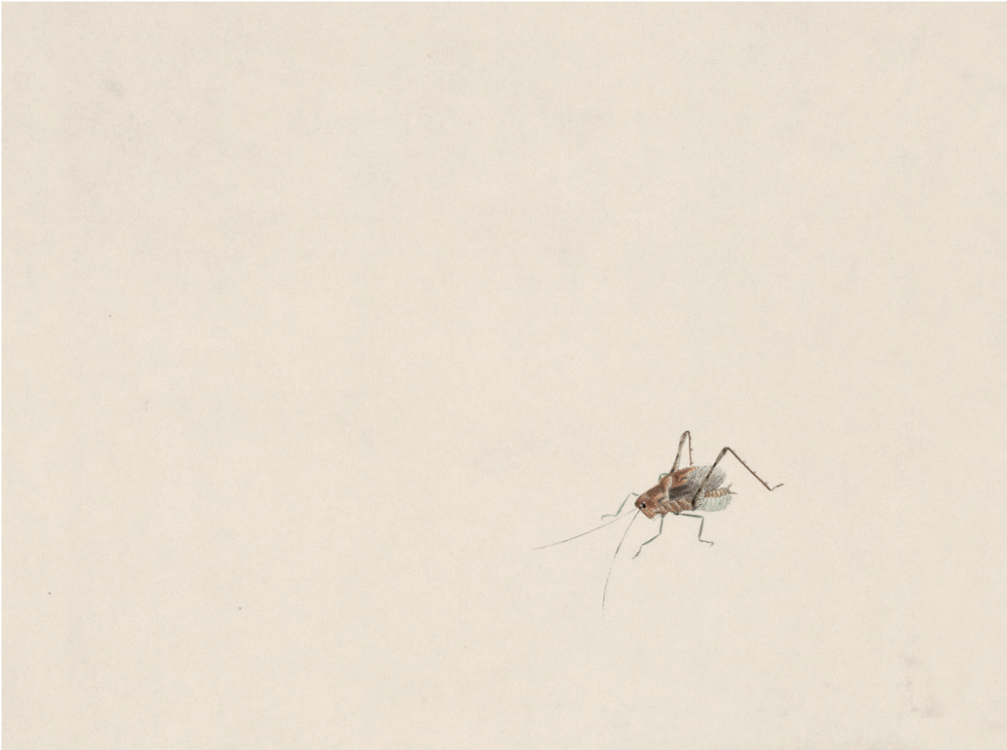
蝻蝻（局部） 纸本 设色 全图 34cm × 27cm