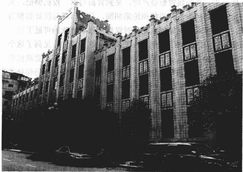
广西银行（今交通银行）

大中路，是由原塘基街、考棚街相连而成的。民国十八年加以扩建后改称大中上路和大中下路。它处于市区的中心位置，故名。它往南与繁华的南环路相连，经大南路直下大东路可达东出口；往西通过桂江一桥过河西，经大学路、文澜路转新兴一路可达西出口；往北经桂北路到桂林路可达北出口。其