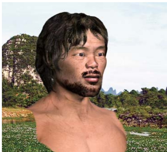
甑皮岩人男性复原像

除了狩猎，甑皮岩人还从水里大量捕捞螺蛳和蚌蚬等贝类动物以及鲤鱼、龟鳖、螃蟹甚至鳄鱼。甑皮岩文化堆积中螺蚌壳比比皆是，共发现的贝类壳达81000多块，计49种类。此外，甑皮岩人还大量采集周边丰富的山核桃、杨梅、山黄皮、山葡萄、野蔷薇、火把果、酸枣、白叶莓等野果以及山药、何首乌、参