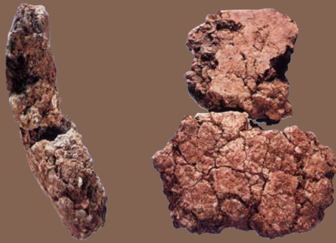
甑皮岩第一期陶片（年代距今12000~11000年）