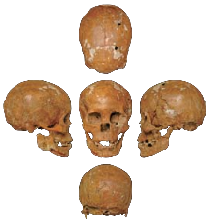
出土的甑皮岩人男性头骨