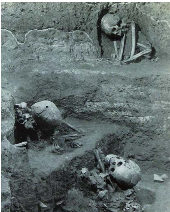
1973年发现的屈肢蹲葬墓剖面

和东南亚地区还保留着蹲葬死者的古老习俗。由此可见，桂林是华南和东南亚屈肢蹲葬习俗的起源地。