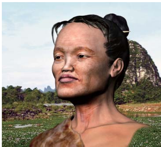
甑皮岩人女性复原像