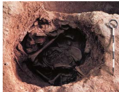
2001年发现的屈肢蹲葬墓 (上：墓坑上部压着石块；下： 移除石块后的蜷曲的人骨)