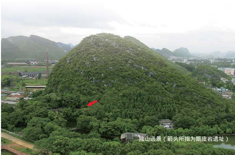
独山远景（箭头所指为甑皮岩遗址）