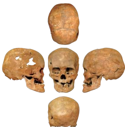
出土的甑皮岩人女性头骨