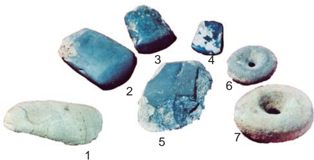
甑皮岩遗址出土的新石器