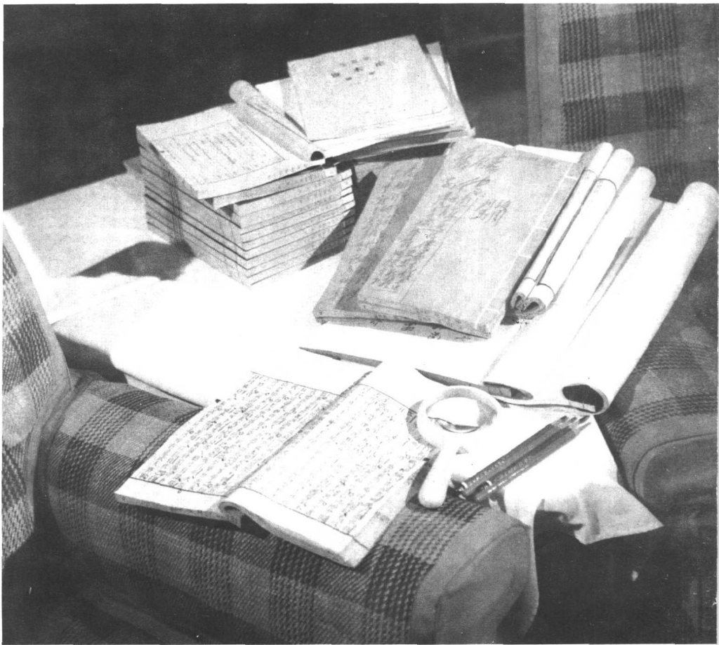
毛泽东阅读过的《资本论》等书。