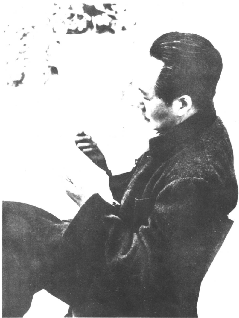
1946年毛泽东在审阅文件