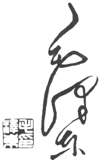
堪称双绝的毛泽东签名和印章