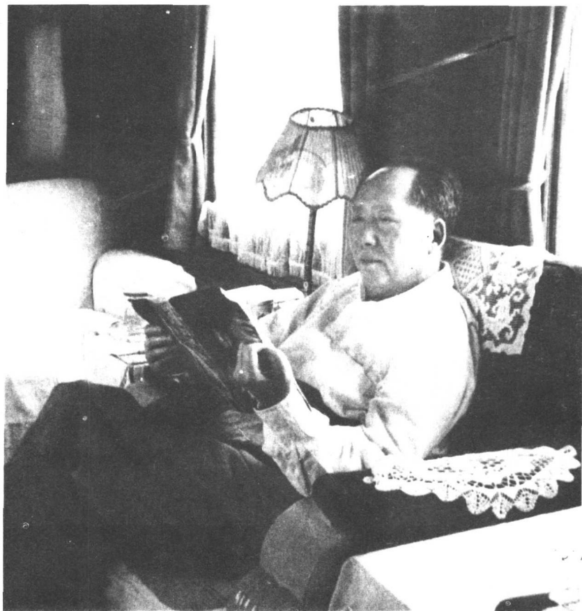
1962年毛泽东在火车上看书