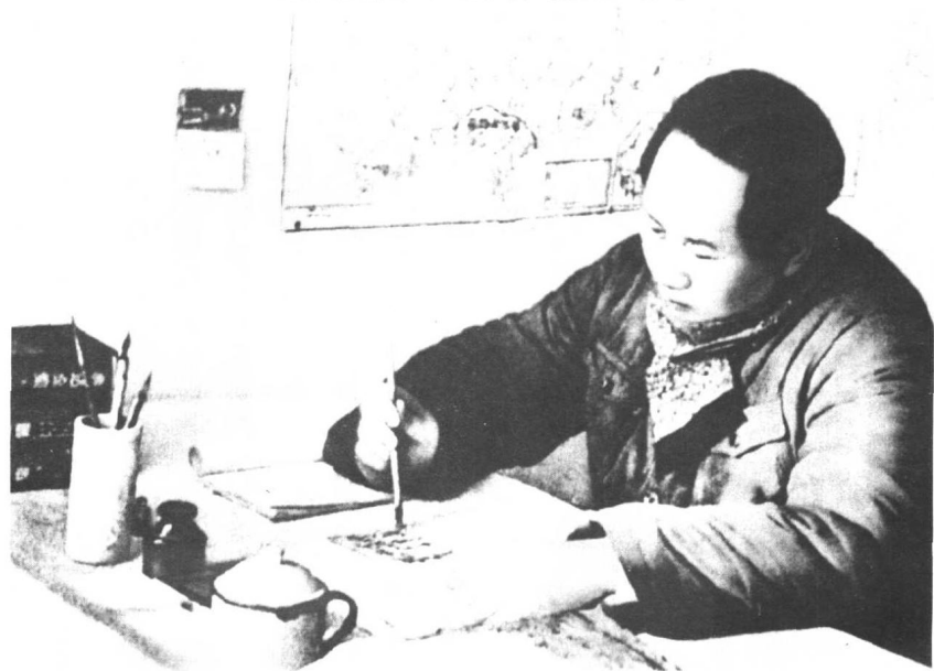
1946年毛泽东在枣园窑洞工作