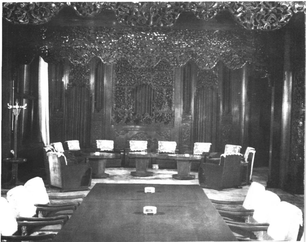
毛泽东在中南海会客厅