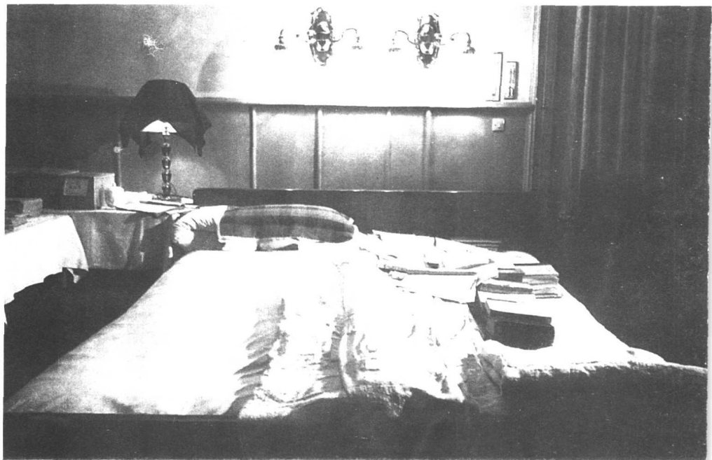
毛泽东在中南海卧室的木床。床上的毛巾被有许多补丁。右边放的书是为了便于随时阅读。