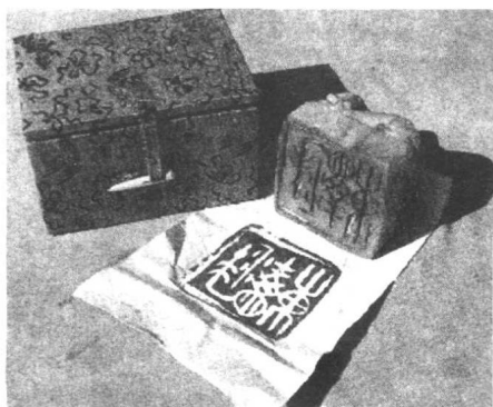
著名篆刻家邓散木为毛泽东治的印。受到毛泽东的喜爱。