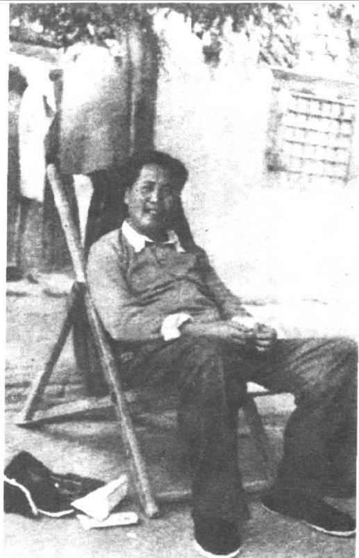
毛泽东身穿羊毛衫,在躺椅上休息