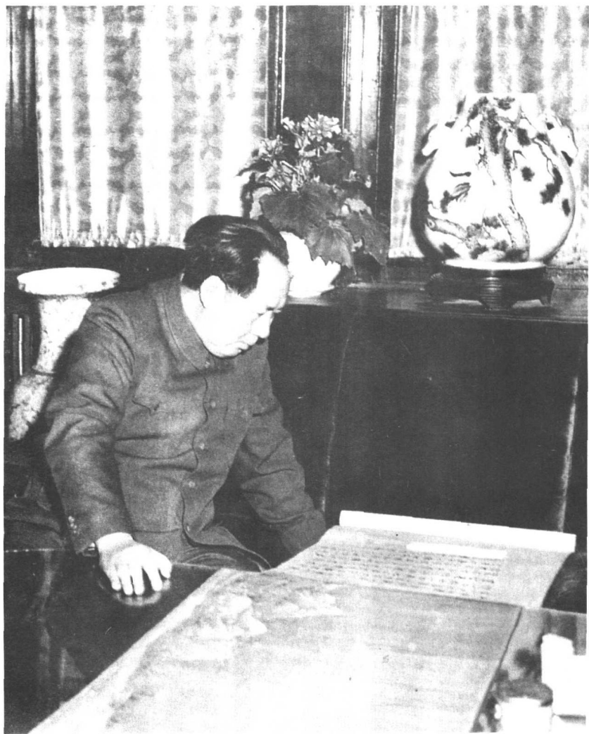
1953年毛泽东观察中国古画