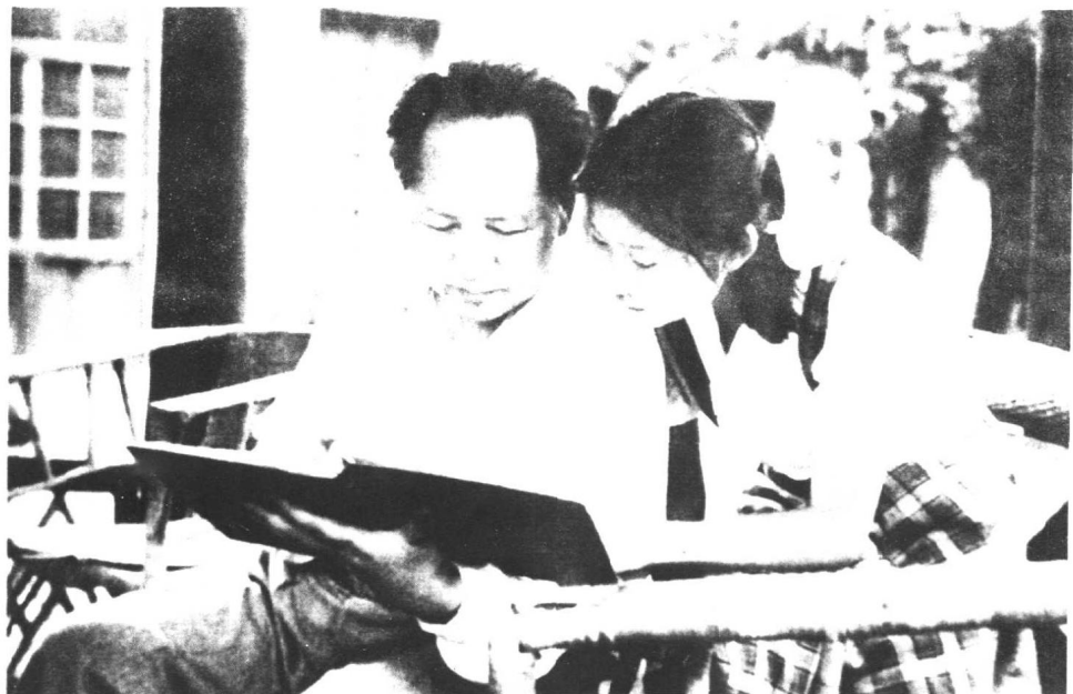
1951年毛泽东和李敏一起看影集