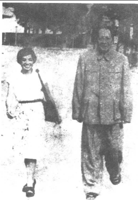
毛泽东和他的护士长吴旭君的合影。