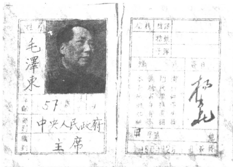
这个持枪证是1950年12月由中央办公厅主任杨尚昆，按规定签发给毛泽东的，实际上并未给他配发枪支。