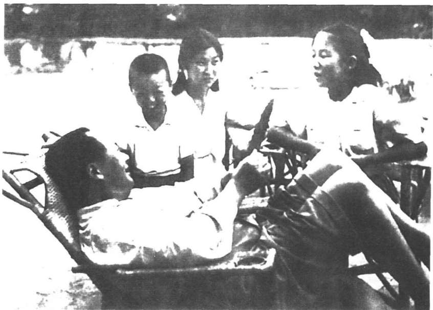
1951年8月9日，毛泽东同长女李敏、次女李讷等在香山讲故事。