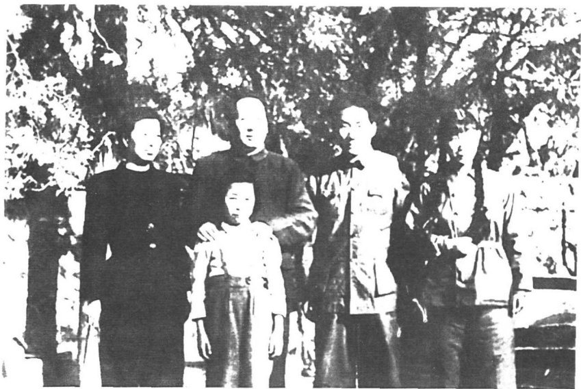
1949年，毛泽东和长子毛岸英（右二）、儿媳刘松林（右一）、女儿李讷在北平香山