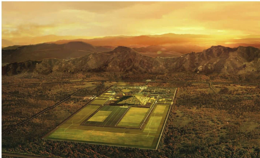
秦始皇帝陵遗址公园规划图

下面请大家跟随我参观秦始皇帝陵遗址公园（简称秦陵遗址公园）。秦陵遗址公园也叫丽山园，其全称为“秦始皇帝陵博物院·丽山园”。因为