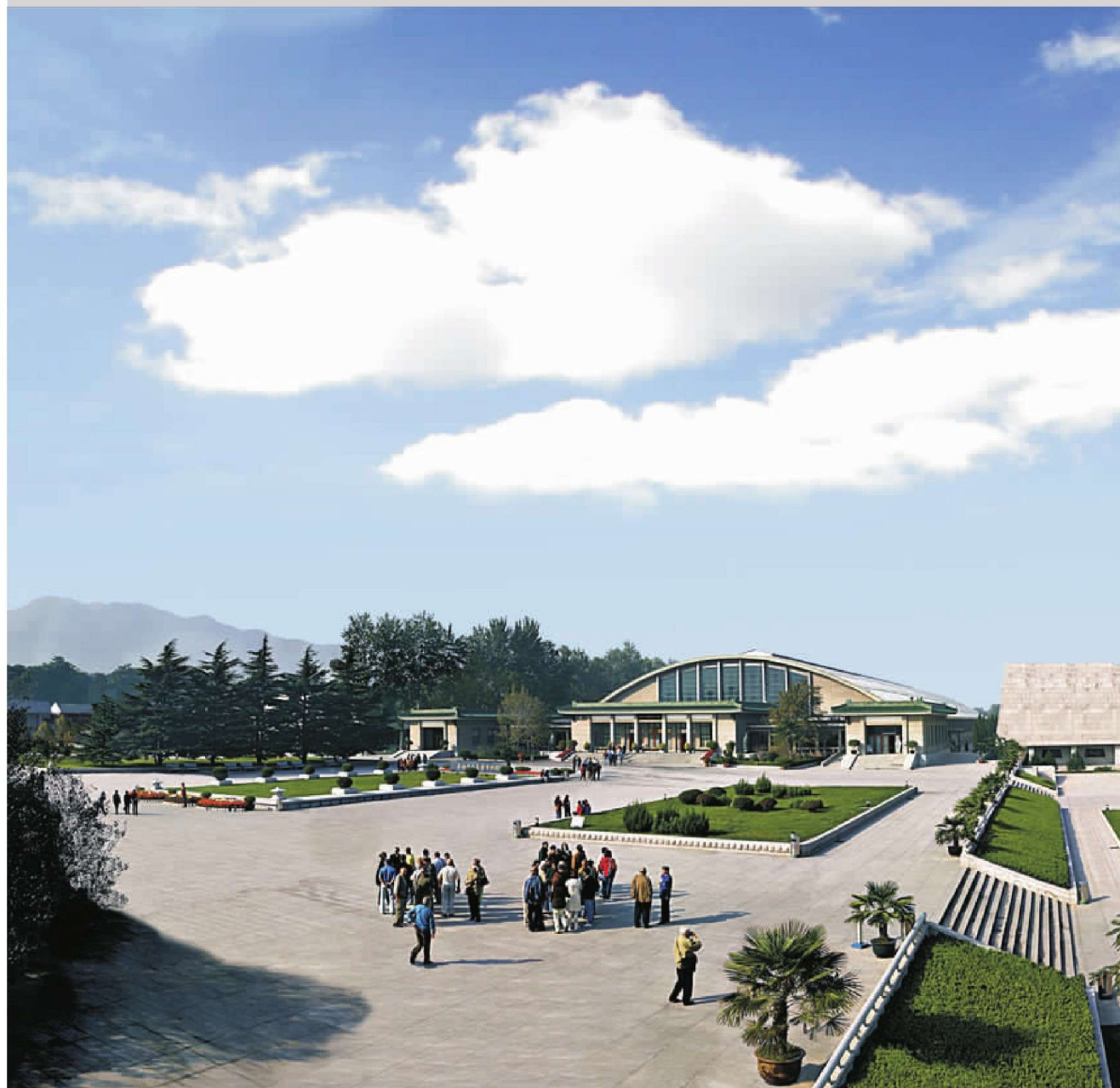
秦始皇帝陵博物院·兵马俑博物馆外景